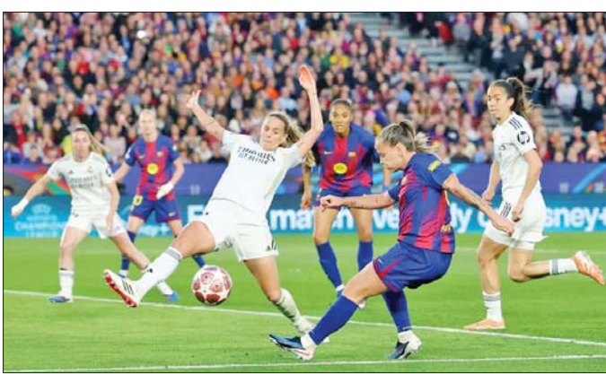
ဘာစီလိုနာအမျိုးသမီးအသင်းနှင့် ရီးယဲလ်မက်ဒရစ်အမျိုးသမီးအသင်းတို့ ယှဉ်ပြိုင်ကစားကြစဉ်။

ဘာစီလိုနာ အမျိုးသမီးအသင်းနဲ့ လိုင်ယွန်အမျိုးသမီးအသင်းတို့ဟာ ဧပြီ ၂ ရက်ညပိုင်းက ယှဉ်ပြိုင်ကစားခဲ့တဲ့ အမျိုးသမီးချန်ပီယံလိဂ် ကွာတားဖိုင်နယ်အဆင့်ပွဲစဉ်မှာ ပြိုင်ဘက်အသင်းအသီးသီးကို အနိုင်ရပြီး ဆီမီးဖိုင်နယ်အဆင့်ကို တက်လှမ်းခွင့်ရရှိခဲ့ပြီဖြစ်ပါတယ်။ ဘာစီလိုနာ အမျိုးသမီးအသင်းဟာ ရီးယဲလ်မက်ဒရစ် အမျိုးသမီးအသင်းနဲ့ ယှဉ်ပြိုင်ကစားခဲ့ရတာဖြစ်ပြီး ဘာစီလိုနာ အမျိုးသမီးအသင်းက ရီးယဲလ်မက်ဒရစ် အမျိုးသမီးအသင်းကို စာမျက်နှာ ၂၀ ကော်လံ ၁ သို့ ၀