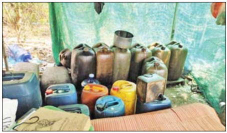
Call Center သို့ တိုင်ကြားလာမှုအရ တရားမဝင်စက်သုံးဆီ သို့လှောင်ရောင်းချနေမှုများအား ဖမ်းဆီးရမိမှု ဓာတ်ပုံမှတ်တမ်းများ။

ပြည်သူများအနေဖြင့် Call Center သို့ သိရှိလိုသည်များ မေးမြန်းခြင်း၊ သတင်းပေးပို့တိုင်ကြားလာခြင်းများ အပေါ် ဖြေရှင်းဆောင်ရွက်ပေးလျက်ရှိရာ ဧပြီ ၃ ရက်တွင် ပဲခူးတိုင်းဒေသကြီး အုတ်တွင်းမြို့နယ် ဗောဓိကုန်းကျေးရွာ ရန်ကုန်-မန္တလေးအမြန်လမ်း ၁၃၈ မိုင်ရှိ "BOC" စက်သုံးဆီအရောင်းဆိုင်သည် စက်သုံးဆီများကို ကန့်သတ်ရောင်းချနေကြောင်း Call Center သို့ တိုင်ကြားလာမှုအရ စစ်ဆေး