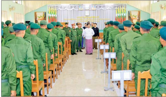
လက်ခံရယူသည်။ ယင်းနောက် ဒေသကွပ်ကဲရေးမှူးက စစ်မှုထမ်းဆောင်ခြင်း အောင်မြင်စွာပြီး မြောက်ခဲ့သည့် ပြည်သူ့စစ်မှုထမ်းအမှတ်စဉ် (၁) မှ စစ်သည်များအား ဂုဏ်ပြုချီးမြှင့်ပေးအပ်ရာ စစ်သည်များကိုယ်စား ကိုယ်စားလှယ်တစ်ဦးက လက်ခံရယူသည်။

ဦးစွာ ပြည်နယ်ဝန်ကြီးချုပ်နှင့် ဒေသကွပ်ကဲရေးမှူးက ဂုဏ်ပြုအမှာစကားများ ပြောကြားကြသည်။ ထို့နောက် ပြည်နယ်ဝန်ကြီးချုပ်က စစ်မှုထမ်းဆောင်ခြင်း အောင်မြင်စွာပြီးမြောက်ခဲ့သည့် ပြည်သူ့စစ်မှုထမ်း အမှတ်စဉ် (၁) မှ စစ်သည်များအား ဂုဏ်ပြုထောက်ပံ့ပစ္စည်းများ ချီးမြှင့်ပေးအပ်ရာ စစ်သည်များကိုယ်စား ကိုယ်စားလှယ်တစ်ဦးက