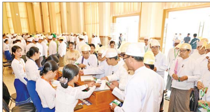
တတိယအကြိမ် ပြည်ထောင်စုလွှတ်တော် နိုင်ငံတော်သမ္မတ ရွေးချယ်တင်မြောက်ပွဲသို့ တက်ရောက် လာကြသည့် ပြည်ထောင်စုလွှတ်တော်ကိုယ်စားလှယ်များကို တွေ့ရစဉ်။

သည်။ ယင်းနောက် နိုင်ငံတော်သမ္မတ ရွေးချယ်တင် မြောက်ရန် လျှို့ဝှက်ဆန္ဒပြုထားသည့် ဆန္ဒမဲ လက်မှတ်များကို သမ္မတရွေးချယ်တင်မြောက်ရေး အဖွဲ့ဝင်များရှေ့မှောက်၌ ဖွင့်လှစ်ပြီး သက်ဆိုင်ရာ နည်းဥပဒေများနှင့်အညီ စိစစ်ရေတွက်၍ နိုင်ငံတော် သမ္မတလောင်းတစ်ဦးချင်းစီရရှိသော ထောက်ခံ ဆန္ဒမဲအနည်း၊ အများအလိုက် အမည်စာရင်း ပုံစံ(၁၅) တွင် နိုင်ငံတော်သမ္မတ စိစစ်ရေးအဖွဲ့ဝင်များက လက်မှတ်ရေးထိုး မှတ်တမ်းတင်ကြသည်။