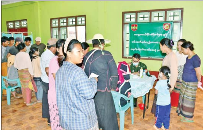
အားပေးပြီး အဆိုပါဘုန်းတော်ကြီးကျောင်းတိုက်များနှင့် နက်ကပ်လျှာခါနီးဆရာတော်အား ဖူးမြော်ကြည့်ညှိကာ လှူဖွယ်ပစ္စည်းကြွကြောင်း သိရသည်။

နမ့်စန်မြို့ မက်မွန်မုန်းကျေးရွာရှိ ဘုန်းတော်ကြီးကျောင်း၌ အခြေပြု၍ အဆိုပါကျေးရွာရှိ သံဃာတော်လေးပါးနှင့် ဒေသခံပြည်သူ ၁၂ ဦးတို့ကို နှလုံးရောဂါ၊ ဆီးချိုရောဂါ၊ သွေးတိုးရောဂါ၊ အသည်းရောဂါ၊ အသက်ရှူလမ်းကြောင်းဆိုင်ရာရောဂါ၊ သွားနှင့်ခံတွင်းရောဂါ၊ သားဖွားမီးယပ်ရောဂါ၊ အထွေထွေရောဂါတို့နှင့်ပတ်သက်၍ ကျန်းမာရေးစစ်ဆေးကုသပေးခြင်းများ ဆောင်ရွက်ပေးပြီး ဆေးရုံတက်ရောက်ကုသရန် လိုအပ်သောလူနာများအား နမ့်စန်မြို့ရှိ တပ်မတော်ဆေးရုံသို့ တက်ရောက်ကုသနိုင်ရေး စီစဉ်ဆောင်ရွက်ပေးသည်။ ဆက်ကပ်လျှာခါနီး ယင်းသို့ ဆောင်ရွက်ပေးနေမှုများကို တိုင်းစစ်ဌာနချုပ်မှ တာဝန်ရှိသူများက သွားရောက်ကြည့်ရှု