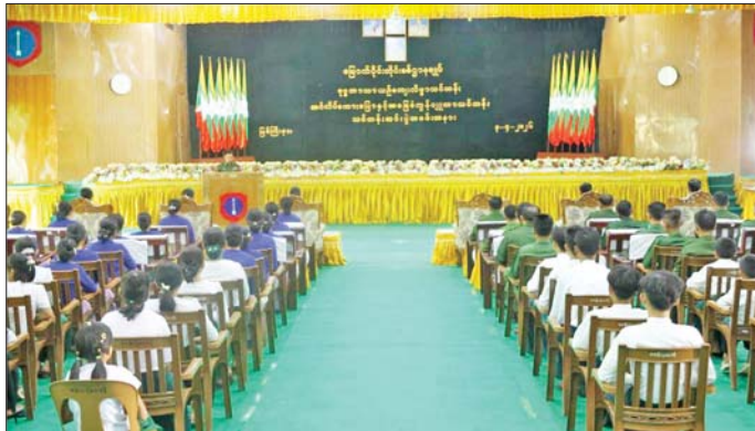
မြောက်ပိုင်းတိုင်းစစ်ဌာနချုပ်၌ ဗုဒ္ဓဘာသာယဉ်ကျေးလိမ္မာသင်တန်း၊ အင်္ဂလိပ်စကားပြောသင်တန်းနှင့် အခြေခံကွန်ပျူတာသင်တန်း သင်တန်းဆင်းပွဲများ ပြုလုပ်စဉ်။

တိုင်းစစ်ဌာနချုပ်အသီးသီးရှိ တပ်မတော်သား မိသားစုဝင်သားသမီးများ နေရာသိကျောင်းပိတ်ရက် များတွင် အားလပ်ချိန်ကို အကျိုးရှိစွာ အသုံးပြုရန်အတွက် စေရန်၊ ဘာသာ၊ သာသနာကို တန်ဖိုးထားတတ်စေ ရန်နှင့် ယဉ်ကျေးလိမ္မာသည့် သားကောင်း သမီး ကောင်းများအဖြစ်သာမက မိမိပတ်ဝန်းကျင်၊ မိမိ နိုင်ငံအတွက် အကျိုးပြုနိုင်ပြီး ဘာသာသာသနာကို အရှည်တည်တံ့တိုးတက်ခိုင်မြဲအောင် ဆောင်ရွက်နိုင် သည့် နိုင်ငံသားကောင်း၊ သမီးကောင်းရတနာများဖြစ် ရန်အတွက် စာရိတ္တကောင်းမွန်ပြီး ပညာထူးချွန်သူများ ဖြစ်လာစေရန်၊ လက်တွေ့အသုံးပြု ဘာသာရပ်များ နှင့်အတူ ဗဟုသုတရစေပြီး အတတ်ပညာများတိုးပွား စေရန် ရည်ရွယ်၍ ဖွင့်လှစ်ခဲ့သည့် ဗုဒ္ဓဘာသာ ယဉ်ကျေးလိမ္မာသင်တန်း၊ အင်္ဂလိပ်စကားပြော သင်တန်းနှင့် အခြေခံကွန်ပျူတာသင်တန်း သင်တန်း ဆင်းပွဲများကို ယနေ့တွင် မြောက်ပိုင်းတိုင်းစစ်ဌာန ချုပ်ရုံးရှိ ဗလင်းထင်ခန်းမ၌လည်းကောင်း၊ အရှေ့ပိုင်း တိုင်းစစ်ဌာနချုပ်ရှိ သံလွင်ခန်းမ၌လည်းကောင်း၊ အနောက်တောင်တိုင်းစစ်ဌာနချုပ်ရှိ ဧရာဝတီခန်းမ၌