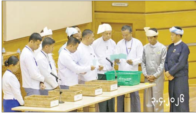
နိုင်ငံတော်သမ္မတရွေးချယ်တင်မြောက်ရန် လျှို့ဝှက်ဆန္ဒပြုထားသည့် ဆန္ဒမဲလက်မှတ်များကို သမ္မတ ရွေးချယ်တင်မြောက်ရေးအဖွဲ့ဝင်များ ရှေ့မှောက်၌ ပြည်ထောင်စုလွှတ်တော်ရုံးမှ တာဝန်ရှိသူများ က ရေတွက်စစ်ဆေးကြသည်။

ယင်းနောက် ပြည်ထောင်စုလွှတ်တော်နာယက၊ ပြည်သူ့လွှတ်တော်ဥက္ကဋ္ဌ၊ ပြည်ထောင်စုလွှတ်တော် ဒုတိယနာယက၊ ပြည်သူ့လွှတ်တော်ဒုတိယဥက္ကဋ္ဌ