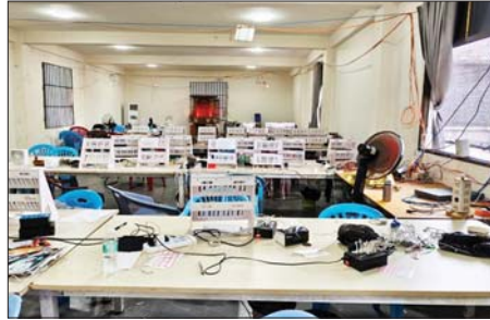
မူဆယ်မြို့ ကောင်းမှုလွယ်ရပ်ကွက်၌ အွန်လိုင်းလိမ်လည်လောင်းကစားမှု လုပ်ကိုင်သည့် နေအိမ်နှင့် လုပ်ငန်းနေရာကို တွေ့ရစဉ်။

ထို့အတွက် ဓာတ်အားပြတ်စေရယာများရှိ ဓာတ်အားသုံးစွဲသူ မိဘပြည်သူများအား သက်ဆိုင်ရာ မြို့နယ်လျှပ်စစ်အင်ဂျင်နီယာရုံးများမှ တစ်ဆင့် ကြိုတင်အသိပေးထားပြီးဖြစ်ကြောင်း လျှပ်စစ်နှင့် စွမ်းအင်ဝန်ကြီးဌာနမှ သိရသည်။ သတင်းစဉ်