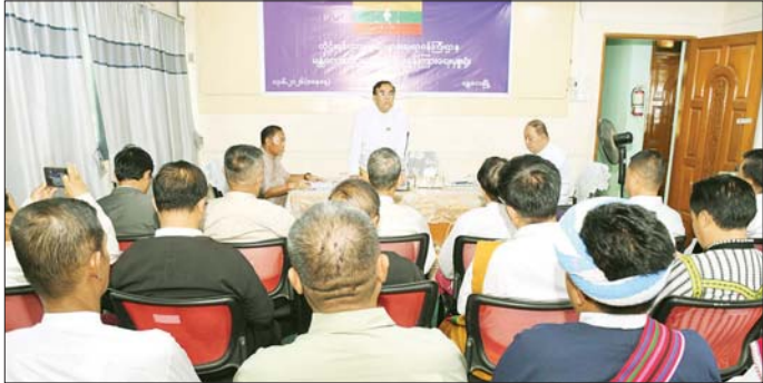
အနားကျင်းပရေးနိုင်ရေးအတွက် မြေကွက်နေရာရရှိ ဆောင်ရွက်ပေးပြီး ချီးမြှင့်ထောက်ပံ့ပေးမှုများ ပေးအပ် ရေးဆိုင်ရာကိစ္စများကို ဆွေးနွေးတင်ပြကြရာ ခွဲကြောင်း သိရသည်။ ပြည်ထောင်စုဝန်ကြီးက ပေါင်းစပ်ညှိနှိုင်းဖြည့်ဆည်း သတင်းစဉ်

ဗုဒ္ဓဟူးနေ့တွင် အဆိုပါရုံးအစည်းအဝေးခန်းမ၌ မန္တလေးတိုင်းဒေသကြီးအတွင်းရှိ တိုင်းရင်းသား စာပေနှင့်ယဉ်ကျေးမှုအသင်းအဖွဲ့များနှင့် တွေ့ဆုံ အမှာစကားပြောကြားသည်။ ယင်းနေ့က ကရင်၊ ချင်း၊ မွန်၊ ရခိုင်၊ ရှမ်း၊ ကိုးကန့်၊ တအာင်း၊ နာဂ၊ ချမ်းနီ၊ ပအိုဝ်း၊ လီဆူနှင့် မယ်တိုင်(ကသ) တိုင်းရင်းသားစာပေ နှင့် ယဉ်ကျေးမှုအသင်းအဖွဲ့များက ဒေသပစ္စည်းများ ဆိုင်ရာကိစ္စများ၊ ယဉ်ကျေးမှုဆိုင်ရာကိစ္စရပ်များ၊ နိုင်ငံသားစိစစ်ရေးကတ်တွင် တိုင်းရင်းသားလူမျိုး အမည်မှားယွင်းမှုကိစ္စများ၊ တိုင်းဒေသကြီးအတွင်း တိုင်းရင်းသားများ၏ နေထိုင်မှုပုံစံတော် အခမ်း