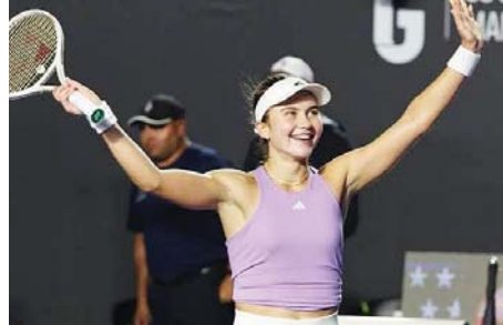
အမေရိကန် နာမည်ကျော်တင်းနစ်မယ် အီလာယိုပစ်ချီ

HSBC Championships တင်းနစ်အမျိုးသမီးတစ်ဦးချင်းပြိုင်ပွဲ အမေ ရိကန် နာမည်ကျော်တင်းနစ်မယ် အီလာယိုပစ်ချီက တစ်နိုင်ငံတည်းသူ အမန်ဒါ အနီဆီမီဇာကို အကြိတ်အနယ်ယှဉ်ပြိုင်ပြီး ၆-၂၊ ၃-၆၊ ၆-၃ ရလဒ်ဖြင့် နိုင်ပွဲရရှိကာ ဆီမီးဖိုင်နယ်သို့ တက်လှမ်းနိုင်ခဲ့ပြီ ဖြစ်သည်။ ၎င်းသည် ပြိုင်ပွဲတစ်လျှောက်တွင် ခရိုအေးရှားတင်းနစ်မယ် ရူစစ်၊ ဖိလစ်ပိုင်တင်းနစ်မယ် အယ်လာတိုကို ကျော်ဖြတ်ထားသူ ဖြစ်သည်။ ယိုပစ်ချီသည် ယခုပြိုင်ပွဲမတိုင်မီ ယှဉ်ပြိုင်ခဲ့သည့် ပြင်သစ်အိုးပင်း ပြိုင်ပွဲတွင် တတိယအဆင့်အထိသာ တက်လှမ်းနိုင်ခဲ့ပြီး ပြိုင်ဘက် ဂျပန်တင်းနစ်မယ် အိုဆာကာကို ရှုံးနိမ့်ခဲ့သည့်အတွက် နောက်တစ် ဆင့် တက်လှမ်းရန် လှုံ့ဆော်ထားသူ ဖြစ်သည်။ အသက် ၁၈ နှစ်အရွယ် ယိုပစ်ချီသည် ယခုနှစ်အတွင်း ဆီမီးဖိုင်နယ်သို့ လေးကြိမ်မြောက် တက် ရောက်နိုင်ခဲ့ခြင်း ဖြစ်သည်။