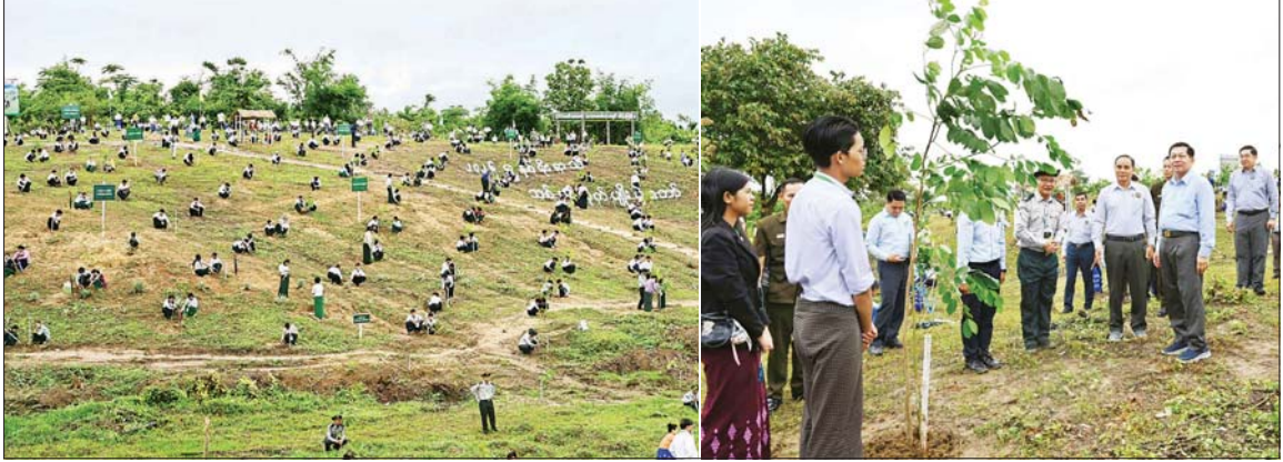
နိုင်ငံတော်သမ္မတ ဦးမင်းအောင်လှိုင် ၂၀၂၆ ခုနှစ် - မိုးရာသီ နိုင်ငံတော်အဆင့် ပထမအကြိမ် သစ်ပင်စိုက်ပျိုးပွဲအခမ်းအနားတွင် တက်ရောက်လာကြသူများက ပျိုးပင်များ စိုက်ပျိုးနေမှုကို ကြည့်ရှုအားပေးစဉ်။

နေပြည်တော် ဇွန် ၁၃ ရန်ကုန်တိုင်းဒေသကြီး၊ စစ်ကိုင်းတိုင်းဒေသကြီး၊ အထက်ပိုင်း၊ ဧရာဝတီတိုင်းဒေသကြီး၊ ကချင်ပြည်နယ်၊ ကရင်ပြည်နယ်၊ မွန်ပြည်နယ်၊ ရခိုင်ပြည်နယ်နှင့် ရှမ်းပြည်နယ် (မြောက်ပိုင်းနှင့် အရှေ့ပိုင်း)တို့တွင် မိုးတိမ်တောင်များဖြစ်ထွန်းလျက်ရှိပြီး အဆိုပါ မိုးတိမ်တောင်များ ရွေ့လျားရာ နေရာတစ်လျှောက်တွင် မိုးရွာသွန်းခြင်းနှင့်အတူ လေပြင်းတိုက်ခတ်ခြင်း၊ မိုးထစ်ချွန်းခြင်း၊ မိုးကြိုးပစ်ခြင်း၊ လျှပ်စီးလက်ခြင်းနှင့် မိုးသီးကြွေခြင်းစသည့် မိုးလေဝသဖြစ်စဉ်များ ဖြစ်ပေါ်နိုင်ပါသဖြင့် ကြိုတင်သတိပြုနိုင်ပါရန်အကြံပြုအပ်ပါသည်။ မိုး/လေ