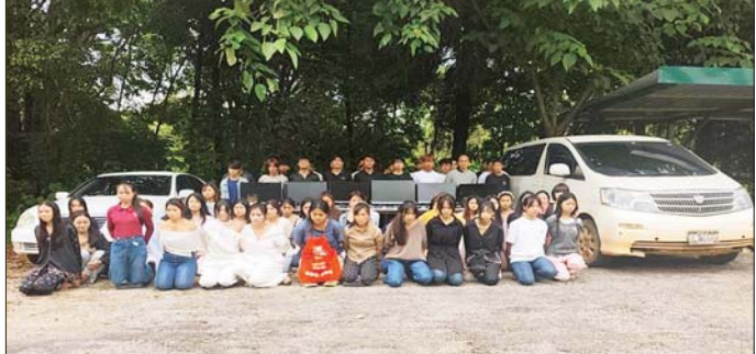
မူဆယ်မြို့ ကောင်းမှုလွယ်ရပ်ကွက်၌ အွန်လိုင်းလိမ်လည်လောင်းကစားမှုလုပ်ကိုင်သည့် တရုတ်နိုင်ငံသား အမျိုးသား ၁၇ ဦး၊ မြန်မာနိုင်ငံသား အမျိုးသား ၃၄ ဦး၊ အမျိုးသမီး ၃၇ ဦးတို့အား လုပ်ငန်းသုံးပစ္စည်းများနှင့်အတူ ဖမ်းဆီးရမိစဉ်။

ထိုသို့ လုပ်ငန်းများဆောင်ရွက်စေရန် မနန်းဓာတ်အားပေးစက်ရုံမှ ၃၃ ကေစီနှင့် ၁၁ ကေစီ၊ ဓာတ်အားလိုင်းများဖြင့် ဓာတ်အားဖြန့်ဖြူးပေးထားသော ပွင့်ဖြူမြို့၊ စလင်းမြို့၊ မင်းဘူးမြို့၊ မလွန်မြို့၊ မင်းလှမြို့၊ စကျီမြို့၊ ငပဲမြို့၊ ဆင်းဂေါင်းကျေးရွာများ၊ ထောက်ရှာပင်ရေခဲမြေနှင့် မင်းဘူးဓာတ်ငွေ့ရည်စက်ရုံတို့တွင် ဓာတ်အားယာယီပြတ်တောက်နေမည်ဖြစ်ကြောင်း၊ ဓာတ်အားပြတ်စရိယာများရှိ စက်ရုံ၊ အလုပ်ရုံများနှင့် ဓာတ်အားသုံးစွဲသူ အများပြည်သူများကို ကြိုတင်အသိပေးအကြောင်းကြားထားပြီးဖြစ်ကြောင်း သိရသည်။