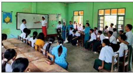
ဂန့်ဂေါမြို့တွင် မျက်စိကျန်းမာရေးစစ်ဆေးခြင်းများ ဆောင်ရွက်ပေးနေကြောင်း ဖော်ပြထားသည်။

ဂန့်ဂေါ ဇွန် ၁၃ ဂန့်ဂေါမြို့တွင် ခရိုင်ပြည်သူ့ကျန်းမာရေးဦးစီးဌာနမှ ကျောင်းသား ကျောင်းသူများအား မျက်စိကျန်းမာရေးစစ်ဆေးခြင်းများကို ယမန်နေ့က စည်ပင်သာယာရပ်ကွက်ရှိ အခြေခံပညာအလယ်တန်းကျောင်း(ခွဲ)(စည်ပင်သာယာ)ကျောင်း၌ ကွင်းဆင်းဆောင်ရွက်ရာ ခရိုင်ပြည်သူ့ကျန်းမာရေးဦးစီးဌာန ခေတ္တဆေးရုံအုပ် ခေါက်တာဝင်းထိုက်နှင့် ဝန်ထမ်းများက အဆိုပါကျောင်းမှ ကျောင်းသား ကျောင်းသူ ၅၈၉ ဦးအား မျက်စိကျန်းမာရေးစစ်ဆေးခြင်းနှင့် ကျန်းမာရေးစစ်ဆေးပေးခြင်းများကို ဆောင်ရွက်ပေးခဲ့ကြောင်း သိရသည်။ မောင်မျိုးမင်း(ပြန်/ဆက်)