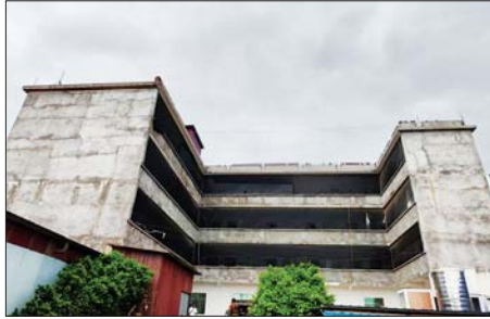
မူဆယ်မြို့ ကောင်းမှုလွယ်ရပ်ကွက်၌ အွန်လိုင်းလိမ်လည်လောင်းကစားမှု လုပ်ကိုင်သည့် နေအိမ်နှင့် လုပ်ငန်းနေရာကို တွေ့ရစဉ်။