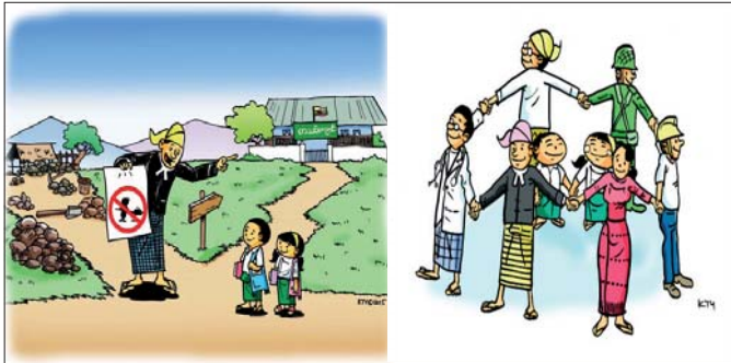
ကလေး အသက်အရွယ်ကိုရော သတ်မှတ်ထားသေးလားရှင်”

“၁၉၅၁ ခုနှစ်၊ အလုပ်ရုံများအက်ဥပဒေပုဒ်မ ၂(က)၊ ၂(ခ)နဲ့ ၂(ဂ) မှာ ကလေး၊ လူရွယ်နဲ့ လူငယ်ရဲ့ အဓိပ္ပာယ်ကို ပြဋ္ဌာန်းထားပြီး ပုဒ်မ ၂(က) မှာ ကလေး ဆိုတာ အလုပ်လုပ်ကိုင်နိုင်ရန် မှတ်ပုံတင်ဆရာဝန် က ခွင့်ပြုတဲ့ အသက်(၁၄)နှစ်ပြည့်ပြီး အသက် (၁၆) နှစ် မပြည့်သေးသူ၊ ပုဒ်မ ၂(ခ) မှာ လူရွယ်ဆိုတာ အသက် (၁၆) နှစ်ပြည့်ပြီး အသက်(၁၈)နှစ် မပြည့်သေးသူ၊ ပုဒ်မ ၂(ဂ) မှာ လူငယ်ဆိုတာ “ကလေး” နှင့် “လူရွယ်” ကိုဆိုလိုကြောင်း ပြဋ္ဌာန်းထားတယ်”