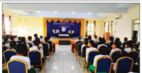
ပန်းတနော်မြို့နယ်၌ လူငယ်စကားပိုင်းကျင်းပနေကြောင်း ဖော်ပြထားသည်။

ပန်းတနော် ဇွန် ၁၃ ပန်းတနော်မြို့နယ် ပြန်ကြားရေးနှင့် ပြည်သူ့ဆက်ဆံရေးဦးစီးဌာန လူထုအခြေပြုလုပ်ငန်းနှင့် ယမန်နေ့က အမှတ်(၁)အခြေခံပညာအထက်တန်းကျောင်းမှ ကျောင်းသား ကျောင်းသူများကို ဖိတ်ခေါ်ကာ လူငယ်စကားပိုင်း ကျင်းပသည်။ လူငယ်စကားပိုင်းတွင် လူငယ်နှင့် စာပေဖတ်ရှုခြင်း၏ အကျိုးကျေးဇူး၊ လူငယ်နှင့် ကိုယ်ကျင့်တရား၊ လူငယ်နှင့် နည်းပညာကို အကျိုးရှိစွာ အသုံးပြုခြင်း၊ မူးယစ်ဆေးဝါးအန္တရာယ်ရှောင်ကြဉ်ရေးနှင့် လူငယ်တို့၏တာဝန် စသည့်ခေါင်းစဉ်များဖြင့် ကျောင်းသား ကျောင်းသူများက