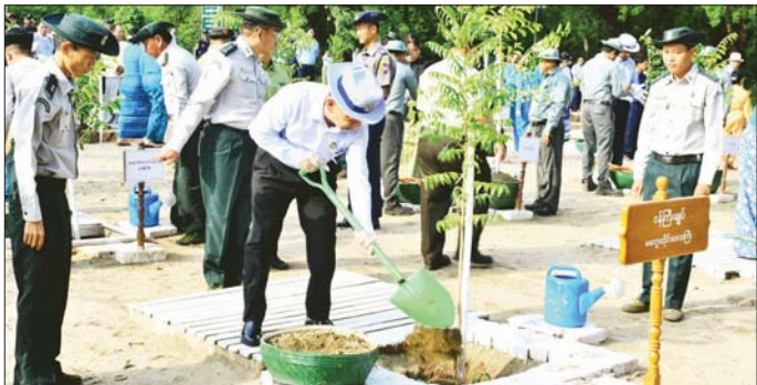
တောတောင်ခြောက်ခန်း၊ လယ်ယာနှွမ်း၏။