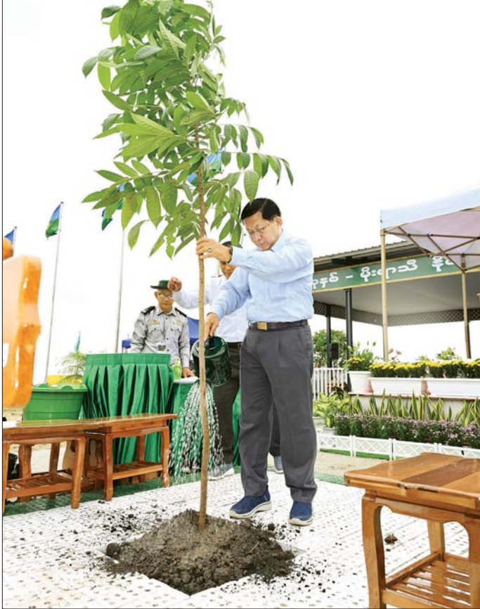
နိုင်ငံတော်သမ္မတ ဦးမင်းအောင်လှိုင် မဟော်ဂန်ပင်အား သတ်မှတ်နေရာတွင် ဦးဆောင်စိုက်ပျိုးပေးစဉ်။

စာမျက်နှာ ၃ မှ ယေဘုယျအားဖြင့် ဧက နှစ်သိန်း ကျော်နှင့် ညီမျှသည်ဟု တွက်ချက် သိရှိရကြောင်း၊ ၂၀၁၆ ခုနှစ်မှ ၂၀၂၅ ခုနှစ်အတွင်း မြန်မာနိုင်ငံ တစ်ဝန်းလုံးတွင် သစ်ပင်ပေါင်းစုံ ၂၆၅ သန်း ၈ သိန်းကျော် စိုက်ပျိုးခဲ့ သည့်အတွက် ယေဘုယျအားဖြင့် ဧက တစ်သန်းခန့်နှင့် ညီမျှသည်ကို တွေ့ရကြောင်း၊ လိုအပ်ချက်အရ အကြောင်းအမျိုးမျိုးဖြင့် သစ် အသုံးချမှုများရှိသော်လည်း စိုက်ပျိုး သည့် သစ်ပင်များ တစ်ပင်စိုက်၊ တစ်ပင်ရှင်သန်အောင် စိုက်ပျိုး ပြုစုနိုင်ခဲ့မည်ဆိုပါက သစ်ပင် သစ်တောဆုံးရှုံးမှုကို အပြည့်အဝ ကာကွယ်ပေးနိုင်မည်ဖြစ်ကြောင်း၊ ထို့အပြင် သဘာဝတောများ ပျက်စီးပြုန်းတီးမှု မရှိစေရန် အတွက် သစ်တောများ စနစ်တကျ စီမံအုပ်ချုပ် လုပ်ကိုင်ခြင်း၊ ကာကွယ် ထိန်းသိမ်းခြင်းဖြင့် သစ်တောဖုံးလွှမ်းမှု တိုးပွားလာပြီး ရာသီဥတုပြောင်းလဲမှုကို လျော့ချ ထိန်းညှိနိုင်မည်ဖြစ်ကြောင်း။