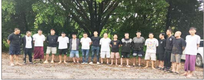
မူဆယ်မြို့ ကောင်းမှုလွယ်ရပ်ကွက်၌ အွန်လိုင်းလိမ်လည်လောင်းကစားမှုလုပ်ကိုင်သည့် တရုတ်နိုင်ငံသား အမျိုးသား ၁၇ ဦးကို ဖမ်းဆီးရမိစဉ်။