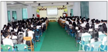
ထားဝယ်မြို့တွင် ကျင်းပသော ကျန်းမာရေးအသိပညာမြှင့်တင်ရေးဟောပြောပွဲကို ယမန်နေ့က Polytechnic University (Dawei) ၌ ကျင်းပရာ မိမိကိုယ်တိုင်ကျန်းမာရေးညီညွတ်သော အပြုအမူအကျင့်ကောင်းများ ကျင့်သုံးရုံသာမက မိမိမိသားစု၊ ပတ်ဝန်းကျင်ကိုပါ ကျန်းမာရေးအမူအကျင့်များ ဖြစ်ထွန်းရေး ကြိုပစ်ဆောင်ရွက်ပေးနိုင်သူများ ဖြစ်အောင် ကြိုးစားကြရန် လိုအပ်ကြောင်း ပြောကြားသည်။

ထားဝယ် ဇွန် ၁၃ တနင်္ဂနွေနေ့တွင်ထားဝယ်မြို့တွင် ကျန်းမာရေးအသိပညာမြှင့်တင်ရေးဟောပြောပွဲကို ယမန်နေ့က Polytechnic University (Dawei) ၌ ကျင်းပရာ မိမိကိုယ်တိုင်ကျန်းမာရေးညီညွတ်သော အပြုအမူအကျင့်ကောင်းများ ကျင့်သုံးရုံသာမက မိမိမိသားစု၊ ပတ်ဝန်းကျင်ကိုပါ ကျန်းမာရေးအမူအကျင့်များ ဖြစ်ထွန်းရေး ကြိုပစ်ဆောင်ရွက်ပေးနိုင်သူများ ဖြစ်အောင် ကြိုးစားကြရန် လိုအပ်ကြောင်း ပြောကြားသည်။