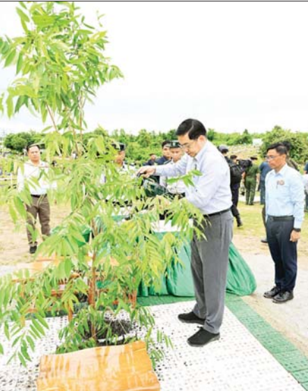
ဒုတိယသမ္မတ ဦးညိုစော သတ်မှတ်နေရာတွင် ပျိုးပင်စိုက်ပျိုးပေးစဉ်။

သစ်ပင်သစ်တောများသည် ကမ္ဘာမြေပေါ်ရှိ သက်ရှိများအားလုံး ရှင်သန် ရပ်တည်ရေးအတွက် အလွန်အရေးပါလှကြောင်း၊ ထို့ပြင် ရာသီဥတုမျှတရေး၊ စားရေးကိစ္စာ ဖူလုံရေး၊ သဘာဝဘေးအန္တရာယ် များ တားဆီးကာကွယ်ရေး၊ ရေနှင့် မြေဆီလွှာထိန်းသိမ်းရေး စသည့် ဂေဟစနစ်ဝန်ဆောင်မှု များကို စဉ်ဆက်မပြတ် ပံ့ပိုးပေး လျက်ရှိကြောင်း၊ သစ်၊ ထင်း၊ ဝါး၊ ကြိမ်၊ အစားအစာ၊ ဆေးဝါးစသည့် သစ်တောထွက် ပစ္စည်းများနှင့် ပတ်ဝန်းကျင်ဆိုင်ရာဝန်ဆောင်မှု များကိုလည်း ပံ့ပိုးပေးလျက်ရှိ ကြောင်း၊ သစ်ပင်သစ်တောများ