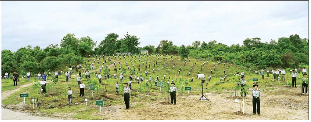
နိုင်ငံတော်သမ္မတ ဦးမင်းအောင်လှိုင် ၂၀၂၆ ခုနှစ် - မိုးရာသီ နိုင်ငံတော်အဆင့် ပထမအကြိမ် သစ်ပင်စိုက်ပျိုးပွဲအခမ်းအနားတွင် အမှာစကားပြောကြားစဉ်။

❖ ရှေးဖွဲ့မှု အခမ်းအနားသို့ နိုင်ငံတော် သမ္မတနှင့်အတူ ဒုတိယသမ္မတ များဖြစ်ကြသည့် ဦးညိုစောနှင့် ဒေါ်နန်းနီအေး၊ ပြည်သူ့ လွှတ်တော်ဥက္ကဋ္ဌ ဦးခင်ရီ၊ အမျိုးသားလွှတ်တော် ဥက္ကဋ္ဌ ဦးအောင်လင်းဒွေး၊ တပ်မတော် ကာကွယ်ရေးဦးစီးချုပ် ဗိုလ်ချုပ်ကြီး ရဲဝင်းဦး၊ ဒုတိယတပ်မတော် ကာကွယ်ရေးဦးစီးချုပ် ကာကွယ် ရေးဦးစီးချုပ်(ကြည်း) ဗိုလ်ချုပ်ကြီး ကျော်စွာလင်း၊ ပြည်ထောင်စု အဆင့်ပုဂ္ဂိုလ်များနှင့် ပြည်ထောင်စု ဝန်ကြီးများ၊ နေပြည်တော် ကောင်စီဥက္ကဋ္ဌ ကာကွယ်ရေးဦးစီး ချုပ်ရုံးမှ အဆင့်မြင့်တပ်မတော် အရာရှိကြီးများ၊ နေပြည်တော် တိုင်းစစ်ဌာနချုပ် တိုင်းမှူး၊ ဒုတိယ ဝန်ကြီးများနှင့် ဝန်ကြီးဌာနများမှ ဌာနဆိုင်ရာ အရာထမ်း၊ အမှုထမ်း များ၊ နေပြည်တော်ရှိ တက္ကသိုလ် ကောလိပ်များနှင့် အခြေခံပညာ ကျောင်းများမှ ပါမောက္ခချုပ်၊ ဒုတိယပါမောက္ခချုပ်၊ ကထိက ဆရာ၊ ဆရာမကြီးများ၊ ကျောင်းသား ကျောင်းသူများနှင့် တာဝန်ရှိသူများ တက်ရောက် ကြသည်။