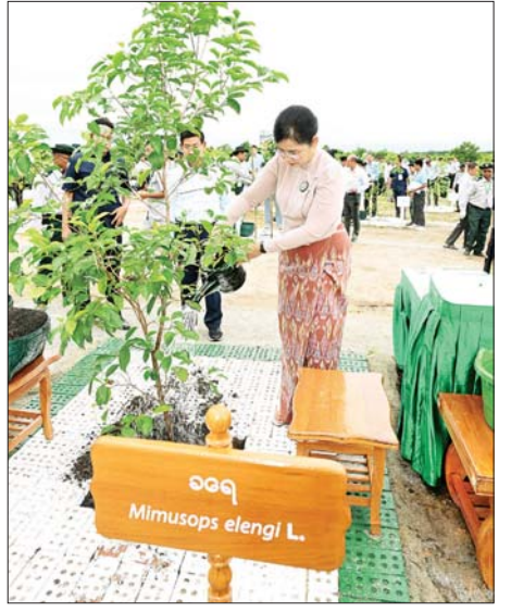
ဒုတိယသမ္မတ ဒေါ်နန်းနီနီအေး သတ်မှတ်နေရာတွင် ပျိုးပင်စိုက်ပျိုး ပေးစဉ်။

တိုးမြှင့်ဆောင်ရွက်သွားကြရန်၊ တစ်ပင်စိုက် တစ်ပင်ရှင်သန်စေဖို့ အတွက် ပြုစုထိန်းသိမ်းရေး လုပ်ငန်းများကိုလည်း စဉ်ဆက် မပြတ် ဆောင်ရွက်ပေးကြရန်၊ နိုင်ငံအဝန်း သစ်တောဖုံးလွှမ်းမှု များ တိုးပွားလာစေရေးအတွက် သစ်တောထိန်းသိမ်းရေးလုပ်ငန်း များကို အမျိုးသားရေးတာဝန် တစ်ရပ်အနေဖြင့် ပိုင်းဝန်းပူးပေါင်း ဆောင်ရွက်သွားကြရန် တိုက်တွန်း မှာကြားလိုကြောင်း ပြောကြား သည်။ ဒုတိယပေါမောက္ခချုပ်များ၊ ကထိက ဆရာ ဆရာမကြီးများကျောင်းသား ကျောင်းသူများနှင့် တာဝန်ရှိသူ များက ပျိုးပင်များကို တစ်ပြိုင် တည်း တပျော်တပါး စိုက်ပျိုး ကြသည်။ ကြည့်ရှုအားပေး ဆက်လက်၍ နိုင်ငံတော် သမ္မတနှင့်အဖွဲ့ဝင်များသည် ၂၀၂၆ ခုနှစ် - မိုးရာသီ နိုင်ငံတော်အဆင့် ပထမအကြိမ် သစ်ပင်စိုက်ပျိုးပွဲ လာကြသူများက ပျိုးပင်များအား တပျော်တပါး စိုက်ပျိုးနေမှုကို လှည့်လည်ကြည့်ရှုအားပေးခဲ့ကြ သည်။ ယနေ့ ကျင်းပပြုလုပ်သည့် ၂၀၂၆ ခုနှစ် - မိုးရာသီ နိုင်ငံတော် အဆင့် ပထမအကြိမ် သစ်ပင် စိုက်ပျိုးပွဲအခမ်းအနားတွင် ပန်းပွင့် သော သစ်မျိုးများဖြစ်ကြသည့် ကိုကော်၊ ခရေ၊ ပန်းမဲဇေလီ၊ စိန်ပန်း၊ ပျဉ်းမ၊ ရတနာတန်းဝင် သစ်မျိုး များဖြစ်သည့် ကွန်း၊ ပျဉ်းကတိုး၊ ပိတောက်၊ တမလန်း၊ မဟော်ဂန် နှင့် အမြစ်စိမ်းသစ်မျိုးများဖြစ် သည့် ရင်းမာ၊ ဆီသပြေ၊ မအူ၊ မလာလူးကား၊ ယမနေး၊ ရေတမာ စသည့် သစ်မျိုး ၁၆ မျိုး၊ အပင် ပေါင်း ၃၀၀၀ ကို စိုက်ပျိုးနိုင်ခဲ့ ကြောင်း သတင်းရရှိသည်။ သတင်းစဉ်