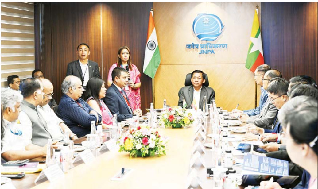
ပြည်ထောင်စုသမ္မတမြန်မာနိုင်ငံတော် နိုင်ငံတော်သမ္မတ ဦးမင်းအောင်လှိုင် ဂျဝါဟာလာနေရှူးဆိပ်ကမ်းစီမံကိန်းနှင့်ပတ်သက်၍ တာဝန်ရှိသူများက ရှင်းလင်းတင်ပြစဉ်။

ယင်းနောက် ဆိပ်ကမ်းအစည်းအဝေးခန်းမ၌ တာဝန်ရှိသူများက ဆိပ်ကမ်းအာဏာပိုင်အဖွဲ့အနေဖြင့် နိုင်ငံတော်သမ္မတ ဦးမင်းအောင်လှိုင် ဦးဆောင်သည့် မြန်မာအဆင့်မြင့်ကိုယ်စားလှယ်အဖွဲ့ကို ဆိပ်ကမ်းမှ လိုက်လံလိုလှုံ့ ကြိုဆိုနှုတ်ဆက်အပ်ကြောင်း နှုတ်ခွန်းဆက်စကားပြောကြားပြီး ဆိပ်ကမ်းဆိုင်ရာသမိုင်းကြောင်းနှင့် အချက်အလက်များ၊ အရှေ့တောင်အာရှနှင့် နိုင်ငံတကာနှင့် ဆက်သွယ်ဆောင်ရွက်လျက်ရှိသော အိန္ဒိယနိုင်ငံ၏ အဓိကအကျဆုံးဆိပ်ကမ်းတစ်ခုဖြစ်မှု အခြေအနေများ၊ ဆိပ်ကမ်းတွင်နည်းပညာမြှင့်တင်မှုကိရိယာများ အသုံးပြုလျက်ရှိမှု၊ မြန်မာနိုင်ငံနှင့် စီးပွားရေးမိတ်ဖက်အဖြစ် ပင်လယ်ရေကြောင်းကုန်သွယ်မှုများ၊ ဆိပ်ကမ်းဆိုင်ရာများကို ဆောင်ရွက်သွားနိုင်မှု၊ ဆိပ်ကမ်းကို အသုံးပြုနိုင်ခြင်းဖြင့် နိုင်ငံအတွက် စည်းကြပ်ခွန်များကို တိုးတက်ရှာဖွေပေးနိုင်ခဲ့မှု၊ ဆိပ်ကမ်း၏ စွမ်းဆောင်ရည်များ တိုးတက်စေရေး၊ အခြေခံအဆောက်အအုံပိုင်းဆိုင်ရာများ တိုးတက်ရေးနှင့် ဒစ်ဂျစ်တယ်စနစ်ဖြင့် ဆောင်ရွက်ရေးတို့ကို