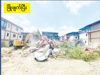
မဖြူဖျက်မီ