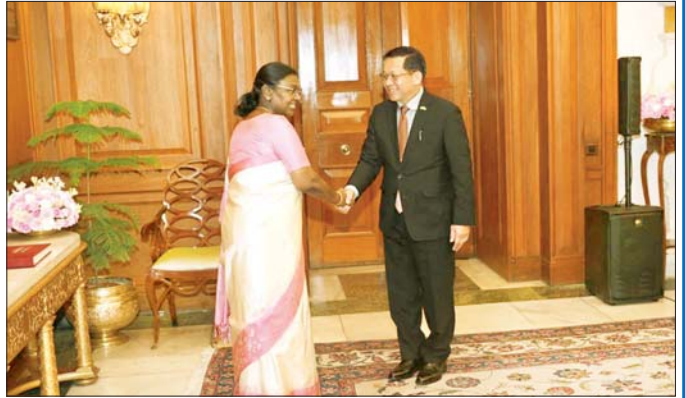
ပြည်ထောင်စုသမ္မတမြန်မာနိုင်ငံတော် နိုင်ငံတော်သမ္မတ ဦးမင်းအောင်လှိုင်အား အိန္ဒိယသမ္မတနိုင်ငံ သမ္မတ H.E. Smt. Droupadi Murmu က ဇွန် ၁ ရက်တွင် ရင်းရင်းနှီးနှီး နှုတ်ဆက်စဉ်။