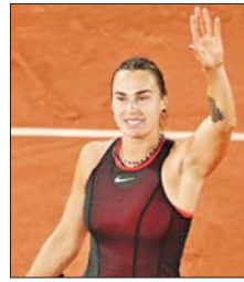
၆-၀ ရလဒ်ဖြင့် နိုင်ပွဲရရှိကာ ကွာတားပိုင်နယ်သို့ တက်လှမ်း လာသူဖြစ်သည်။ အောင်ဇော်

ဆာဘယ်လင်ကာ(ယာပွဲ) သည် ပြင်သစ်အိုးပင်းအမျိုးသမီးတစ်ဦး ချင်းပြိုင်ပွဲ ကွာတားပိုင်နယ်တွင် ရုရှားတင်းနစ်မယ် ဒိုင်ယာနာ ရုနိုက်ဒါနှင့် ယှဉ်ပြိုင်ရမည်ဖြစ် သည်။ ရုနိုက်ဒါသည် စတုတ္ထ အဆင့်တွင် အမေရိကန်တင်းနစ် မယ် မက်ဒီဆင်ကီးစ်ကို အကြိတ် အနယ်ယှဉ်ပြိုင်ပြီး ၆-၃၊ ၃-၆၊