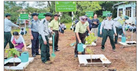
တက်ရောက်လာကြသည့်ပြည်နယ် လွှတ်တော် ကိုယ်စားလှယ်နှင့် ဌာနဆိုင်ရာ တာဝန်ရှိသူများ၊ ဖိတ်ကြားထားသော ဧည့်သည် တော်များ၊ ဆရာ ဆရာမများနှင့် ကျောင်းသား ကျောင်းသူများ ပြည်သူများကပူးပေါင်း၍ ချယ်ရီ၊ ပိတောက်၊ ပန်းတမာ၊ ရေသင်းဝင်း စိန်ပန်းပြာ၊ ပိန္နဲပင် စသည့်စုစုပေါင်း သစ်ပင် ၂၀၀ ကို အ.ထ.က (၂) ကျောင်းဝင်းအတွင်း စုပေါင်းကာ ပျော်ပျော်ပါးပါး စိုက်ပျိုးခဲ့ကြ ကြောင်း သိရသည်။ ခရိုင်(ပြန်/ဆက်)

ကျောက်မဲ ဇွန် ၂ ဇွန်လ (၅) ရက်နေ့တွင် ကျောက်မဲ မည့် “ကမ္ဘာ့ပတ်ဝန်းကျင် ထိန်းသိမ်းရေးနေ့” ကို ကြိုဆို ကျက်ပြုသောအားဖြင့် မိုးရာသီ သစ်ပင်စိုက်ပျိုးပွဲတော်ကို ယမန် နေ့ နံနက်ပိုင်းက ကျောက်မဲမြို့ အမှတ်(၂) အခြေစိုက်ပညာ အထက် တန်းကျောင်း၌ ကျင်းပရာ ကျောက်မဲခရိုင် ခရိုင်စီမံခန့်ခွဲရေး နှင့်အုပ်ချုပ်ရေးကော်မတီ ဥက္ကဋ္ဌ ဦးကျော်ဆွေဝင်းက အမှာစကား ပြောကြားပြီး အထ.က(၂) ကျောင်း အုပ်ကြီးထံသို့ အမှတ်တရသစ်ပင် များ လွှဲပြောင်းပေးအပ်ခဲ့သည်။ ယင်းနေ့က အခမ်းအနားသို့