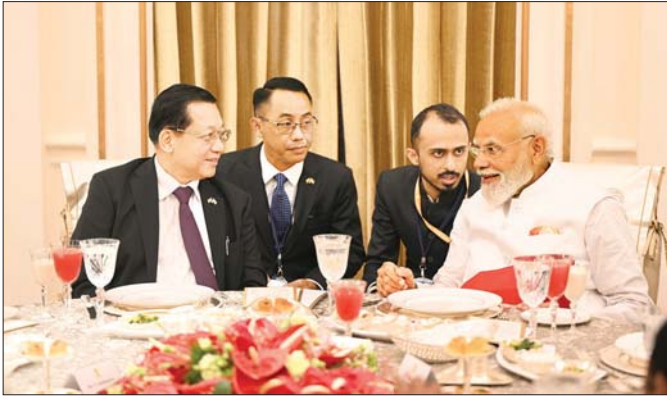
ပြည်ထောင်စုသမ္မတမြန်မာနိုင်ငံတော် နိုင်ငံတော်သမ္မတ ဦးမင်းအောင်လှိုင်အား အိန္ဒိယနိုင်ငံဝန်ကြီးချုပ် H.E. Shri Narendra Modi က ဇွန် ၁ ရက်တွင် ဂုဏ်ပြုနေ့လယ်စာဖြင့် တည်ခင်းစဉ်ခံစဉ်။