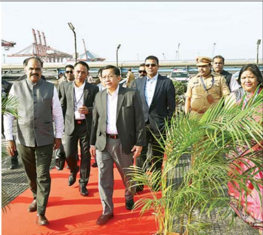
ပြည်ထောင်စုသမ္မတမြန်မာနိုင်ငံတော် နိုင်ငံတော်သမ္မတ ဦးမင်းအောင်လှိုင် မွမ်ဘိုင်းမြို့၊ ဂျဝါဟာလာနေရှူးဆိပ်ကမ်းအတွင်း ကြည့်ရှုလေ့လာစဉ်။