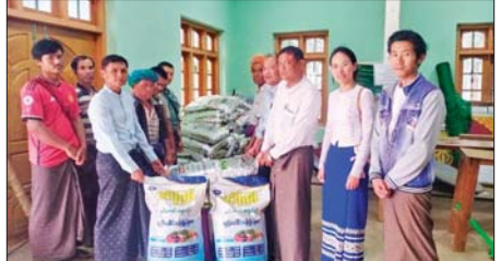
ကလေးမြို့နယ်၌ ကွန်ပေါင်းဓာတ်မြေဩဇာနှင့် သဘာဝမြေဩဇာများ ထောက်ပံ့ပေးအပ်