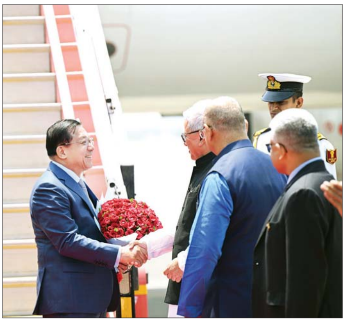
ပြည်ထောင်စုသမ္မတမြန်မာနိုင်ငံတော် နိုင်ငံတော်သမ္မတ ဦးမင်းအောင်လှိုင်အား မွမ်ဘိုင်းမြို့ Chhatrapati Shivaji Maharaj အပြည်ပြည်ဆိုင်ရာလေဆိပ်၌ မဟာရာရှ်ထရာပြည်နယ်အုပ်ချုပ်ရေးမှူး Shri. Jishnu Dev နှင့် ပြည်နယ်အစိုးရအဖွဲ့မှ တာဝန်ရှိသူများက ကြိုဆိုနှုတ်ဆက်ကြစဉ်။