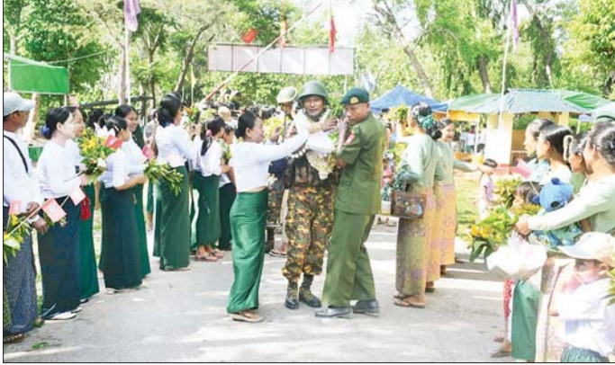
လှည်းကူးမြို့နယ် ရဲမြန်တပ်မြို့ရှိ နယ်မြေတပ်ရင်း၌ အောင်ပွဲရ ရှေ့တန်းပြန် နိုင်ငံ့သားကောင်း တပ်မတော်သားများအား သောင်းသောင်းဖြဖြ ဂုဏ်ပြုကြိုဆိုကြစဉ်။