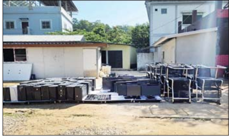
တာချီလိတ်မြို့အနီး ဝမ်းလုံးကျေးရွာ၌ အွန်လိုင်းငွေလိမ်လုပ်ငန်း လုပ်ကိုင်သည့် ဆက်စပ်ပစ္စည်းများအား တွေ့မြင်ရစဉ်။

အဆိုပါ အွန်လိုင်းလိမ်လည် လောင်းကစားမှုများ လုပ်ကိုင် လျက်ရှိသည့် ဖမ်းဆီးရမိသူများ အား လိုအပ်သည့် စစ်ဆေးမှုများ ဆောင်ရွက်ပြီးစီးပါက တည်ဆဲ