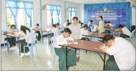
ဝင်ရောက်ယှဉ်ပြိုင်သူ ၁၆ ဦး၊ ဆေးရောင်ခြယ်ပြိုင်ပွဲတွင် ၃၂ ဦး ဝင်ရောက်ယှဉ်ပြိုင်ကြကြောင်း သိရသည်။

တောင်ငူ ဇွန် ၂ ပဲခူးတိုင်းဒေသကြီး တောင်ငူခရိုင် လူထုအခြေပြုဗဟိုဌာန၌ ၂၀၂၆ ခုနှစ် ကမ္ဘာ့ပတ်ဝန်းကျင်ထိန်းသိမ်းရေးနေ့အား ကြိုဆိုဂုဏ်ပြုသည့်အနေဖြင့် စာစီစာကုံးပြိုင်ပွဲနှင့် ဆေးရောင်ခြယ်ပြိုင်ပွဲ ကျင်းပရာ တောင်ငူခရိုင်အတွင်းရှိ အခြေခံပညာကျောင်းများမှ ကျောင်းသား ကျောင်းသူများ ဝင်ရောက်ယှဉ်ပြိုင်ကြပြီး ၂၀၂၆ ခုနှစ် ကမ္ဘာ့ပတ်ဝန်းကျင်ထိန်းသိမ်းရေးနေ့ အထိမ်းအမှတ်ဆောင်ပွဲခွဲ “ရာသီဥတုပြောင်းလဲမှုတိုက်ဖျက်ဖို့ ပိုင်းဝန်းကြိုးပမ်းဆောင်ရွက်စို့” ခေါင်းစဉ်ဖြင့် စာစီစာကုံးပြိုင်ပွဲ