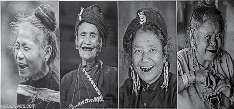
သွားမည်းဆိုးထားသော အဲဒီအမျိုးသမီးများ

တစ်ဖက်သားနှစ်နာစေခြင်းဆိုသည်မှာ လူဖြစ်စေ၊ တိရစ္ဆာန်ဖြစ်စေ၊ သူတစ်ပါး၏ ပိုင်ဆိုင်မှု ဖြစ်သော ပစ္စည်းအရာဝတ္ထုများ၊ လယ်ယာစိုက်ခင်းများအား မတရားဖျက်ဆီးပါက ရွာသူကြီးများကသာ အရေးယူဆောင်ရွက်ခြင်း ပြုလုပ်ရသည်။ ထိုက်သင့်သော တန်ရာတန်ကြေးအတိုင်း ငွေဖြစ်စေ၊ အစားထိုးပစ္စည်းဖြစ်စေ ပေးလျော်စေသည်။ စိုက်ခင်းများကို တိရစ္ဆာန်များက ဝင်ရောက်ဖျက်ဆီးပါက ယာခင်းပျက်စီးဆုံးရှုံးမှုအတိုင်း ပေးလျော်စေသည်။ ဥပမာ ကျွဲ၊ နွားများက လယ်ထဲ စပါးသွားစားမိပါက လယ်ပိုင်ရှင်က ကျွဲ၊ နွားပိုင်ရှင်အား စပါးပြန်လည် ပေးလျော်စေပါသည်။ ဤအတွက် စီရင်ခြင်းသည် လယ်ပိုင်ရှင်နှင့် ကျွဲ၊ နွားပိုင်ရှင်တို့၏ နှစ်ဦးနှစ်ဖက် သဘောတူညီမှု ရရှိလာသည်အထိ အချင်းချင်း ညှိနှိုင်းစေပါသည်။ နှစ်ဦးနှစ်ဖက်စလုံးက သဘောတူညီမှုရရှိလာမှသာ တရားစီရင်ခြင်း အဆုံးသတ်၍ အပြစ်ကင်းလွတ်ပါသည်။