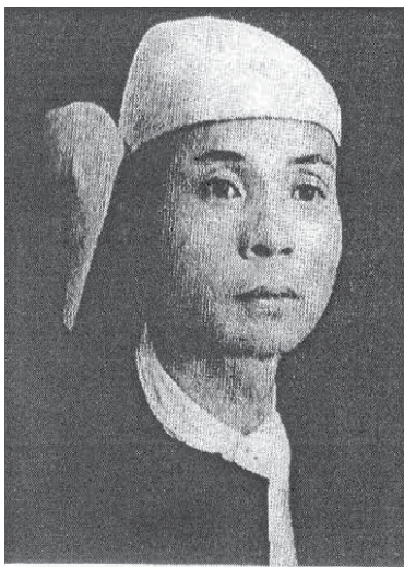
ဝဏ္ဏကျော်ထင် ဦးလွီးဇီ မြို့ပိုင်

ကယားပြည်နယ်အနောက်ပိုင်း ပြည်သူ့လွှတ်တော်အမတ်နှင့် ပါလီမန်အတွင်းဝန် တာဝန်များကို ၁၉၆၀ ပြည့်နှစ်အထိ တာဝန်ထမ်းဆောင်ခဲ့သည်။ သက်ရှိထင်ရှားရှိစဉ်က (ကယား ဦးစိန်)ဟူ၍ နိုင်ငံရေးလောကတွင် လူသိများသောပုဂ္ဂိုလ်ဖြစ်သည်။