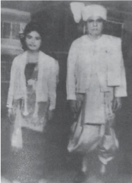
ရှေးယခင်ခေတ် မရမာကြီး တိုင်းရင်းသား အမျိုးသားနှင့် အမျိုးသမီးတို့၏ ဝတ်စားဆင်ယင်မှုပုံစံ