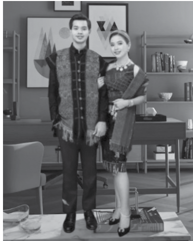
ခေတ်သစ် စက်ရက်ကန်းထည် ဝတ်စားဆင်ယင်ပုံ