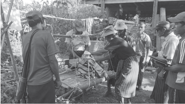
ဖိုးဒီးခရီးနတ်ရုပ်ပို့ဆောင်ရန် ပြင်ဆင်နေစဉ်

ကြက်ရိုးထိုး၍ လိပ်ပြာစုံ မစုံ၊ မိသားစုဝင်များ ကျန်းမာရေးကောင်း မကောင်း မေးမြန်းကြသည်။ ထို့နောက် ဒီးကူပြုတ်ရည်ဖြင့် ထိရှိမြ ခေါ် လယ်စောင့်နတ်၊ ယာစောင့်နတ်ကို ပူဇော်ပြီး အိုးစည်ဗုံမောင်းများတီးခတ်၍ ဖိုးဒီးခရီးနတ်ရုပ်ကို ရွာအပြင်သို့ ပို့ဆောင်ကြသည်။ ဖိုးဒီးခရီးနတ်ရုပ်သည် ရွာအတွင်းရှိ မကောင်းသောအရာများ၊ ရောဂါဆိုးများကို ယူဆောင်သွားသည်ဟု ယုံကြည်ကြသည်။