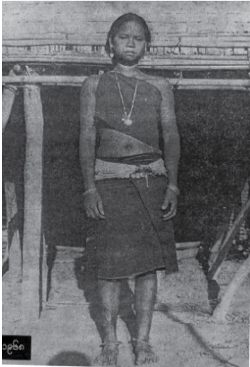
မြို့အမျိုးသမီးများရိုးရာဝတ်စားဆင်ယင်မှု (မြန်မာ့ဆိုရှယ်လစ်လမ်းစဉ်ပါတီခေတ်)

“ရှေးခေတ် မြို့လူမျိုးများ၏ ဝတ်စားဆင်မှုများတွင် ငွေထည်ပစ္စည်းများကို အဓိကထား အသုံးပြုကြသည်။ မြို့အမျိုးသမီးတို့၏ ဝတ်စားဆင်ယင်မှုတွင် ငွေဒင်္ဂါးပြားများသည် မပါမဖြစ် အရေးပါသော အစိတ်အပိုင်းတစ်ခုဖြစ်သည်။”