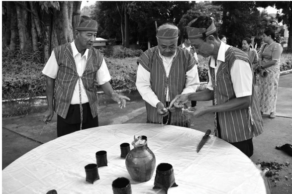
ကြက်ရိုးထိုး၍ အဲဒိုပေါ်မိ ခေါ် ဒီးကူပွဲ ကျင်းပနိုင်မည့် ရက်ကောင်းရက်မြတ် ရွေးချယ်စဉ်

ကယားတိုင်းရင်းသားတို့တွင် ကိုးကွယ်ယုံကြည်မှု အမျိုးမျိုးရှိကြသည့်အနက် ကြက်ရိုးထိုးသည့်လေ့ကိုလည်း အထူးယုံကြည်ကြသည်။ ကြက်ရိုးထိုးရာတွင် ဒီးကူပွဲ ပြုလုပ်ရန် ရက်ကောင်းရက်မြတ်ရွေးချယ်ရာ၌ ကြက်မကို အသုံးပြုလေ့ရှိပြီး လိပ်ပြာခေါ် ရာတွင် ကြက်ဖကို အသုံးပြုလေ့ရှိပါသည်။ တောင်ယာစိုက်ပျိုးခြင်း၊ အိမ်ဆောက်ရန် မြေ နေရာနှင့် အိမ်ဆောက်မည့် နေ့ကောင်းရက်မြတ်ရွေးခြင်း၊ အိမ်သစ်တက်ခြင်း၊ ထိမ်းမြားခြင်း၊ နာမကျန်းဖြစ်ခြင်း စသည့် သာရေး၊ နာရေးကိစ္စ အမျိုးမျိုးတို့ကို မပြုလုပ်မီ ကေ့ဗျာစယ် ခေါ် နတ်ဆရာသို့မဟုတ် ရပ်ရွာထဲမှ ကြက်ရိုးထိုးတတ်သူ လူကြီးတစ်ဦးက ဆောင်ရွက်ပေးရသည်။ အဲဒိုပေါ်မိပွဲ ခေါ် ဒီးကူပွဲတော် ကျင်းပမည့်ရက်ကိုလည်း ကေ့ဗျာစယ် ခေါ် နတ်ဆရာကြီးက ကြက်ရိုးထိုး၍ အတိအကျ သတ်မှတ်ပေးရပါသည်။