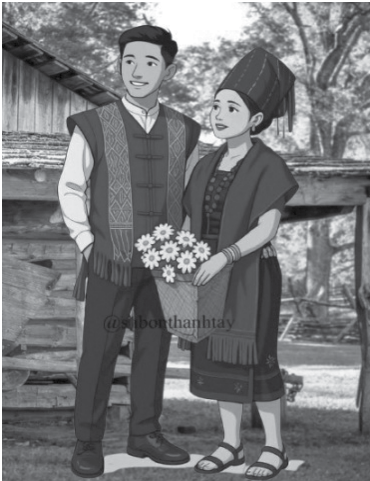
ခေတ်သစ် ရိုးရာဂျပုံအထည် ထောင်ပက် ဝတ်စားဆင်ယင်ပုံ

မြို့အမျိုးသားများအတွက် ရိုးရာဂျပုံအထည် ထောင်ပက် ခေါ် တဘက်ရှည် မဟုတ်ဘဲ အသင့်ဝယ်ယူရရှိနိုင်သော အဝတ်စုံများဖြင့် ချုပ်ထားသော အမျိုးသားဝတ်အင်္ကျီဖြစ်သည်။ ၎င်းကိုချုပ်လုပ်ပုံမှာ ကိုယ်ခန္ဓာ၏ ရှေ့တည့်တည့်တွင်လည်းကောင်း၊ ကော်လံတွင်လည်းကောင်း၊ လက်နှစ်ဖက်စလုံးတွင်လည်းကောင်း ရိုးရာမူမပျက် လှပဆန်းသစ်သော ဒီဇိုင်းများဖြင့် ချုပ်လုပ်ဝတ်ဆင်ကြသည်။ မြို့အမျိုးသားများသည် ရိုးရာဂျပုံအထည် ထောင်ပက် ခေါ် တဘက်ရှည်ဖြင့် ချုပ်လုပ်ထားသော အမျိုးသားဝတ်အင်္ကျီကို နိုင်ငံတော်အခမ်းအနား၊ မင်္ဂလာရှိသော အခမ်းအနားဖြစ်သည့် မြို့အမျိုးသားနေ့၊ အိမ်သစ်တက်ပွဲ၊ နှစ်သစ်ကူးပွဲ၊ ဆန်ပွဲတော်၊ တန်းများပွဲတော်များတွင် ဝတ်ဆင်ကြသည်။ မြို့အမျိုးသားတို့သည် စက်ဖြင့် ရက်လုပ်ထားသော အင်္ကျီများကို နိုင်ငံတော်အခမ်းအနားများတွင် ဝတ်ဆင်ခြင်းမရှိသော်လည်း မင်္ဂလာရှိသော အခမ်းအနားတို့တွင် ဝတ်ဆင်ကြသည်။