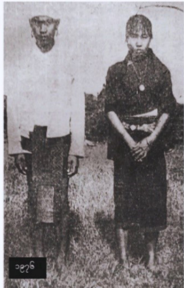
မြို့အမျိုးသားနှင့် အမျိုးသမီး တိုင်းရင်းသားယဉ်ကျေးမှုနှင့် ရိုးရာဓလေ့များ(ရခိုင်)