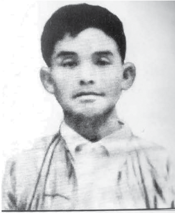
ဦးနု (O.B.E) ကရင်နီ (ကယား) ပြည်နယ်အစိုးရပိုင်

သင်ကြားခဲ့သည်။ ၁၉၃၆ ခုနှစ်နှင့် ၁၉၄၂ ခုနှစ်၊ မိုးပြဲနယ်ပဒေသရာဇ်စော်ဘွားဆန့်ကျင်တော်လှန်ရာတွင် ခေါင်းဆောင်တစ်ဦးအဖြစ် တာဝန်ယူခဲ့သည်။ ၁၉၄၅ ခုနှစ်၊ ဖက်ဆစ်ဂျပန်တော်လှန်ရေးတွင် ဗိုလ်ချုပ်အောင်ဆန်းနှင့်ကြိုတင်ညှိနှိုင်း၍ မဟာမိတ်တပ် (၁၃၆) နှင့် ဆက်သွယ်ပြီး မိုးပြဲနယ်နှင့် ကရင်နီနယ်တော်လှန်ရေးတွင် ပြောင်မြောက်စွာ ဦးဆောင်နိုင်ခဲ့သောကြောင့် မဟာမိတ်တပ်က (O.B.E) ဘွဲ့ ချီးမြှင့်ခြင်းခံရသည်။ ဗိုလ်ချုပ်အောင်ဆန်းကလည်း ဂုဏ်ပြုချီးကျူးစာပေးပို့ခဲ့သည်။ ၁၉၄၇ ခုနှစ်၊ တိုင်းပြုပြည်ပြုလွှတ်တော်သို့ မိုးပြဲနယ်ကိုယ်စားလှယ်အဖြစ် တက်ရောက်ခဲ့သည်။ ၁၉၄၇ ခုနှစ်၊ ဖွဲ့စည်းအုပ်ချုပ်ပုံအခြေခံဥပဒေရေးဆွဲရာတွင် ကော်မတီဝင်တစ်ဦးအဖြစ် ပါဝင်ခဲ့သည်။ ကရင်နီနိုင်ငံရေးတွင် ထဲထဲဝင်ဝင် ပါဝင်လှုပ်ရှားခဲ့သောကြောင့် ၁၉၄၈ ခုနှစ်၊ လွတ်လပ်ရေးရရှိသည့်အခါ ကရင်နီပြည်နယ်အစိုးရအဖွဲ့ဝင် အုပ်ချုပ်ရေးနှင့် အရေးပိုင်အဖြစ် တာဝန်ထမ်းဆောင်ခဲ့သည်။ ကရင်နီပြည်နယ် ပြည်တွင်းစစ်ကာလတွင် နိုင်ငံရေးနှင့် စစ်ရေးတာဝန်များကို ပင်ပန်းစွာ ထမ်းဆောင်ခဲ့သောကြောင့် ၁၉၄၈ ခုနှစ်၊ နိုဝင်ဘာလ ၂ ရက်နေ့ ရန်ကုန်ပြည်သူ့ဆေးရုံကြီးတွင် ကွယ်လွန်သွားခဲ့သည်။ ဦးသိုင်းဘဟန်၏ ဈာပနာအခမ်းအနားကို ဖ. ဆ. ပ. လ အဖွဲ့ချုပ်က ခမ်းနားစွာကျင်းပခဲ့ပြီး ကြံတောသုသာန်တွင် သင်္ဂြိုဟ်ခဲ့သည်။