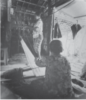
စောင်-ရက်ကန်းရှယ်နေပုံ

မြို့ရိုးရာ ဂျပ်ခုတ်ရက်ကန်းစင် ပြင်ဆင်ပြီးလျှင် ၎င်းကိရိယာများဖြင့် မိမိတို့လိုအပ်သည့် လှပဆန်းသစ်သော ရိုးရာပန်းကွက်များ၊ ခေတ်မီသော ဒီဇိုင်းများကို ပန်းကွက်ပေါ်မူတည်ပြီး ချည်အရေအတွက်ကောက်ယူကာ အကွက်ဖော်ပြီး ရက်လုပ်ကြပါသည်။