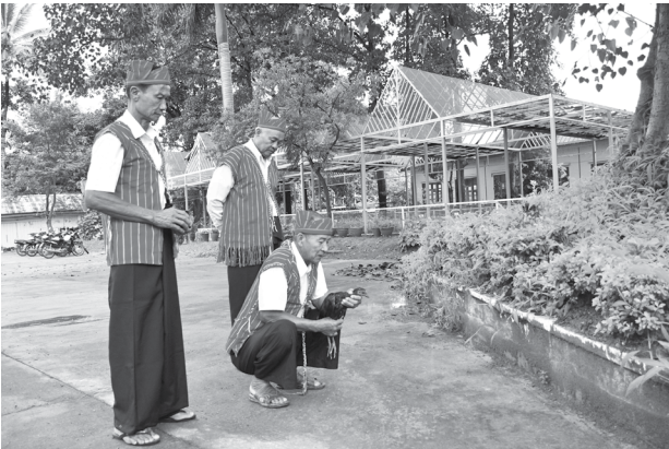
အဲဒိုပေါ်မီ ခေါ် ဒီးကူပွဲကျင်းပနိုင်မည့် ရက်ကောင်းရက်မြတ်ရွေးရန် ကြက်ရိုးထိုးမည့်ကြက်ဖြင့် တိုင်တည်စဉ်

အဲဒိုပေါ်မီ ခေါ် ဒီးကူပွဲတော်မှာ ကောက်ညှင်းထုပ်ပွဲဖြစ်ပါသည်။ ပွဲတော်ကို နှစ်စဉ် တော်သလင်းလနှင့် သီတင်းကျွတ်လများတွင် ကျင်းပလေ့ရှိပြီး ဘေးအန္တရာယ်ကင်းရှင်းရန်၊ ရောဂါဟူသမျှ ရွာပြင်သို့ မောင်းထုတ်ရန်၊ စိုက်ပျိုးထားသည့် ကောက်ပဲသီးနှံများ သဘာဝ ဘေးအန္တရာယ်မှ ကင်းဝေး၍ အောင်မြင်ဖြစ်ထွန်းစေရန်၊ မြို့ရွာများ စည်ပင်သာယာဝပြောပြီး အေးချမ်းသာယာလာစေရန်နှင့် ကွယ်လွန်ပြီးသည့် ဘိုးဘွား၊ မိဘ၊ ဆွေမျိုးသားချင်းများ၏ ဝိညာဉ်ကိုခေါ်ယူ၍ ရိုးရာဓလေ့နှင့်အညီ ပူဇော်ပသရန် ရည်ရွယ်၍ ကျင်းပခြင်းဖြစ်ပါသည်။