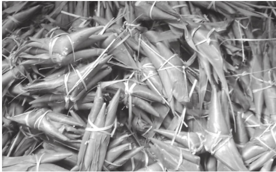
ပြုတ်ထားပြီးသည့် ဒီးကူ ခေါ် ကောက်ညှင်းထုပ်များ

စောစော တောထဲသို့သွား၍ ကောက်ညှင်းထုပ်ဖက်ဖြစ်သည့် ဒီးကူရွက်များခူးရပါသည်။ အမျိုးသမီးများက ဒီးကူရွက်ကောင်း၊ ရွက်သန်များ ရွေးချယ်ပြီး ကောက်ညှင်းထုပ်ရပါသည်။ ကယားတိုင်းရင်းသား ညီအစ်ကိုမောင်နှမများ စည်းလုံးညီညွတ်ကြစေရန်၊ စုပေါင်းလုပ်ကိုင်ဆောင်ရွက်ကြစေရန်၊ စိတ်တူကိုယ်တူ တပေါင်းတစည်းတည်း ဖြစ်စေရန် ရည်ရွယ်၍ ကောက်ညှင်းထုပ်ကိုသုံးမြောင့်ပုံသဏ္ဍာန်ထုပ်၍သုံးထုပ်လျှင်တစ်စည်းနှီးဖြင့်တွဲချည်ထားပြီး အိုးကြီးဖြင့် ပြုတ်ထားပါသည်။