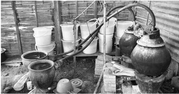
ကယားရိုးရာ ခေါင်ရည်ချက်နေစဉ်

ဖိုးဒီးခရီးနတ်အား ပြန်လည်ပို့ဆောင်သည့်နေ့သည် အစည်ကားဆုံးဖြစ်ပြီး မိမိတို့ရွာသို့ လာသမျှ ညှော်သည်များ၊ ဆွေမျိုးများကို ထမင်းဟင်းလျာ၊ ခေါင်ရည်နှင့် ကောက်ညှင်းထုပ်များဖြင့် ကျွေးမွေးညှော်ခံ၍ အခြားရွာများရှိ ဆွေမျိုးမိတ်သင်္ကဟများထံသို့လည်း ကောက်ညှင်းထုပ်၊ ထမင်းထုပ်နှင့် ခေါင်ရည်များပေးပို့ကြသည်။ ရွာသို့လာသည့် ညှော်သည်များကိုလည်း အိမ်အပြန် ကောက်ညှင်းထုပ်များ၊ ခေါင်ရည်များ၊ ဟင်းလျာများ လက်ဆောင်ထည့်ပေးလေ့ရှိသည်။