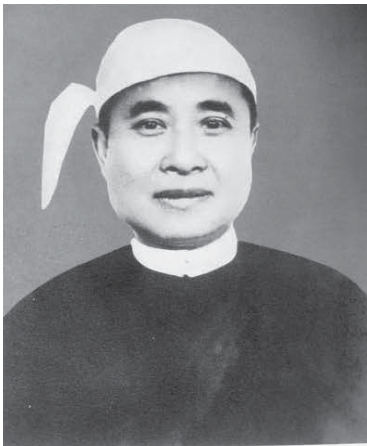
သီရိပျံချီ - ဦးအေမြလေး ဧကီဝန်

ဒုတိယကမ္ဘာစစ်အတွင်း နိုင်ငံရေးလောကသို့ ဝင်ရောက်လာသည်။ ဖက်ဆစ်ဂျပန်တော်လှန်ရေးကာလ၌ အထူးထင်ရှားသည့် ကရင်နီ (ကယား) နိုင်ငံရေးသမားတစ်ဦးဖြစ်သည်။ ၁၉၄၇ ခုနှစ်၊ တိုင်းပြုပြည်ပြုလွှတ်တော်သို့ ကရင်နီပြည်နယ်ကိုယ်စားလှယ်အဖြစ် တက်ရောက်ခဲ့သည်။ ၁၉၄၈ ခုနှစ်၊ မြန်မာနိုင်ငံ လွတ်လပ်ရေးရသည့်အခါ ကရင်နီပြည်နယ်အစိုးရအဖွဲ့တွင် လူထုစည်းရုံးရေးတာဝန်နှင့် ခရိုင်ဝန်အဖြစ် တာဝန်ယူခဲ့သည်။ လွတ်လပ်ရေးရခါစ ကရင်နီပြည်နယ်ပြည်တွင်းစစ်ကာလတွင် အုပ်ချုပ်ရေးနှင့် စစ်ရေးတာဝန် ထမ်းဆောင်ခဲ့သည်။ ၁၉၄၉ ခုနှစ်၊ ဇန်နဝါရီလ ၄ ရက်နေ့တွင် နိုင်ငံတော်သမ္မတက “သီရိပျံချီ” ဘွဲ့ ချီးမြှင့်ခြင်းခံခဲ့ရသည်။