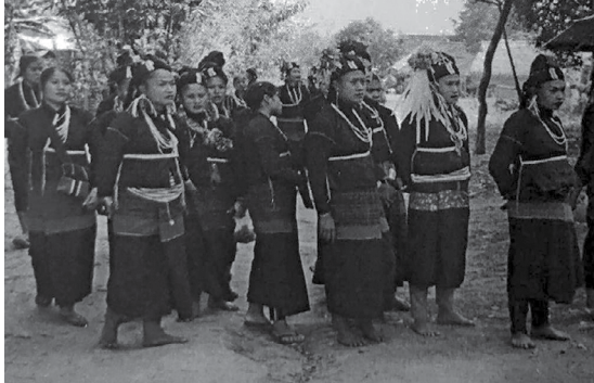
အဲန် အမျိုးသမီးများ ဝတ်စားဆင်ယင်ပုံ

လွယ်ကြသည်။ အမျိုးသမီးမှာ အနက်ရောင် ခေါင်းပေါင်းနှင့် အင်္ကျီအနက်ရောင် ဝတ်ဆင် ထားပြီး ထဘီလည်း အနက်ရောင်နှင့် ရောင်စုံချည်မျှင် အတန်းလိုက်ပါပြီး ပိတ်ပြားအနီရောင် ချုပ်စပ် ဝတ်ဆင်ထားကြသည်။ လူကြီးနှင့် ကလေးများ ဝတ်ဆင်ပုံ တူညီကြပါသည်။ ပွဲတော်နေ့ အချိန်ကာလများဆိုလျှင် အမျိုးသား၊ အမျိုးသမီးများ ကိုယ်စီ ကိုယ်စီ ဝတ်စုံပြည့်ဖြင့် ပွဲတော် များကို အတူတကွ ဆင်နွဲ့ကြပါသည်။