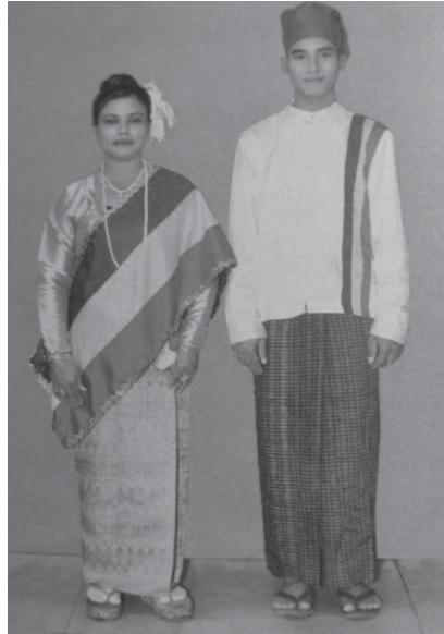
လက်ရှိ ရိုးရာဝတ်စုံ