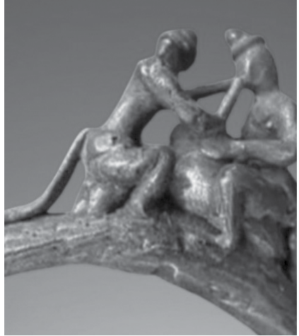
ရှေးခေတ်မြေအောက်မှ တွေ့ရှိရသော မြို့တိုင်းရင်းသားများ၏ ရိုးရာခေါင်ရည် သောက်နေပုံ