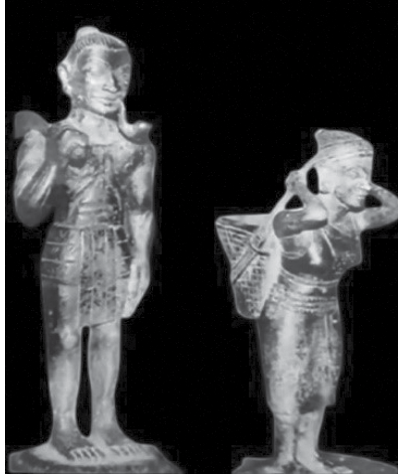
ရှေးခေတ်မြေအောက်မှ တွေ့ရှိရသော မြို့တိုင်းရင်းသားများ၏ ရိုးရာဝတ်စားဆင်ယင်ပုံ

မြို့တိုင်းရင်းသားများသည် ယဉ်ကျေးမှုဖွံ့ဖြိုးတိုးတက်လာသည်နှင့်အညီ ရိုးရာဝတ်စားဆင်ယင်မှုသည်လည်း ခေတ်ပေါ်ဝတ်စားဆင်ယင်မှုတို့ကို ပြောင်းလဲဝတ်စားဆင်ယင်လာကြသည်။ မြို့တိုင်းရင်းသားတို့၏ ဝတ်စားဆင်ယင်မှုများသည် ဗြိတိသျှခေတ်တွင် ဓာတ်ပုံ