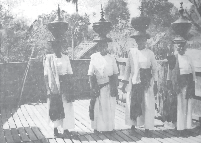
ပဇင်းချောင်ကျေးရွာမှ တောင်သားအမျိုးသမီးကြီးများ

မင်းဘေးမင်းဒဏ်ကို စိတ်မချရသဖြင့် ပျူလူမျိုးတည်းဟူ၍ မည်သူ တစ်စုံတစ်ယောက်မှ မသိနိုင်ကြစေရန် ပြေးလွှားပုန်းရှောင်၍ အခြေချနေထိုင်သောနေရာဟု ယူဆကြောင်း မိမိဆရာတို့က ဆိုပါသည်။ တောင်သားလူမျိုးတို့၏ ရိုးရာဝတ်စုံ ဝတ်ဆင်မှုကို မှတ်တမ်း ဓာတ်ပုံများ ရိုက်ယူခဲ့သည်။