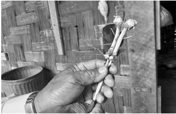
နေအိမ်တွင် ကွယ်လွန်ပြီးသော ဘိုးဘွားမိဘဆွေမျိုးများအား တိုင်တည်၍ ကြက်ရိုးထိုးစဉ်