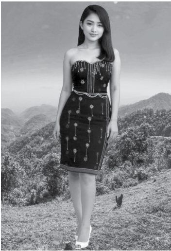
ခေတ်သစ် မြို့အမျိုးသမီးတစ်ဦး ဝတ်စားဆင်ယင်ပုံ

မြို့အမျိုးသမီးတို့၏ လက်နှစ်ဖက်တွင် လက်ကောက်(ခေဆိ) တစ်ကွင်းမှအကွင်း ၂၀ ထိ ဝတ်ဆင်ကြပြီး ခြေထောက် တစ်ဖက်တစ်ချက်တွင်လည်း ခြေချင်း(ခေခင်)လက်သန်းခန့် လုံးပတ်ရှိသော ငွေခြေချင်းကို တစ်ဖက်တစ်ကွင်းစီဝတ်ဆင်ကြသည်။ မြို့အမျိုးသမီးများ ထိပ်ပတ်(တဘက်) အလျား ရှစ်ပေ၊ အနံတစ်ပေခွဲခန့်ရှိ ဂျပန်ရက်ထည်ကိုလည်း ပခုံးနှစ်ဖက်ရှိ လည်ကုပ်မှ သိုင်းပြီး အစွန်းနှစ်ခုကို ရှေ့သို့ချ၍ခြုံသိုင်းကာ ဝတ်ဆင်ကြရသည်။ ဤဝတ်စားဆင်ယင်မှုကို ဆန်(အထူးသီးသန့်)ပွဲတော်၊ အိမ်သစ်တက်မင်္ဂလာပွဲတော်၊ နိုင်ငံတော်မှ ကျင်းပသော အခမ်းအနား များတွင် ဝတ်ဆင်ခဲ့ကြသည်။ ဤထိပ်ပတ် (တဘက်) ရိုးရာဂျပန်ရက်ထည်များကို ပန်းခက်၊ ပန်းနွယ်၊ ကနုတ်နှင့် ဒီဇိုင်းများမှာ အနုပညာလက်ရာ၏အစွမ်းဖြစ်ပေသည်။