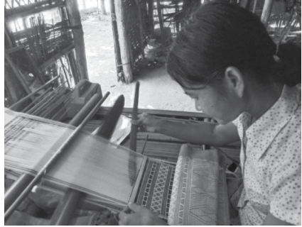
ရိုးရာပန်းကွက်များ ပုံဖော်ရက်လုပ်ပုံ