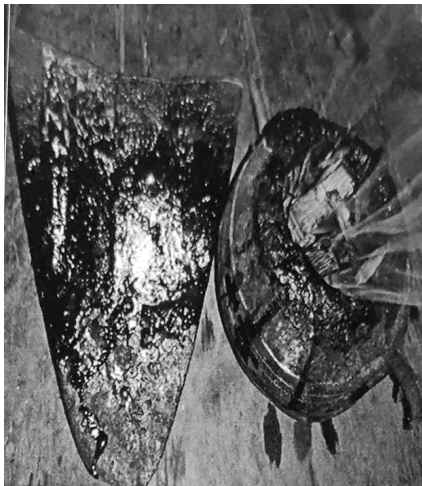
မှိုင်းဆီပြုလုပ်ရာတွင် ပါဝင်ပစ္စည်းများ