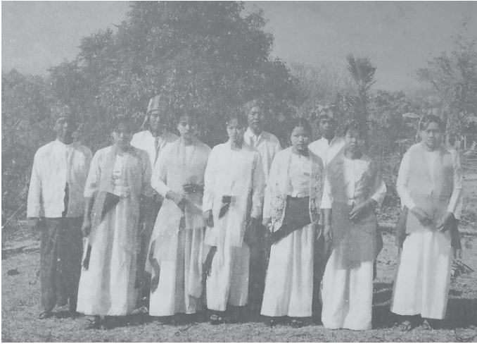
ဝက်သက်ရွာမ၌ တွေ့ဆုံခဲ့ရသည့် တောင်သားရိုးရာဝတ်စုံနှင့် အမျိုးသား၊ အမျိုးသမီးများ

အမျိုးသားပြတိုက် (ရန်ကုန်) တွင် တိုင်းရင်းသားလူမျိုးတို့၏ ယဉ်ကျေးမှုပြခန်းဟူ၍ ခင်းကျင်းပြသထားသည်။ တိုင်းရင်းသားတို့၏ သမိုင်းကြောင်း၊ ကိုးကွယ်သည့်ဘာသာ၊ အသက်မွေးဝမ်းကျောင်းလုပ်ငန်း၊ ရိုးရာဓလေ့၊ စာပေ စသည်ဖြင့်ရှိပြီး ရုပ်လုံးရုပ်ကြွများဖြင့် အဆင့်အတန်းမြင့်မြင့် ခင်းကျင်းပြသထားပါသည်။ နှစ်စဉ် ပြည်ထောင်စုနေ့ အခမ်းအနားသို့ တက်ရောက်လာကြသည့် တိုင်းရင်းသားလူမျိုးကိုယ်စားလှယ်များ၊ ယဉ်ကျေးမှုအဖွဲ့များ လာရောက်လေ့လာကြပြီး ခေတ်နှင့်လျော်ညီစွာ လိုအပ်သည်များကို အကြံပြုတင်ပြကြသည်။ ရိုးရာဝတ်စုံများ လှူဒါန်းကြသည်။ တာဝန်ရှိသူများကလည်း ခေတ်ကာလအခြေအနေနှင့် ကိုက်ညီအောင် ပြင်ဆင်ဆောင်ရွက်ပေးခဲ့ပါသည်။