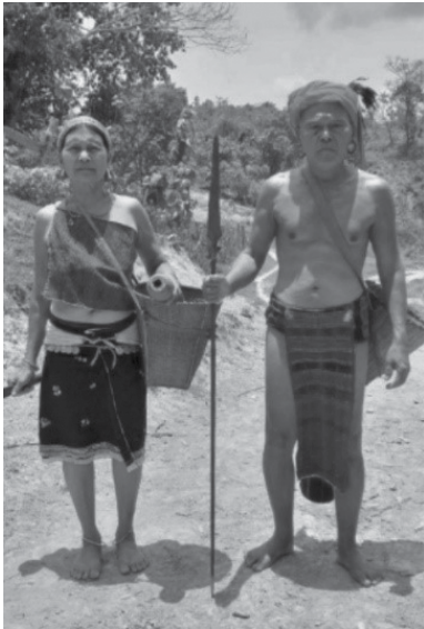
မြို့အမျိုးသားနှင့် အမျိုးသမီး ညောင်တီခေတ်ဝတ်စားဆင်ယင်ပုံ

ရှေးခေတ်မြို့လူကြီးများသည် သျှောင်ထုံးကိုဘယ်ဘက်တစောင်းထားလျက် ‘လူပေါင်’ (Lupon) ဟု ခေါ်သော ခေါင်းပေါင်းပိတ်စ သို့မဟုတ် ပန်းရောင်ခေါင်းပေါင်းကို ပေါင်းကြ သည်။ ၎င်းကို မြို့တိုင်းရင်းသားများက ခေါင်းပေါင်းထည်ကို ‘လူပေါင်’ (Lupon) ဟု ခေါ်သည်။ ‘ဆံထိုး’ကို ‘ဆင်ဘိန်း’ဟု ခေါ်ကြပြီး ‘ပန်းဖွား’ကို ‘အဆို’ဟု ခေါ်ကြသည်။ မြို့တိုင်းရင်းသား များတွင် နားနှစ်ဖက် အချင်းနှစ်လက်မခန့်ရှိ အပိုင်းကွင်းကြီးနှစ်ကွင်းကို ဝတ်ဆင်ကြသည်။ ထိုနားကွင်းကြီးကို ဆင်းရဲ၊ ချမ်းသာမှုအပေါ် မူတည်၍ ဆင်းရဲသူတို့က ငွေသားဖြင့် ပြုလုပ် ထားသော နားကွင်းကိုဝတ်ဆင်ကာ ချမ်းသာသူတို့သည် ရွှေဖြင့်ပြုလုပ်ထားသော နားကွင်း ကြီးများကို ဝတ်ဆင်ကြသည်။ မြို့တိုင်းရင်းသားများ၏ မင်းခမ်းမင်းနားတွင်ကား ‘တကွစိ’၊ ‘ရည်စလေ’ခေါ်သော ရတနာကိုးပါးဖြင့် စီခြယ်ထားသော နားကွင်းကြီးကိုဝတ်ဆင်၍