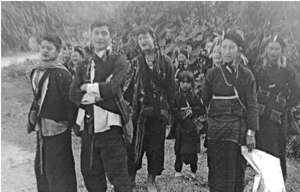
အဲန် အပျို၊ လူပျိုများ ဝတ်စားဆင်ယင်ပုံ

အဲဒီတိုင်းရင်းသားများသည် မြန်မာနိုင်ငံ ရှမ်းပြည်နယ် အရှေ့ပိုင်းတွင် နေထိုင်လျက် ရှိကြပြီး မြို့နယ်အားဖြင့် ကျိုင်းတုံမြို့နယ်၊ မိုင်းခတ်မြို့နယ်၊ မိုင်းဖြတ်မြို့နယ်၊ မိုင်းဆတ်မြို့နယ် စသည့် မြို့နယ် ၄ မြို့နယ်တွင် ကျေးရွာစုစုပေါင်း ၃၄ ရွာ ၊ အိမ်ခြေပေါင်း ၁၂၅၃၊ လူဦးရေ စုစုပေါင်း ၈၄၉၆ ရှိပါသည်။ ကျေးရွာအမည်များမှာ ကျိုင်းတုံမြို့နယ်အတွင်းရှိ နမ့်လင်းမိုင် ကျေးရွာ၊ ပန်ကျော့ကျေးရွာ၊ နမ့်လင်းကောင်ကျေးရွာ၊ ပန်လေကျေးရွာ၊ ဝမ်နောင်ကျေးရွာ၊ တင်ထပ်ကျေးရွာ၊ နမ်ခမ်ကျေးရွာ၊ နမ်လေကျေးရွာ၊ ဟိုလန်ကျေးရွာ၊ မိုင်းပတ်ကျေးရွာတို့ တွင်လည်းကောင်း၊ မိုင်းခတ်မြို့နယ်အတွင်းရှိ အင်လုံကျေးရွာ၊ အင်ခိုလုံကျေးရွာ၊ ဘန်မတ် ကျေးရွာ၊ ဘန်ကျုံးကျေးရွာ၊ ဘန်ကျမ်းကျေးရွာ၊ ဘန်ပူကျေးရွာ၊ ကောင်ယောင်ကျေးရွာ၊ ပန်ပေါင်းကျေးရွာ၊ ဘန်းယက်ကျေးရွာ၊ နောင်ခမ်ကျေးရွာ၊ ပါကုန်းကျေးရွာ၊ လိုကကျေးရွာ၊ ပါသကျေးရွာ၊ ဟိုညိုန်းကောင်ကျေးရွာ၊ ဟိုတဲန်းမိုင်ကျေးရွာ၊ ရန်ခေါင်ကျေးရွာ၊ ဘန်းဆိုင် ကျေးရွာတို့တွင်လည်းကောင်း၊ မိုင်းဖြတ်မြို့နယ်အတွင်းရှိ အဲန်ပန်ဟူး အပေါ်ကျေးရွာ၊ အဲန်ပန်ဟူး အောက်ကျေးရွာ၊ အဲန်ပန်ဟူး ရွာသစ်ကျေးရွာ၊ အဲန်နမ့်ခမ်းကျေးရွာ၊ ဟေ့ကုန် ကျေးရွာ၊ အဲန်မလန်းကျေးရွာတို့တွင်လည်းကောင်း၊ မိုင်းဆတ်မြို့နယ်အတွင်းရှိ ဝမ်အင် ကျေးရွာတွင်လည်းကောင်း ဖျံနွံနေထိုင်လျက်ရှိကြသည်။