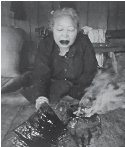
မှိုင်းဆီရရှိရန် ပြုလုပ်နေပုံ

အမျိုးသားရောအမျိုးသမီးများပါကွမ်းစားကြပြီးကွမ်းမှာရိုးရိုးကွမ်းသီး၊ကွမ်းရွက်မျိုး မဟုတ်ဘဲ အဲန်စကားအရ ညာနွင်းဟုခေါ်သော တောထဲကအရွက်နှင့် လုပ်မိုင်းဟု ခေါ်သော သစ်ပင်တစ်မျိုး၏ အခေါက်ကို ဆေးရွက်ကြီးနှင့် ထုံးထည့်ပြီး စားခြင်းဖြစ်သည်။ ကွမ်းစား သည့်အပြင် သွားများ မည်းမှောင်နေစေရန် မှိုင်းအဆီကို သုတ်လိမ်းကြသည်။ မှိုင်းအဆီ ရရှိအောင် ပြုလုပ်ပုံအဆင့်ဆင့်မှာ တောထဲတွင်ရှိသည့် “ကိုင်”ဟူသော သစ်ပင်တစ်မျိုးကို ခုတ်ယူပြီး အိမ်တွင် အခြောက်လှန်းထားရသည်။