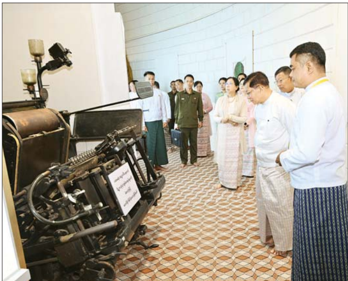
နိုင်ငံတော်သမ္မတ ဦးမင်းအောင်လှိုင်၊ ဇနီး ဒေါ်ကြူကြူလှနှင့်အဖွဲ့ဝင်များ ဆဋ္ဌသင်္ဂါယနာတင်ပိဋကသုံးပုံ ကျမ်းစာအုပ်များကို ခဲစာလုံးဖြင့် စတင်ရိုက်နှိပ်ခဲ့သော ပုံနှိပ်စက်ကို ကြည့်ရှုစဉ်။