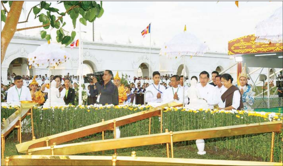
ပြည်ထောင်စုသမ္မတ မြန်မာနိုင်ငံတော် ဒုတိယသမ္မတ ဦးညိုစောနှင့် ဇနီး ဒေါ်စမ်းစမ်းအေး၊ ဒုတိယသမ္မတ ဒေါ်နန်းနီနီအေးတို့က မာရဝိဇယ ဗုဒ္ဓဥယျာဉ် ပရိသတ်တော်အတွင်းရှိ မဟာဗောဓိညောင်ပင်တော်ကို ညောင်ရေသွန်းလောင်း ပူဇော်ကြစဉ်။

နေပြည်တော် ဧပြီ ၃၀ ပြည်ထောင်စုသမ္မတ မြန်မာ နိုင်ငံတော်အစိုးရ ကဆုန်ညောင်ရေ သွန်းလောင်းပူဇော်ပွဲ အခမ်းအနား ကို ယနေ့ညနေပိုင်းတွင် ပြည် ထောင်စုနယ်မြေ နေပြည်တော် မာရဝိဇယဗုဒ္ဓဥယျာဉ် ပရိသတ် တော်အတွင်း၌ ကျင်းပရာ ပြည် ထောင်စုသမ္မတ မြန်မာနိုင်ငံတော် ဒုတိယသမ္မတ ဦးညိုစောနှင့် ဇနီး ဒေါ်စမ်းစမ်းအေး၊ ဒုတိယသမ္မတ ဒေါ်နန်းနီနီအေးတို့က ပရိသတ် တော်အတွင်းရှိ မဟာဗောဓိ ညောင်ပင်တော်ကို ညောင်ရေ သွန်းလောင်းပူဇော်ကြသည်။