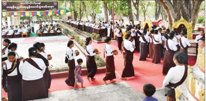
အလယ်ပိုင်းတိုင်းစစ်ဌာနချုပ် နန်းမြို့ဆုတောင်းဘုရား၌ ကဆုန်ညောင်ရေသွန်းလောင်းပွဲ ကျင်းပစဉ်။

ကို ညှိုးနွမ်းခြောက်သွေ့ခြင်း မရှိဘဲ ရှင်သန်သကဲ့သို့ ဘုရားရှင်၏ သာသနာတော်သည် ရှင်သန်လျက်ရှိနေမည်သာ ဖြစ်ပါကြောင်းနှင့် ဗုဒ္ဓမြတ်စွာဘုရားရှင်သည် ကဆုန်လပြည့်နေ့တွင် မဟာဗောဓိပင်ကို အမှီပြု၍ သဗ္ဗညုတဉာဏ်တော်ကို ရရှိတော်မူခဲ့ခြင်းကြောင့် ဗုဒ္ဓဘာသာဝင်များက မြတ်စွာဘုရားရှင်အား ရည်မှန်းအာရုံပြု၍ ကျင်းပလေ့ရှိသည့် မြန်မာ့ရိုးရာ ဆယ့်နှစ်လ ရာသီပွဲတော်များအနက် “ကဆုန်လပြည့်(ဗုဒ္ဓနေ့) ကဆုန်ညောင်ရေ သွန်းပွဲတော်” ကို အစဉ်အလာအရ ကျင်းပသည့်ပွဲတော်အဖြစ် သတ်မှတ်ခဲ့သည်မှာ ယနေ့တိုင်