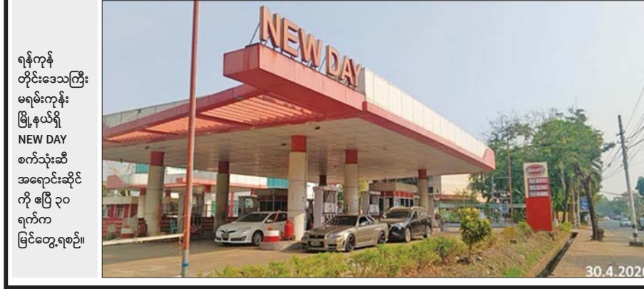
ရန်ကုန် တိုင်းဒေသကြီး မရမ်းကုန်း မြို့နယ်ရှိ NEW DAY စက်သုံးဆီ အရောင်းဆိုင် ကို ဧပြီ ၃၀ ရက်က မြင်တွေ့ရစဉ်။

နေပြည်တော် ဧပြီ ၃၀ မြန်မာသက္ကရာဇ် ၁၃၈၈ ခုနှစ် ကဆုန်လပြည့်(ဗုဒ္ဓနေ့)တွင် ဥပုသ်သန့် စေတီတော်မြတ်ကြီးနှင့် မာရဝိဇယပုဒ္ဂလိပ်ပွားတော်မြတ်ကြီးတို့အား ဝန်ကြီးဌာနများမှ ဝန်ထမ်းများနှင့် ကျောင်းသား ကျောင်းသူများစုပေါင်း၍ ဆိမ်းတိုင်များဖြင့် လှည့်လည်ပူဇော်ခြင်းအခမ်းအနားကို ယနေ့ညနေ ပိုင်းတွင် ဥပုသ်သန့်စေတီတော်မြတ်ကြီးပရိဝုဇ်နှင့် မာရဝိဇယပုဒ္ဂလိပ်ပွားတော်တို့တွင် ကျင်းပသည်။ ဦးစွာ ဗျာဒိတ်တော်ဒီယူတော်မူခြင်း၊ ဖွားမြင်တော်မူခြင်း၊ ဘုရား ပွင့်တော်မူခြင်းနှင့် ပရိနိဗ္ဗာန်တော်မူခြင်း စသည့်သရုပ်ပြယာဉ်များဖြင့် ဝန်ကြီးဌာနများမှ ဝန်ထမ်းများ၊ ကျောင်းသား ကျောင်းသူများသည် တပေါင်းကွင်းစုရပ်မှ စတင်ထွက်ခွာကြပြီး ဥပုသ်သန့်စေတီတော်မြတ် ကြီးအား လက်ယာရစ်လှည့်လည်ပူဇော်ကြသည်။ ထိုမှတစ်ဆင့် သရုပ်ပြယာဉ်များကို ဘုရားဖူးပြည်သူများ ဖူးမြော် ကြည့်ညိုနိုင်ရန် မာရဝိဇယပုဒ္ဂလိပ်ပွားတော်အတွင်း အပူဇော်ခံထားရှိ ကာ မာရဝိဇယပုဒ္ဂလိပ်ပွားတော်မြတ်ကြီးအား သတ်မှတ်လမ်းကြောင်း အတိုင်း လက်ယာရစ်လှည့်လည်ပူဇော်ကြောင်း သိရသည်။ သတင်းစဉ်