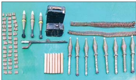
အကြမ်းဖက်သောင်းကျန်းသူ ပူးပေါင်းအဖွဲ့များထံမှ သိမ်းပိုက် ရရှိသည့် လက်နက်၊ ခဲယမ်းနှင့် ဆက်စပ်ပစ္စည်းများကို တွေ့ရ စဉ်။