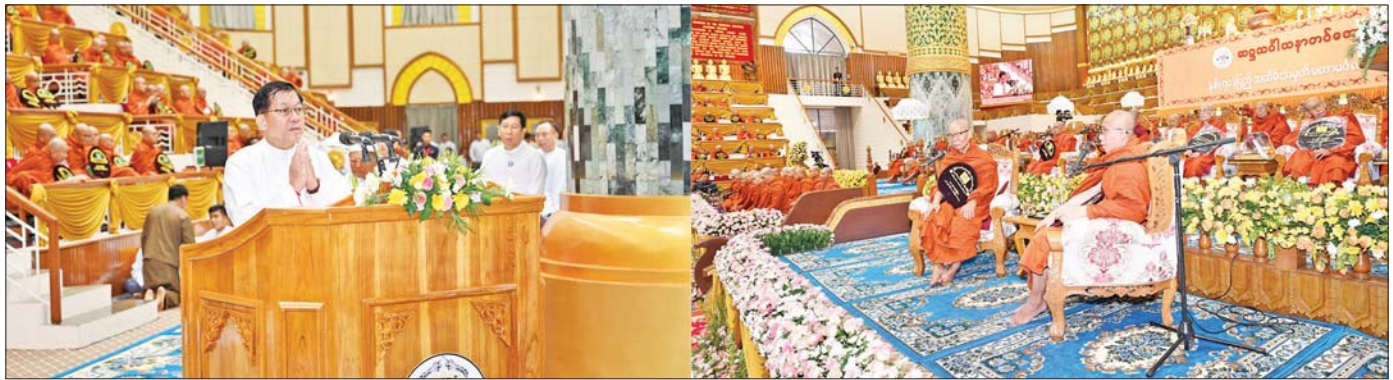
နိုင်ငံတော်သမ္မတ ဦးမင်းအောင်လှိုင် ဆဋ္ဌသင်္ဂါယနာတင်အောင်ပွဲ နှစ်(၇၀)ပြည့်အထိမ်းအမှတ် မဟာမင်္ဂလာအခမ်းအနားတွင် သာသနာရေးဆိုင်ရာများနှင့်ပတ်သက်၍ လျှောက်ထားတင်ပြစဉ်။