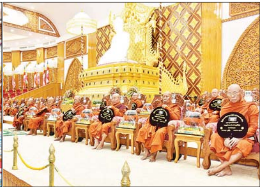
ဒုတိယသမ္မတ ဦးညိုစောနှင့်ဇနီး ဒေါ်စမ်းစမ်းအေး၊ ဒုတိယသမ္မတ ဒေါ်နန်းနီနီအေးနှင့် ဧည့်ပရိသတ်များက နိုင်ငံတော်သံဃမဟာနာယကအဖွဲ့၊ ဒုတိယဥက္ကဋ္ဌ မိတ္ထီလာမြို့ သာသနဓပုလ္လကျောင်းတိုက် ပဓာနနာယက ဆရာတော် ဘဒ္ဒန္တ ကောဝိဒထံမှ ကိုးပါးသံလှူဆောင်တည်ကြပြီး သံဃာတော်အရှင်သူမြတ်များ ရွတ်ပွားသရဇ္ဈာယ်တော်မူသော မေတ္တာသုတ်ပရိတ်တရားတော်များကို နာယူကြည့်ညိုကြစဉ်။