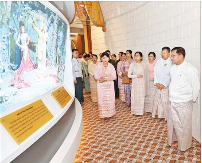
နိုင်ငံတော်သမ္မတ ဦးမင်းအောင်လှိုင်၊ ဇနီး ဒေါ်ကြူကြူလှနှင့်အဖွဲ့ဝင်များ ဆဋ္ဌသင်္ဂါယနာတင်အောင်ပွဲ နှစ်(၇၀) ပြည့်အထိမ်းအမှတ် ပြခန်းအတွင်း လှည့်လည်ကြည့်ရှုစဉ်။