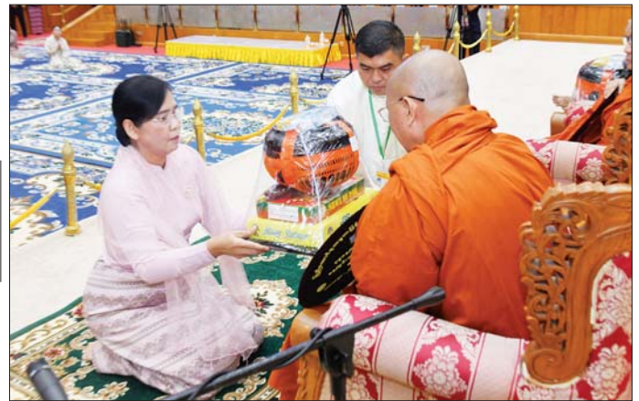
ဒုတိယသမ္မတ ဒေါ်နန်းနီနီအေး နိုင်ငံတော်သံဃမဟာနာယကအဖွဲ့ တွဲဖက်အကျိုးတော်ဆောင်၊ ဗဟန်း မြို့နယ် မဟာဝိသုဒ္ဓါရုံ ရွှေကျင်တိုက်သစ် တိုက်အုပ်ဆရာတော်ကြီးထံ လှူဖွယ်ဝတ္ထုပစ္စည်းများ ဆက်ကပ် လှူဒါန်းစဉ်။