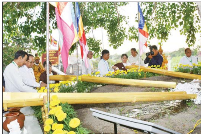
အခမ်းအနားသို့ ပြည်ထောင်စု ဝန်ကြီးများနှင့် ဇနီးများ၊ ပြည်

နေပြည်တော် ဧပြီ ၃၀ မြန်မာသက္ကရာဇ် ၁၃၈၈ ခုနှစ် ကဆုန်လပြည့် (ဗုဒ္ဓနေ့) တွင် နေပြည်တော် ဥပုသ်သန္တိစေတီ တော်မြတ်ကြီး ပရိပုဏ်တော် မြောက်ဘက်အရပ်ရှိ မဟာဗောဓိ ညောင်ပင်တော်များအား (၁၈)ကြိမ် မြောက် ကဆုန်ညောင်ရေ သွန်းလောင်းပူဇော်ခြင်း မင်္ဂလာ အခမ်းအနားကို ယနေ့ ညနေပိုင်း က ကျင်းပပြုလုပ်ရာ ပြည်ထောင်စု ဝန်ကြီးများနှင့် ဇနီးများက မဟာ ညောင်ပင်တော်များကို ညောင်ရေသွန်းလောင်း ပူဇော် ကြသည်။ အခမ်းအနားသို့ ပြည်ထောင်စု