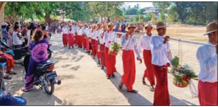
ချောင်းဆုံ

မွန်ပြည်နယ် ချောင်းဆုံမြို့နယ်၌ ကဆုန်လပြည့်(ဗုဒ္ဓနေ့) အခါသမယတွင် ညောင်ရေသွန်းလောင်းပွဲတော်ကို နှစ်စဉ်ပြုလုပ်လျက်ရှိရာ ယနေ့ညနေပိုင်းက ရွာလွတ်ကျေးရွာတွင် (၈၄) ကြိမ်မြောက် အဖွဲ့လိုက် စုပေါင်းညောင်ရေသွန်းလောင်းပွဲတော်ကို အစဉ်အလာမပျက်ကျင်းပရာ အဖွဲ့လိုက် စုပေါင်းညောင်ရေသွန်းလောင်းပွဲတော်ကို အဖွဲ့များမှ ရိုးရာယဉ်ကျေးမှုနှင့်အညီ တူညီဝတ်စုံများ ဝတ်ဆင်၍ ကျေးရွာအတွင်း လှည့်လည်ကာ ဗောဓိညောင်ပင်များသို့ ရေသွန်းလောင်းနေမှုများကို လာရောက်လည်ပတ်ကြည့်ရှုသူများဖြင့် စည်ကားလျက်ရှိပြီး မြို့နယ်အတွင်းရှိ ကျေးရွာများတွင်လည်း ညောင်ရေသွန်းလောင်းပွဲတော်များ ကျင်းပခြင်းနှင့် စတုဒိသာကျေးမွေးမြင်းများကို ဗုဒ္ဓနေ့ အထိမ်းအမှတ်အနေဖြင့် ကသိုလ်ယူလှူဒါန်းကျေးမွေးလျက်ရှိကြောင်း သိရသည်။ ကိုကျော်(ချောင်းဆုံ)