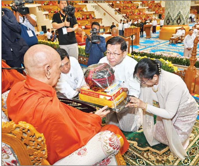
နိုင်ငံတော်သမ္မတ ဦးမင်းအောင်လှိုင်နှင့် ဇနီး ဒေါ်ကြူကြူလှတို့က နိုင်ငံတော်သံဃမဟာနာယက အဖွဲ့ဥက္ကဋ္ဌ သန့်လှိုင်မင်းကျောင်းဆရာတော်ကြီးထံ လှူဖွယ်ပစ္စည်းများ ဆက်ကပ်လှူဒါန်းစဉ်။

သင်္ဂါယနာတင်ခြင်းအစီဗျာယ်မှာ ဗုဒ္ဓအဆုံးအမ တရားတော်များကို “အညီအညွတ် စုပေါင်းရွတ်ဆို မှတ်တမ်းတင်ခြင်း” ဟု တပည့်တော်များ မှတ်သား ထားမိပါကြောင်း၊ မြတ်စွာဘုရားရှင်သည် သမ္မာ သမ္ဗုဒ္ဓအဖြစ်သို့ရောက်ရှိ ဖွင့်ထွန်းတော်မူသည်မှ မဟာပရိနိဗ္ဗာန်စံစင်သည်အထိ ၄၅၀၀ ကာလပတ်လုံး မြက်ဟထုတ်ဖော် ဟောကြားတော်မူခဲ့သည့် တရား တော်များသည် သတ္တဝါတစ်ဦးတစ်ယောက်မှအစ သတ္တဝါအများတို့နေထိုင်ရာလောကကြီး၌ ဓမ္မတရား ထွန်းပေါင်း၊ အဓမ္မတရားများ ပယ်ရှားနိုင်ရေးအတွက်