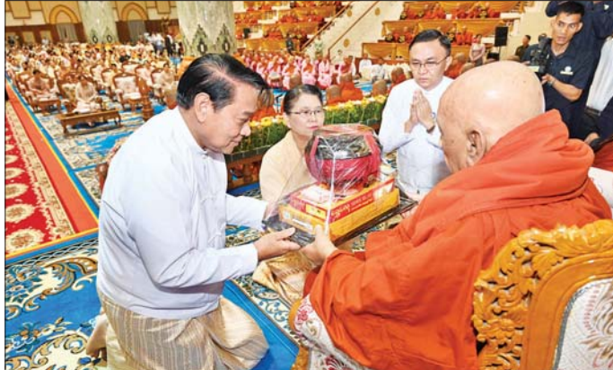
ပြည်သူ့လွှတ်တော်ဥက္ကဋ္ဌ ဦးခင်ရီနှင့်ဇနီးတို့က သီတဂူဆရာတော်ကြီးထံ လှူဖွယ်ပစ္စည်းများ ဆက်ကပ် လှူဒါန်းစဉ်။

“ဆဋ္ဌသင်္ဂါယနာတင် မဟာဓမ္မသဘင်ကြီး မြိမ်မြိမ်သံသံ ကျင်းပခဲ့သော မဟာ ပါသာဏ လိုဏ်ဂူသိမ်တော်ကြီး၊ ဥက္ကရာ ကုရု စသော ကျောင်းဆောင်ကြီး လေးဆောင် မဟာသိမ်တော်ကြီး၊ သုံးထပ် ဆွမ်းစားကျောင်းဆောင်၊ ပိဋကတ် ပုံနှိပ်တိုက်၊ ပိဋကတ်ပြတိုက်၊ မဟာနာယက ကျောင်းတော်ကြီးနှင့် ဝိယေမင်္ဂလာ ဓမ္မသဘင်တို့ကို ယခုဆဋ္ဌသင်္ဂါယနာတင် အောင်ပွဲ နှစ်(၇၀)ပြည့် မဟာမင်္ဂလာ အခမ်းအနားကြီး ကျင်းပခြင်းမပြုမီ ကြိုတင်၍ ရှေးမူပျက်ပြင်ဆင်မွမ်းမံ ခြင်း၊ တိုးချဲ့တည်ဆောက်ခြင်း၊ အဆင့် မြှင့်တင်မွမ်းမံခြင်းများ ဆောင်ရွက်”