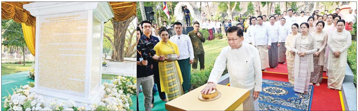
နိုင်ငံတော်သမ္မတ ဦးမင်းအောင်လှိုင် ဆဋ္ဌသင်္ဂါယနာတင်အောင်ပွဲ နှစ်(၇၀) ပြည့်အထိမ်းအမှတ် မော်ကွန်းကျောက်စာတိုင်ကို မင်္ဂလာစက်ခလုတ်နှိပ်ဖွင့်လှစ်ပေးစဉ်။

အဆိုပါ သာသနာ့သမိုင်းဝင် ဆဋ္ဌသင်္ဂါယနာ မဟာဓမ္မသဘင်ကြီး အောင်မြင်ပြီးမြောက်ခဲ့ခြင်း နှစ်(၇၀)ပြည့်အထိမ်းအမှတ် မဟာမင်္ဂလာအခမ်း အနားကြီးသို့ နိုင်ငံတော်သံဃမဟာနာယကအဖွဲ့ ဥက္ကဋ္ဌအဘိဓမ္မမဟာဂဠာရအဂ္ဂမဟာသဒ္ဓမ္မဇောတိက ဓဇ သန့်လှိုင်မင်းကျောင်းဆရာတော် ဒေါက်တာ ဘဒ္ဒန္တဓနိမာဘိဝံသနှင့် နိုင်ငံတော်ဩဝါဒါစရိယ ရွှေကျင်နိကာယ ဂဏာဓိပတိသောဠသမ ရွှေကျင် သာသနာပိုင်ဆရာတော် သီတဂူကမ္ဘာ့ပုဒ္ဂိုလ်သိုလ် များ၏ အဓိပတိ အဘိဓမ္မမဟာဂဠာရ အဘိဓမ္မ အဂ္ဂမဟာသဒ္ဓမ္မဇောတိက မဟာဓမ္မကထိက ဗဟု ဇနဟိတရ ဒေါက်တာ ဘဒ္ဒန္တဉာဏိသရတို့ အဖူး ပြုသည့် သက်တော်ရှည် နိုင်ငံတော်ဩဝါဒါစရိယ ဆရာတော်ကြီးများ၊ နိုင်ငံတော် သံဃမဟာနာယက အဖွဲ့ ဆရာတော်ကြီးများ၊ ပိဋကတ်တော်ဆောင် ဆရာတော်ကြီးများ၊ ပြည်ပနိုင်ငံအသီးသီးမှ သံဃ ရာဇာဆရာတော်ကြီးများအဖူးပြုသော ပြည်ပ သံဃာတော်များ၊ ပိဋကတ်အကျော်အမော်ဆရာ တော်ကြီးများ၊ ပရိယတ္တိဝန်ဆောင်ပဋိပတ္တိဝန်ဆောင် ဆရာတော်သံဃာတော်အရှင်သူမြတ်များ စုံစုံညီညီ ကြွရောက်ချီးမြှင့်တော်မူကြပြီး နိုင်ငံတော်သမ္မတနှင့် ဇနီးတို့နှင့်အတူ ပြည်သူ့လွှတ်တော်ဥက္ကဋ္ဌ ဦးခင်ရီနှင့် ဇနီး၊ အမျိုးသားလွှတ်တော်ဥက္ကဋ္ဌ ဦးအောင်လင်းဇွေး နှင့် ဇနီး၊ တပ်မတော်ကာကွယ်ရေးဦးစီးချုပ် ဝိုင်းချုပ်ကြီး ရဲဝင်းဦးနှင့် ဇနီး၊ ပြည်ထောင်စုဝန်ကြီး များနှင့် ဇနီးများ၊ ရန်ကုန်တိုင်းဒေသကြီး ဝန်ကြီးချုပ် နှင့် ဇနီး၊ ကာကွယ်ရေးဦးစီးချုပ်မှူးမှ အဆင့်မြင့် တပ်မတော်အရာရှိကြီးများနှင့် ဇနီးများ၊ မြန်မာနိုင်ငံ ဆိုင်ရာ နိုင်ငံတကာသံရုံးများမှ သံအမတ်ကြီးများ၊ စစ်သံဖျူးများနှင့် တာဝန်ရှိသူများ၊ ဒုတိယဝန်ကြီး များ၊ ဖိတ်ကြားထားသည့် ဧည့်သည်တော်ကြီးများ နှင့် တာဝန်ရှိသူများ တက်ရောက်ကြည့်ညိကြသည်။