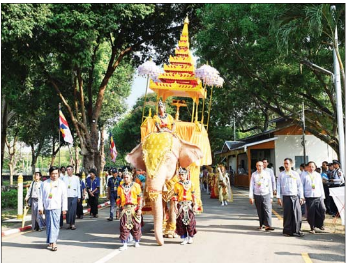
ပိဋကသုံးပုံကို မင်္ဂလာဆင်ဖြူတော်ရတနာဖြင့် ပင့်ဆောင်၍ မဟာပါသာဏလိုဏ်ဂူ သိမ်တော်ကြီးအား လက်ယာရစ်လှည့်လည်ပူဇော်ကြည့်ညိစဉ်။

အဆိုပါ သာသနာ့သမိုင်းဝင် ဆဋ္ဌသင်္ဂါယနာ မဟာဓမ္မသဘင်ကြီး အောင်မြင်ပြီးမြောက်ခဲ့ခြင်း နှစ်(၇၀)ပြည့်အထိမ်းအမှတ် မဟာမင်္ဂလာအခမ်း အနားကြီးသို့ နိုင်ငံတော်သံဃမဟာနာယကအဖွဲ့ ဥက္ကဋ္ဌအဘိဓမ္မမဟာဂဠာရအဂ္ဂမဟာသဒ္ဓမ္မဇောတိက ဓဇ သန့်လှိုင်မင်းကျောင်းဆရာတော် ဒေါက်တာ ဘဒ္ဒန္တဓနိမာဘိဝံသနှင့် နိုင်ငံတော်ဩဝါဒါစရိယ ရွှေကျင်နိကာယ ဂဏာဓိပတိသောဠသမ ရွှေကျင် သာသနာပိုင်ဆရာတော် သီတဂူကမ္ဘာ့ပုဒ္ဂိုလ်သိုလ် များ၏ အဓိပတိ အဘိဓမ္မမဟာဂဠာရ အဘိဓမ္မ အဂ္ဂမဟာသဒ္ဓမ္မဇောတိက မဟာဓမ္မကထိက ဗဟု ဇနဟိတရ ဒေါက်တာ ဘဒ္ဒန္တဉာဏိသရတို့ အဖူး ပြုသည့် သက်တော်ရှည် နိုင်ငံတော်ဩဝါဒါစရိယ ဆရာတော်ကြီးများ၊ နိုင်ငံတော် သံဃမဟာနာယက အဖွဲ့ ဆရာတော်ကြီးများ၊ ပိဋကတ်တော်ဆောင် ဆရာတော်ကြီးများ၊ ပြည်ပနိုင်ငံအသီးသီးမှ သံဃ ရာဇာဆရာတော်ကြီးများအဖူးပြုသော ပြည်ပ သံဃာတော်များ၊ ပိဋကတ်အကျော်အမော်ဆရာ တော်ကြီးများ၊ ပရိယတ္တိဝန်ဆောင်ပဋိပတ္တိဝန်ဆောင် ဆရာတော်သံဃာတော်အရှင်သူမြတ်များ စုံစုံညီညီ ကြွရောက်ချီးမြှင့်တော်မူကြပြီး နိုင်ငံတော်သမ္မတနှင့် ဇနီးတို့နှင့်အတူ ပြည်သူ့လွှတ်တော်ဥက္ကဋ္ဌ ဦးခင်ရီနှင့် ဇနီး၊ အမျိုးသားလွှတ်တော်ဥက္ကဋ္ဌ ဦးအောင်လင်းဇွေး နှင့် ဇနီး၊ တပ်မတော်ကာကွယ်ရေးဦးစီးချုပ် ဝိုင်းချုပ်ကြီး ရဲဝင်းဦးနှင့် ဇနီး၊ ပြည်ထောင်စုဝန်ကြီး များနှင့် ဇနီးများ၊ ရန်ကုန်တိုင်းဒေသကြီး ဝန်ကြီးချုပ် နှင့် ဇနီး၊ ကာကွယ်ရေးဦးစီးချုပ်မှူးမှ အဆင့်မြင့် တပ်မတော်အရာရှိကြီးများနှင့် ဇနီးများ၊ မြန်မာနိုင်ငံ ဆိုင်ရာ နိုင်ငံတကာသံရုံးများမှ သံအမတ်ကြီးများ၊ စစ်သံဖျူးများနှင့် တာဝန်ရှိသူများ၊ ဒုတိယဝန်ကြီး များ၊ ဖိတ်ကြားထားသည့် ဧည့်သည်တော်ကြီးများ နှင့် တာဝန်ရှိသူများ တက်ရောက်ကြည့်ညိကြသည်။