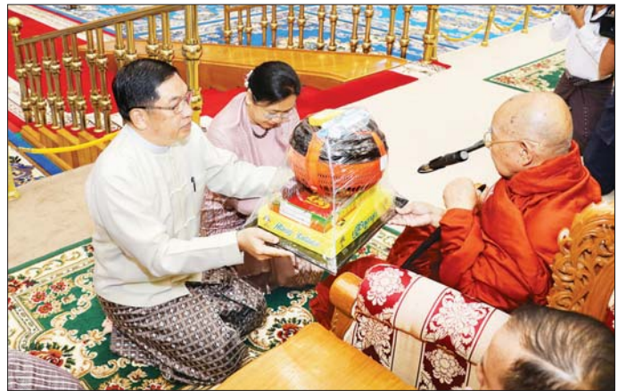
ဒုတိယသမ္မတ ဦးညိုစောနှင့်ဇနီး ဒေါ်စမ်းစမ်းအေး နိုင်ငံတော်သံဃမဟာနာယကအဖွဲ့ ဒုတိယဥက္ကဋ္ဌ မိတ္ထီလာမြို့ သာသနဝေပုလ္လကျောင်းတိုက် ပဓာနနာယက ဆရာတော်ကြီးထံ လှူဖွယ်ဝတ္ထုပစ္စည်းများ ဆက်ကပ်လှူဒါန်းစဉ်။

ဥက္ကဋ္ဌနှင့်ဇနီး၊ ပြည်ထောင်စု ရွေးကောက်ပွဲတော်မရှင် ဥက္ကဋ္ဌ နှင့်ဇနီး၊ ဒုတိယတပ်မတော် ကာကွယ်ရေးဦးစီးချုပ် ကာကွယ် ရေးဦးစီးချုပ် (ကြည်း) နှင့် ဇနီး၊ ပြည်ထောင်စုဝန်ကြီးများနှင့်ဇနီး များ၊ အခမ်းအနား တက်ရောက်