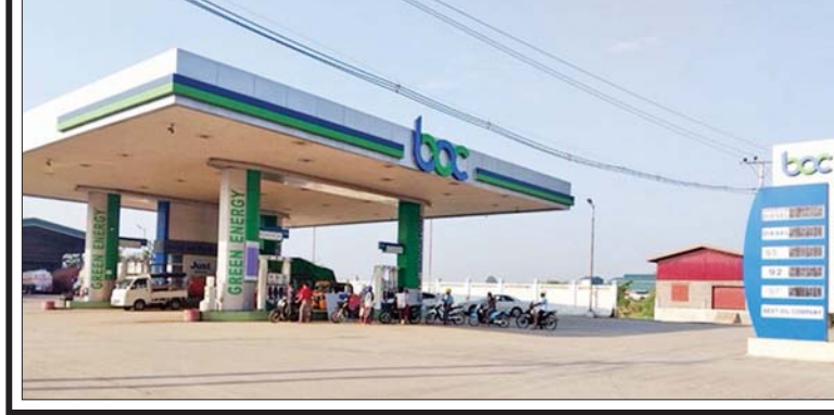
မန္တလေးတိုင်းဒေသကြီး အမရပူရ မြို့နယ်ရှိ BOC စက်သုံးဆီ အရောင်းဆိုင်ကို ဧပြီ ၃၀ ရက်က မြင်တွေ့ရစဉ်။

ကဆုန်လပြည့်နေ့ (ပုဒ္ဒနေ)အထိမ်းအမှတ်အဖြစ် နိုင်ငံတစ်ဝန်းရှိ အကျဉ်းထောင်၊ အချုပ်ထောင်၊ စခန်းအသီးသီးမှ ပြစ်ဒဏ်ကျခံနေရသည့် အကျဉ်းသား အကျဉ်းသူများအား ပြစ်ဒဏ်လွတ်ငြိမ်းသက်သာခွင့်ပြု စာ ၂၀