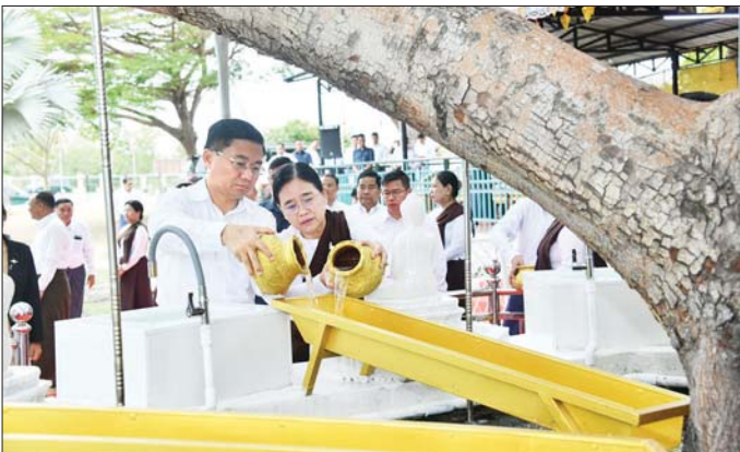
ဘုရားကြီးအား ဆီမီး၊ ပန်း၊ ရေချမ်းကပ်လှူပူဇော်သည်။ ထို့နောက် ကဆုန်ညောင်ရေ သွန်းလောင်းပူဇော်ခြင်း မင်္ဂလာ

ဦးစွာ ဒုတိယတပ်မတော် ကာကွယ်ရေးဦးစီးချုပ်၊ ကာကွယ်ရေးဦးစီးချုပ်(ကြည်း)၊ ဗိုလ်ချုပ်ကြီး ကျော်စွာလင်းနှင့် ဇနီး ဒေါ်နန်းကူးကုတို့က လောကချမ်းသာဆုတောင်းပြည့်အသင်း