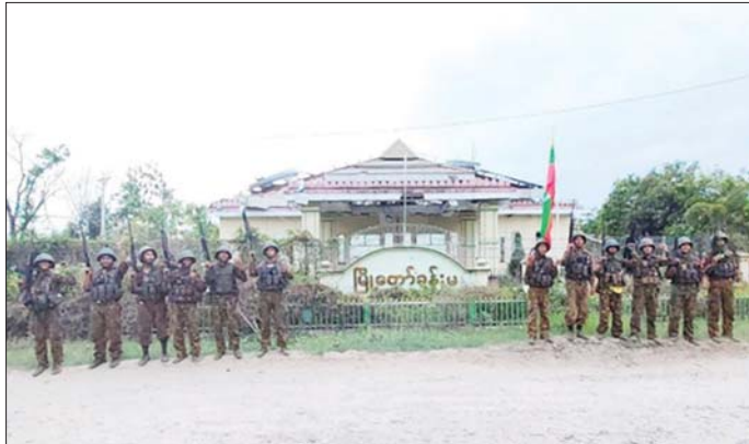
တပ်မတော်စစ်ကြောင်းများက မြို့တော်ခန်းမအား ပြန်လည်သိမ်းပိုက်ရရှိစဉ်။