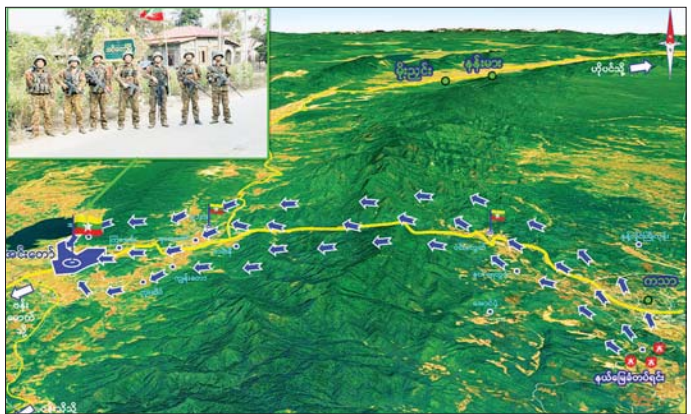
တပ်မတော်စစ်ကြောင်းများက အကြမ်းဖက်သောင်းကျန်းသူများ ယာယီစိုးမိုးထားသည့် အင်းတော်မြို့အား အလုံးစုံ ပြန်လည်သိမ်းပိုက်ထိန်းချုပ်စဉ်။

အကြမ်းဖက် ပူးပေါင်းအဖွဲ့ များအနေဖြင့် အင်းတော်မြို့နှင့်