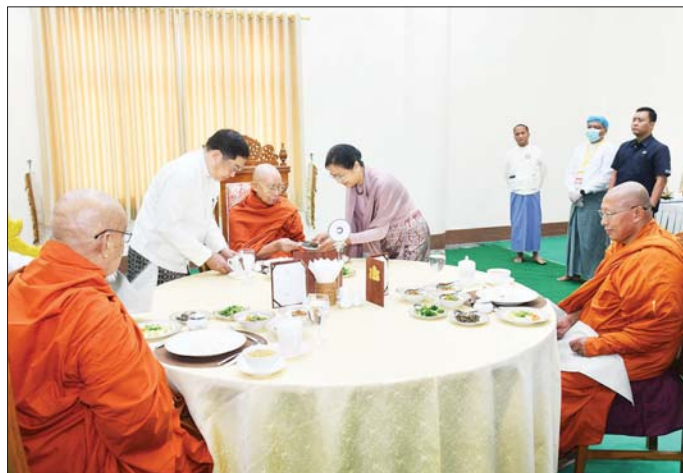
ပြည်ထောင်စုသမ္မတ မြန်မာနိုင်ငံတော် ဒုတိယသမ္မတ ဦးညိုစောနှင့်ဇနီး ဒေါ်စမ်းစမ်းအေး ကဆုန်လပြည့် ဗုဒ္ဓနေ့ အထိမ်းအမှတ်အဖြစ် ဆင်ယင်ကျင်းပပူဇော်သည့် မဟာမင်္ဂလာအခမ်းအနားသို့ ကြွရောက်တော် မူကြသည့် ဆရာတော်ကြီးများအား နေ့ဆွမ်းဆက်ကပ်လှူဒါန်းစဉ်။

ဒုတိယသမ္မတ ဦးညိုစောက အဂ္ဂိမိပတိသာသနာဗိမာန်တော် ကြီးအတွင်းရှိ မာရဝိဇယ နောင်တော်ကြီး ဗုဒ္ဓရုပ်ပွားတော် မြတ်အား မြသပိတ်ဆွမ်းတော်၊ သစ်သီး၊ ပန်းမန်၊ သောက်တော် ရေချမ်းနှင့် ဆီမီးကပ်လှူပူဇော် သည်။ ထို့နောက် အခမ်းအနားကို “နမောတဿ” သုံးကြိမ်ရွတ်ဆို ဘုရားကန်တော့ ဖွင့်လှစ်၍ နိုင်ငံတော် သံဃမဟာနာယက အဖွဲ့ဒုတိယဥက္ကဋ္ဌ မိတ္ထီလာမြို့ သာသနဝေပုလ္လကျောင်းတိုက် ပဓာနနာယက ဆရာတော် ဘဒ္ဒန္တ ကောဝိဒထံမှ ဒုတိယသမ္မတ ဦးညိုစောနှင့်ဇနီး၊ ဒုတိယသမ္မတ ဒေါ်နန်းနီနီအေးနှင့် ဧည့်ပရိသတ် များက ကိုးပါးသီလ ခံယူဆောင် တည်ကြပြီး သံဃာတော်အရှင်သူ မြတ်များ ရွတ်ပွားသရဇ္ဈာယ်တော် မူသော မေတ္တာသုတ်ပရိတ်တရား တော်များကို နာယူကြည်ညိုကြ သည်။ ယင်းနောက် ဒုတိယသမ္မတ ဦးညိုစောနှင့်ဇနီးတို့က နိုင်ငံတော် သံဃမဟာနာယကအဖွဲ့ ဒုတိယ ဥက္ကဋ္ဌ မိတ္ထီလာမြို့ သာသနဝေပုလ္လ