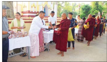
အလှူရှင်များက ဆွမ်း၊ ဆွမ်းဟင်း၊ လှူဖွယ်ပစ္စည်းများနှင့် ဆွမ်းဆန်စိမ်း လောင်းလှူပူဇော်ကြကြောင်း သိရသည်။ (မြို့နယ် (ပြန်/ဆက်)

ဆက်လက်၍ ကဆုန်လပြည့် (ဗုဒ္ဓနေ့)အထိမ်းအမှတ် ပင့်လျှောက် ၍ ကြွရောက်တော်မူလာကြသည့် ဆရာတော် သံဃာတော် (၁၀၈)ပါး အား ခရိုင်နှင့်မြို့နယ်အထိမ်းအမှတ် စိမ်းခန့်ခွဲရေးနှင့်အုပ်ချုပ်ရေး ကော်မတီဥက္ကဋ္ဌနှင့် အဖွဲ့ဝင်များ၊ ဌာနဆိုင်ရာ ဝန်ထမ်းများ၊ စေတနာရှင်