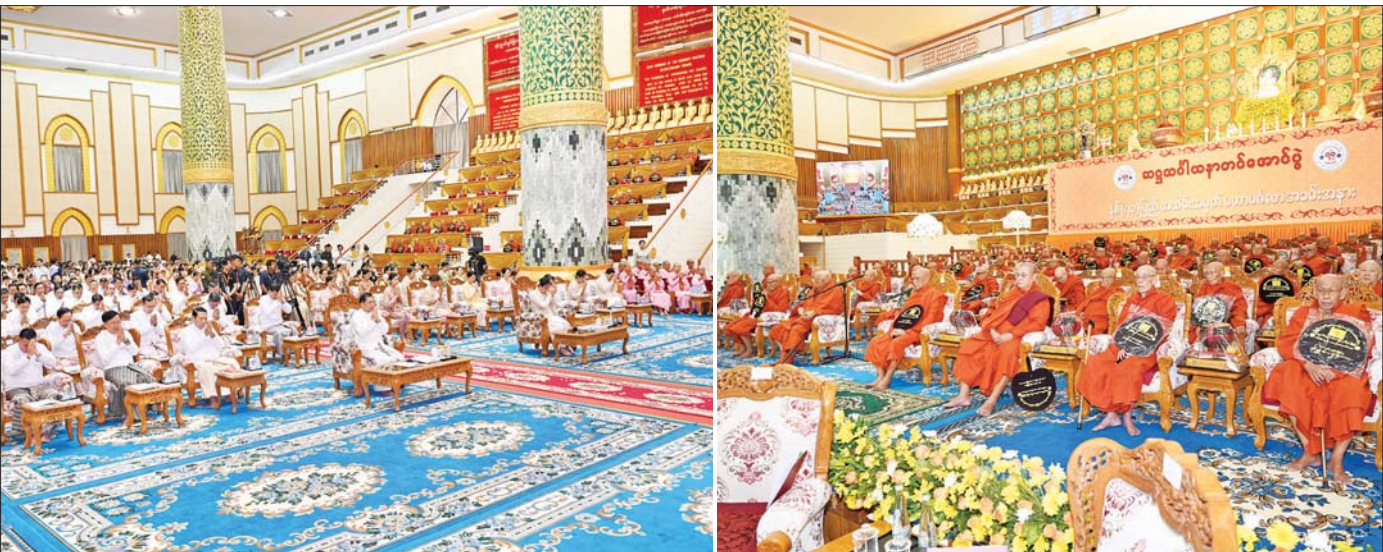
နိုင်ငံတော်သမ္မတ ဦးမင်းအောင်လှိုင်၊ ဇနီး ဒေါ်ကြူကြူလှနှင့် ဧည့်ပရိသတ်များက နိုင်ငံတော်သံဃမဟာနာယကအဖွဲ့ဥက္ကဋ္ဌ သန့်လှိုင်မင်းကျောင်း ဆရာတော်ကြီးထံမှ ကိုးပါးသီလံယူဆောက်တည်ကြပြီး သံဃာတော်အရှင်သုမြတ်များ ရွတ်ပွားသရဇ္ဈာယ်တော်မူကြသည့် မေတ္တာသုတ်ပရိတ်တရားတော်ကို နာယူကြည့်ညိုကြစဉ်။

အပေါ် တည်တံ့လျက်ရှိပါသည်။ ထို့ကြောင့် နိုင်ငံတော်အစိုးရသည် အရည်အသွေးကောင်းမွန်သည့် ထုတ်ကုန်များကို ဖန်တီးဖော်ဆောင်ရာတွင် အဓိကကျသော အလုပ်သမားအင်အားထုကြီးကို လေးစားစွာ ဂုဏ်ပြုပါကြောင်း ဦးစွာပထမဖော်ပြအပ်ပါသည်။ ချစ်ကြည်လေးစားအပ်ပါသော အလုပ်သမားကြီးများ ခင်ဗျား မြန်မာနိုင်ငံသည် ၁၉၄၈ ခုနှစ်၊ မေလ (၁၈) ရက်နေ့မှစ၍ အပြည်ပြည်ဆိုင်ရာအလုပ်သမားရေးရာအဖွဲ့ (International Labour Organization-ILO) တွင် အဖွဲ့ဝင်နိုင်ငံတစ်နိုင်ငံ ဖြစ်လာသည်နှင့်အညီ စာမျက်နှာ ၃ ကော်လံ ၁ *