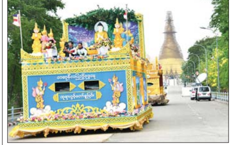
ဥပုသ်သန့်စေတီတော်မြတ်ကြီးနှင့် မာရဝိဇယ ပုဒ္ဂလိပ်ပွားတော်မြတ်ကြီးအား ဆိမ်းတိုင်များဖြင့် လှည့်လည်ပူဇော်

စက်သုံးဆီဖြန့်ဖြူးနေမှု တည်ငြိမ်သည့်အခြေအနေသို့ ရောက်ရှိ လာမှုအပေါ် ပျက်ပြားစေရန်ရည်ရွယ်၍ ကောလာဟလ မဟုတ်မမှန် သတင်းများ ပြည်ပမီဒီယာများသို့ ပေးပို့နေသူများရှိခြင်းနှင့် ပြည်ပ မီဒီယာအချို့မှ ပြည်သူများ ထင်ယောင်ထင်မှားဖြစ်စေရန် မမှန်ကန် သည့်ဓာတ်ပုံများ၊ သတင်းများ ထုတ်လွှင့်ဖြန့်ဝေခြင်းများရှိနေသော် လည်း ပြည်သူလူထု၏ ပူးပေါင်းပါဝင်ဆောင်ရွက်မှုများကြောင့် လက်ရှိအခြေအနေတွင် စက်သုံးဆီအရောင်းဆိုင်များ၌ စက်သုံးဆီ ဖြန့်ဖြူးမှုမှာ တည်ငြိမ်၍ ပုံမှန်အခြေအနေတွင်ရှိနေသည်ကို တွေ့ရှိရ ပါသည်။ လျှပ်စစ်နှင့်စွမ်းအင်ဝန်ကြီးဌာနအနေဖြင့် စက်သုံးဆီများကို ပြည်သူများအားလုံး ညီတူညီမျှ လုံလောက်စွာ သုံးစွဲနိုင်စေရေး အစဉ် တစိုက် စီမံဆောင်ရွက်နေမှုအပေါ် ယခုကဲ့သို့ ပြည်သူများ၏ အလေး အနက်ထား ပူးပေါင်းပါဝင်ဆောင်ရွက်မှုအား ကျေးဇူးအထူးတင်ရှိပါ ကြောင်း သတင်းထုတ်ပြန်အပ်ပါသည်။ လျှပ်စစ်နှင့်စွမ်းအင်ဝန်ကြီးဌာန