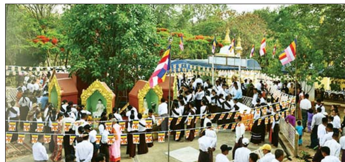
အရေပိုင်းတိုင်းစစ်ဌာနချုပ်၌ ကဆုန်ညောင်ရေသွန်းလောင်းပွဲ ကျင်းပစဉ်။

ဗောဓိပင်တော်များကို ကဆုန်ညောင်ရေ သွန်းလောင်းခြင်းသည် မဟာဗောဓိပင်များ စိမ်းလန်းစိုပြည်၍ အခက်အလက်တို့ ဝေဆာစေခြင်း၊ သက်တမ်းရှည်စေခြင်းနှင့် သက်တော်ထင်ရှားရှိသော ဘုရားရှင်အား ပူဇော်ရာရောက်ခြင်းတို့ကြောင့် တည်ငြိမ်အေးချမ်း၍ သာယာဝပြောသော နိုင်ငံအဖြစ် တည်ရှိစေရုံသာမက နိုင်ငံသူ၊ နိုင်ငံသားများ အားလုံးကိုလည်း နှလုံးစိတ်ဝမ်းအေးချမ်းစေလျက် တူညီသော အကျိုးတရားများကို ဖြစ်ထွန်းစေမည်ဖြစ်သည်။ ကဆုန်ညောင်ရေ သွန်းလောင်းခြင်းသည် ညောင်ပင်များ