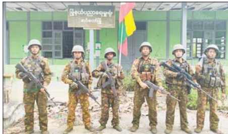
တပ်မတော်စစ်ကြောင်းများက မြို့နယ် ပညာရေးဗဟိုရုံးအား ပြန်လည်သိမ်းပိုက်ရရှိစဉ်။