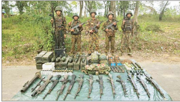
တပ်မတော်စစ်ကြောင်းများက အကြမ်းဖက်သောင်းကျန်းသူပူးပေါင်းအဖွဲ့များထံမှ သိမ်းပိုက်ရရှိသည့် လက်နက်၊ ခဲယမ်းနှင့် ဆက်စပ်ပစ္စည်းများကို တွေ့ရစဉ်။