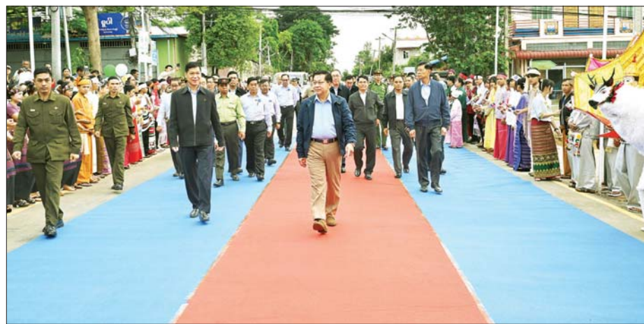
ပြည်ထောင်စုသမ္မတမြန်မာနိုင်ငံတော် နိုင်ငံတော်သမ္မတ ဦးမင်းအောင်လှိုင် အဆင့်မြှင့်တင်ဖွင့်လှစ်ခဲ့ပြီးဖြစ်သည့် သီရိလမ်းတစ်လျှောက် ကြည့်ရှုစစ်ဆေးစဉ်။

သည့် သီရိလမ်းတစ်လျှောက် လှည့်လည်ကြည့်ရှုစစ်ဆေးခဲ့ပြီး တက်ရောက်လာကြသည့် ဌာနဆိုင်ရာဝန်ထမ်းများနှင့် ဒေသခံပြည်သူများအား ရင်းရင်းနှီးနှီး နှုတ်ဆက်သည်။ ကြည့်ရှုစစ်ဆေး ထို့နောက် နိုင်ငံတော်သမ္မတနှင့် အဖွဲ့ဝင်များသည် အဆင့်မြှင့်တင်ဖွင့်လှစ်ခဲ့ပြီး ဖြစ်သည့် ပြင်ဦးလွင်မြို့၊ ပဒေသာမြို့သစ်ရပ်ကွက်ကြီး ၈ နှင့် ၁၀ ရှိ အဓိကလမ်းမကြီး (၅) လမ်းအား မော်တော်ယာဉ်များဖြင့် လှည့်လည်ကြည့်ရှုစစ်ဆေးခဲ့ကြသည်။ ပြင်ဦးလွင်မြို့သည် အေးချမ်းသာယာသည့် တောင်ပေါ်မြို့ဖြစ်သည့်အပြင် ပြည်တွင်း ပြည်ပခရီးသွားများ လာရောက်