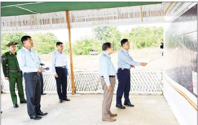
ပြည်ထောင်စုသမ္မတမြန်မာနိုင်ငံတော် နိုင်ငံတော်သမ္မတ ဦးမင်းအောင်လှိုင် ဗဟိုဦးစီးသတ်သင်တန်း ကျောင်းသို့ ဝင်ရောက်သည့် လမ်းသစ်ဖောက်လုပ်နေသည့်လုပ်ငန်းခွင်အား ကြည့်ရှုစဉ်။