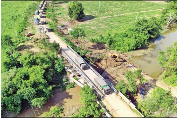
မန္တလေးမှ မြစ်ကြီးနားသို့ ဌာနဆိုင်ရာ ဝန်ထမ်းများနှင့်အတူ ကုန်ပစ္စည်းများ သွားရောက်ပို့ဆောင်သည့် မော်တော်ယာဉ်များ မြစ်ကြီးနားမှ မန္တလေးသို့ ပြန်လည်ထွက်ခွာလာစဉ်။

အဆိုပါ ဒေသများတွင် နိုင်ငံတော်အစိုးရ၏ အုပ်ချုပ်မှု ယန္တရားများ ပြန်လည်လည်ပတ် နိုင်ရေး၊ ဒေသခံတိုင်းရင်းသား ပြည်သူများအနေဖြင့် ၎င်းတို့၏ နေရပ်ဒေသများ၌ ပြန်လည်အခြေ ချနေထိုင်စဉ်စားဝတ်နေရေးအဆင် ပြေချောမှု၊ စေတနာ၊ ကျောင်းဖွင့် ရာသီအစီ ကျောင်းသုံးပြဋ္ဌာန်းစာ အုပ်များနှင့် စာရေးကိရိယာများ အချိန်မီရောက်ရှိရေး၊ ကျန်းမာရေး စောင့်ရှောက်မှု လုပ်ငန်းများ အတွက် ဆေးပစ္စည်းလိုအပ်ချက် များ ဖြည့်ဆည်းပေးနိုင်ရေးနှင့် အခြားသော လိုအပ်ချက်များကို ပြန်လည်ဖြည့်ဆည်းပေးနိုင်ရေး အတွက် နိုင်ငံတော်အစိုးရနှင့် တပ်မတော်၏ စီမံဆောင်ရွက်မှု ဖြင့် ဌာနဆိုင်ရာဝန်ထမ်းများနှင့် အတူ အခြေခံစားသောက်ကုန် များ၊ လူသုံးကုန်ပစ္စည်းများ၊ ဆောက်လုပ်ရေး လုပ်ငန်းသုံး ပစ္စည်းများ၊ ဆေးနှင့် ဆေးပစ္စည်း များ၊ ကျောင်းသုံးစာအုပ်များ၊