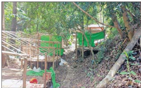
မိုင်းရှူးမြို့နယ် မိုင်းစံမြို့အရှေ့ဘက် ဟိုပွဲရွာအနီး သံလွင်မြစ် အနောက်ဘက်ကမ်းဘေး၌ သိမ်းဆည်းရမိသည့် အုန်လှိုင်းလိမ်လည် လောင်းကစားမှုများလုပ်ကိုင်ဆောင်ရွက်သည့် လူနေတံများကို တွေ့ရစဉ်။