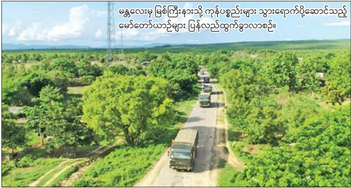
မန္တလေးမှ မြစ်ကြီးနားသို့ ကုန်ပစ္စည်းများ သွားရောက်ပို့ဆောင်သည့် မော်တော်ယာဉ်များ ပြန်လည်ထွက်ခွာလာစဉ်။

နေပြည်တော် မေ ၁၆ တပ်မတော်အနေဖြင့် အကြမ်းဖက်သောင်းကျန်းသူများ ယာယီစိုးမိုးပိတ်ဆို့ထားသည့် မြန်မာနိုင်ငံ၏ မြောက်ပိုင်းဒေသဖွံ့ဖြိုးတိုးတက်ရေးအတွက် အရေးကြီးသော အခြေခံအဆောက်အအုံတစ်ခုဖြစ်သည့် မန္တလေးတိုင်းဒေသကြီးမှ စစ်ကိုင်းတိုင်းဒေသကြီးနှင့် ကချင်ပြည်နယ်အထိ ဆက်သွယ်ထားသည့် မန္တလေး - မတ္တရာ - သပိတ်ကျင်း - တကောင်း - ထီးချိုင့် - ကသာ - အင်းတော် - မော်လမြိုင် - နန့်စီး - အောင် - မိုးညှင်း - မိုးကောင်း - မြစ်ကြီးနား ဆက်သွယ်ရေး လမ်းကြောင်းအား မေ ၆ ရက်တွင် အပြည့်အဝ ပြန်လည်ထိန်းချုပ်ဖွင့်လှစ်ပေးခဲ့သည်။ စာမျက်နှာ ၁၃ ကော်လံ ၁