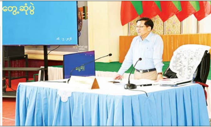
ပြည်ထောင်စုသမ္မတမြန်မာနိုင်ငံတော် နိုင်ငံတော်သမ္မတ ဦးမင်းအောင်လှိုင် ပြင်ဦးလွင်မြို့ရှိ မြို့မမြို့နယ်၊ အသေးစား၊ အငယ်စားနှင့် အလတ်စား စီးပွားရေး (MSME) လုပ်ငန်းရှင်များနှင့် တွေ့ဆုံပွဲ ဒေသဖွံ့ဖြိုးတိုးတက်ရေးဆိုင်ရာများအား ဆွေးနွေးပြောကြားစဉ်။