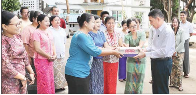
ဇီဝမျိုးစုံ ကြွယ်စေ့ဖို့၊ သဘာဝတောတွေ ထိန်းသိမ်းဖို့။

မန္တလေး မေ ၁၆ သာသနာရေး ဝန်ကြီးဌာန ပြည်ထောင်စုဝန်ကြီး ဦးထိန်လင်းသည် ယနေ့နံနက်ပိုင်းတွင် မန္တလေးတိုင်းဒေသကြီး ကျောက်ဆည်မြို့ရှိ ငလျင်ဒဏ်သင့် ဆည်တော်နဲ့ ရွှေမုဋ္ဌာစေတီတော်အား ပြည်ထောင်စုဝန်ကြီးနှင့် ဝန်ထမ်းများ၊ ခုနစ်ရက်သားသမီးများ၏ စုပေါင်းလှူဒါန်းမှုတို့ဖြင့် ပြန်လည်ပြုပြင်ပြီးစီးမှုကို ကြည့်ရှုစစ်ဆေးသည်။ ယမန်နေ့ မွန်းလွဲပိုင်းကလည်း မန္တလေးတိုင်းဒေသကြီးအတွင်းရှိ ဘုရား၊ စေတီ၊ ပုထိုးများ ဘုန်းတော်ကြီးကျောင်းများ သန့်ရှင်းသင်္ဂြိုဟ်ရေးအတွင်းရှိ ဘုရား၊ စေတီ၊ ပုထိုးများ