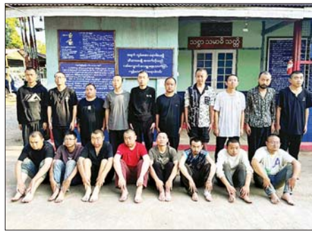
မိုင်းရှူးမြို့နယ် လွယ်ဆောင်ထောက်ကျေးရွာဝန်းကျင် သံလွင်မြစ် အနီး၌ ဖမ်းဆီးရမိသည့် တရားမဝင် တရုတ်နိုင်ငံသား အမျိုးသား ၁၈ ဦးကို တွေ့ရစဉ်။

များမရှိစေရေး ရှာဖွေဖော်ထုတ် ဖမ်းဆီးခြင်း၊ အရေးယူဆောင်ရွက် ခြင်းများကို ပြတ်ပြတ်သားသား ကိုင်တွယ်ဆောင်ရွက်ခြင်း၊ လုံခြုံ ရေးတပ်ဖွဲ့ဝင်များ ပါဝင်သည့် ပူးပေါင်းအဖွဲ့များက တင်းတင်း ကျပ်ကျပ် စိစစ်ရှာဖွေဖော်ထုတ် ခြင်းများ ဆောင်ရွက်လျက်ရှိ သည်။ ပြည်သူများအနေဖြင့် လည်း မိမိတို့ပတ်ဝန်းကျင်တွင် အဆိုပါ ဒုစရိုက်လုပ်ငန်းများ လုပ်ဆောင်နေသည့် သတင်းများ ရရှိပါက အချိန်နှင့်တစ်ပြေးညီ ပေးပို့ခြင်းဖြင့် နိုင်ငံကောင်းကျိုး သယ်ပိုးကြွေးမြီ လိုအပ်ကြောင်း ထုတ်ပြန်ထားသည်။ သတင်းစဉ်