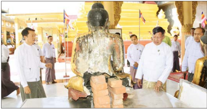
ပြည်ထောင်စုဝန်ကြီး ဦးထိန်လင်း ငလျင်ဒဏ်ကြောင့် ထိခိုက်ပျက်စီးခဲ့သည့် ဆည်တော်နဲ့ ရွှေမုဋ္ဌာစေတီတော် ပြန်လည်ပြုပြင်နေမှု ကြည့်ရှုစစ်ဆေး

အဆောင်ဝင်းများအတွင်း သန့်ရှင်းသောယာယုပေး ဆောင်ရွက်ထားရှိမှု၊ အိမ်ရာနှင့် အဆောင်စည်းကမ်းများနှင့်အညီ နေထိုင်နေမှု ပြုပြင်ပြီးစီးသွားသည့် အဆောက်အအုံများ၏ ကြံ့ခိုင်မှုအခြေအနေ၊ ရေနှင့် လျှပ်စစ်မီးရရှိမှုတို့ကို မေးမြန်းအေးပေးကာ ဝန်ထမ်းများနှင့် မိသားစုဝင်များအတွက် စားသောက်ဖွယ်ရာများ ပေးအပ်ချီးမြှင့်ခဲ့သည်။ (အောက်ပုံ)