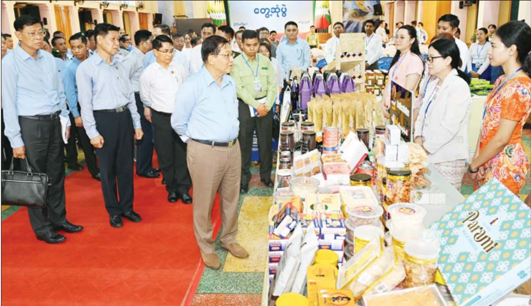
ပြည်ထောင်စုသမ္မတမြန်မာနိုင်ငံတော် နိုင်ငံတော်သမ္မတ ဦးမင်းအောင်လှိုင် ပြင်ဦးလွင်အတွင်းရှိ အသေးစား၊ အငယ်စားနှင့် အလတ်စား စီးပွားရေး (MSME) လုပ်ငန်းများမှထွက်ရှိသည့် ဒေသထွက်စားသောက်ကုန်များ ခင်းကျင်းပြသထားရှိမှုကို ကြည့်ရှုစဉ်။

တင်ပြချက်များနှင့် စပ်လျဉ်း၍ ပြည်ထောင်စုဝန်ကြီးများက ပြန်လည်ဆွေးနွေးပြောကြားရာတွင်