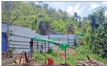
မိုင်းရှူးမြို့နယ် မိုင်းစံမြို့အရှေ့ဘက် ဟိုပွဲရွာအနီး သံလွင်မြစ် အနောက်ဘက်ကမ်းဘေး၌ သိမ်းဆည်းရမိသည့် အုန်လှိုင်းလိမ်လည် လောင်းကစားမှုများလုပ်ကိုင်ဆောင်ရွက်သည့် ထမင်းချက်တံကို တွေ့ရစဉ်။