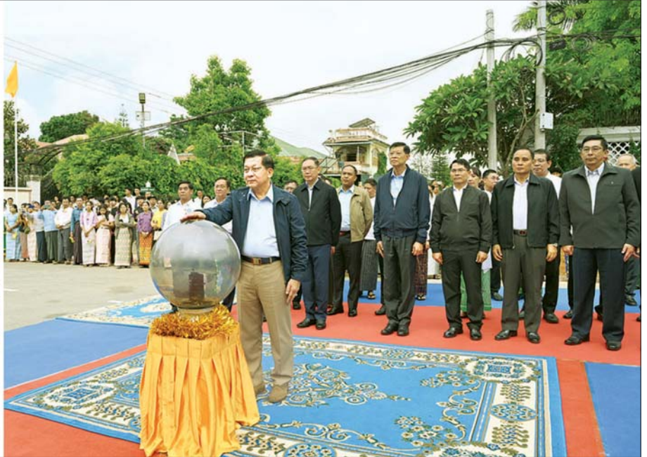
ပြည်ထောင်စုသမ္မတမြန်မာနိုင်ငံတော် နိုင်ငံတော်သမ္မတ ဦးမင်းအောင်လှိုင် မန္တလေးတိုင်းဒေသကြီး ပြင်ဦးလွင်မြို့ ပဒေသာမြို့သစ် ရပ်ကွက်ကြီး ၈ နှင့် ၁၀ ရှိ အဓိကလမ်းမကြီး(၅)လမ်းအား အဆင့်မြှင့်တင်ဖွင့်လှစ်ခြင်း အထိမ်းအမှတ် ကမ္ဘာ့ဦးမော်ကွန်းအား စက်ခလုတ်နှိပ်၍ ဖွင့်လှစ်ပေးစဉ်။