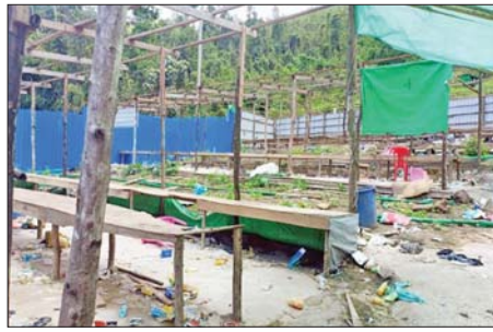
မိုင်းရှူးမြို့နယ် မိုင်းစံမြို့အရှေ့ဘက် ဟိုပွဲရွာအနီး သံလွင်မြစ် အနောက်ဘက်ကမ်းဘေး၌ သိမ်းဆည်းရမိသည့် အုန်လှိုင်းလိမ်လည် လောင်းကစားမှုများလုပ်ကိုင်ဆောင်ရွက်သည့် အဆောက်အအုံများ ကို တွေ့ရစဉ်။