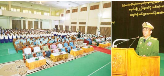
တည်ဆောက်မည့် မြေနေရာကို ကြည့်ရှုစစ်ဆေး ကြီးကြပ်ရေးရုံး၌ ယန္တရားကြီးများနှင့် ထောက်ပံ့ရေး ပစ္စည်းများ ထိန်းသိမ်းထားရှိမှုတို့ကို ကြည့်ရှုစစ်ဆေး သည့်။ ယင်းနောက် ဒဂုံမြို့သစ်မြောက်ပိုင်းရှိ ဗဟို လေ့ကျင့်ရေးကျောင်းနှင့် ဒဂုံမြို့သစ်ခရိုင် ဖွံ့ဖြိုးမှု ဘဏ်

၏ စဉ်ဆက်မပြတ် ကြိုးစားအားထုတ်လေ့လာမှုများ ကြောင့် ယခုအခါ မဟာဝိဇ္ဇာဘွဲ့၊ ၇၃ ဦး၊ မဟာသိပ္ပံဘွဲ့၊ ၁၄၇ ဦး၊ M.Res ဘွဲ့၊ ၅၅ ဦး၊ Ph.D ဘွဲ့၊ ၁၇၅ ဦး၊ B.E ဘွဲ့၊ ၃၀၃ ဦး၊ M.E ဘွဲ့၊ ၁၅ ဦး၊ B.Tech ဘွဲ့၊ ၄၅၂ ဦး ရှိလာ သည်မှာ အားရကျေနပ်ဖွယ်ဖြစ်ပါကြောင်း ပြောကြား ပြီး ပြည်ထောင်စုဝန်ကြီးနှင့်ဝန်ကြီးဌာနများမှ ကိုယ်စား လှယ်များက ဝိဇ္ဇာဘာသာနှင့် သိပ္ပံဘာသာထူးချွန်ဆရာ ကျောင်းသားများအား ထူးချွန်ဆရာများ၊ သင်တန်းဆင်း ကျောင်းသား ကျောင်းသူများအား အလုပ်ခန့်အပ်လွှာ များ ပေးအပ်သည်။ ထို့နောက် အဆိုပါဒီဂရီကောလိပ် အစည်းအဝေး ခန်းမ၌ ကျောင်းအုပ်ကြီး၊ ဒုတိယကျောင်းအုပ်ကြီး၊ ပါမောက္ခ/ဌာနမှူးများနှင့် တွေ့ဆုံဆွေးနွေးပြီး ကောလိပ် မိုးလုံလေလုံအားကစားရုံ၊ လေးထပ် အင်ဂျင်နီယာအလုပ်ရုံ၊ ဘောလုံးကင်းနှင့် ဖြူကြည့်စင်၊ အိပ်ဆောင်များနှင့် သုံးထပ် ကျောင်းသူအိပ်ဆောင်