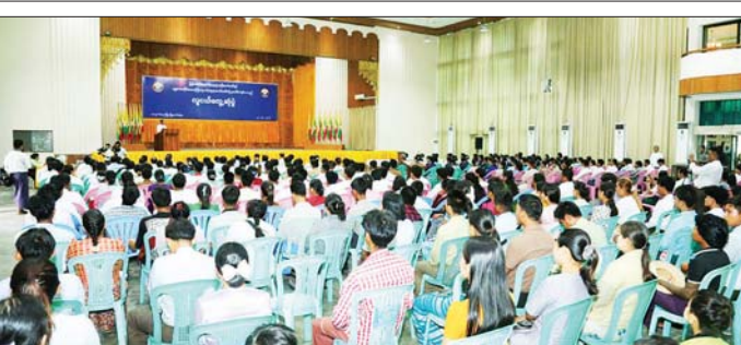
ထို့နောက် ပြည်ထောင်စု ပစ္စည်းများ ထောက်ပံ့ပေးအပ်ပြီး ပြန်လည်ရင်းလင်းဖြေကြားပေးခဲ့ ဝန်ကြီးက ကျောက်ဆည်မြို့မှ အလှူပေါင်းစုံမှ လူငယ်များက ကြောင်း သိရသည်။ တာဝန်ရှိသူများထံ အားကစား သိလိုသည်များကို မေးမြန်းကြရာ သတင်းစဉ်

ဒုတိယဥက္ကဋ္ဌ(၁)၊ ပြည်ထောင်စု ဝန်ကြီး ဒေါက်တာမောင်သင်း၊ မန္တလေးတိုင်းဒေသကြီး လူငယ် ရေးရာကော်မတီဥက္ကဋ္ဌ တိုင်း ဒေသကြီးဝန်ကြီးချုပ် ဦးမျိုးအောင်၊ မြန်မာနိုင်ငံ လူငယ်ရေးရာ လုပ်ငန်းကော်မတီဥက္ကဋ္ဌ၊ လူငယ် ရေးရာဝန်ကြီးဌာန ဒုတိယဝန်ကြီး ဦးစစ်နိုင်နှင့် တာဝန်ရှိသူများ၊ ကျောင်းသားလူငယ်များ၊ ကြက်ခြေနီ လူငယ်များ၊ အားကစားလူငယ် များ၊ ပရဟိတလူငယ်များနှင့် စွန့်ဦးတီထွင်လုပ်ငန်းရှင် လူငယ် များ တက်ရောက်ကြသည်။ ဦးစွာ မြန်မာနိုင်ငံ လူငယ် ရေးရာဗဟိုကော်မတီ ဒုတိယ ဥက္ကဋ္ဌ(၁)၊ လူငယ်ရေးရာဝန်ကြီး ဌာန ပြည်ထောင်စုဝန်ကြီးနှင့် မန္တလေးတိုင်းဒေသကြီး လူငယ် ရေးရာကော်မတီဥက္ကဋ္ဌ တိုင်းဒေသ ကြီး ဝန်ကြီးချုပ်က အမှာစကား ပြောကြားသည်။