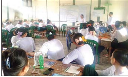
များမှ ဆရာ ဆရာမ စုစုပေါင်း လျက်ရှိကြောင်း သိရသည်။ အစာလင်း

ဒေးဒရဲ မေ ၂၁ ဒေးဒရဲမြို့နယ်၌ ရှေးဦးအရွယ် ကလေးသူငယ် ကလေးသူငယ် ပြုစုပျိုးထောင်ရေးနှင့် ဖွံ့ဖြိုးရေးဆိုင်ရာ မြို့နယ် ဆွေးနွေးပွဲကို မေ ၁၄ ရက်မှ အဆင့် (ဆင့်ပွား) ဆွေးနွေးပွဲ ၂၄ ရက်အထိ သင်တန်းနည်းပြ သင်တန်းကို ယမန်နေ့ နံနက်ပိုင်း ဆရာ ဆရာမ ရှစ်ဦးက သင်ကြား က အမှတ်(၁) အခြေခံပညာနှင့် ပို့ချပေးလျက်ရှိရာ ဒေးဒရဲမြို့နယ် စက်မှု၊ စိုက်ပျိုး၊ အထက်တန်း ကျောင်း၌ ဆက်လက်ပို့ချပေး လျက်ရှိကြောင်း သိရသည်။ အဆိုပါ မြို့နယ်အဆင့် ဆွေးနွေးပွဲကို မေ ၁၄ ရက်မှ ၂၄ ရက်အထိ သင်တန်းနည်းပြ ဆရာ ဆရာမ ရှစ်ဦးက သင်ကြား ပို့ချပေးလျက်ရှိရာ ဒေးဒရဲမြို့နယ် အတွင်းရှိ အခြေခံပညာကျောင်း