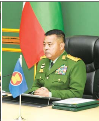
(၂၃) ကြိမ်မြောက် အာဆီယံတပ်မတော်ကာကွယ်ရေးဦးစီးချုပ်များအစည်းအဝေး (23 rd ASEAN Chiefs of Defence Forces Meeting- 23 rd ACDFM)သို့ တပ်မတော်ကာကွယ်ရေးဦးစီးချုပ် ဗိုလ်ချုပ်ကြီး ရဲဝင်းဦး ဦးဆောင်သည့် ကိုယ်စားလှယ်အဖွဲ့ တက်ရောက်စဉ်။