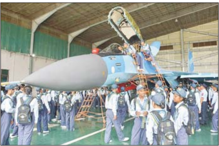
မွန်းမိုင်ခရီးအတွက် စုပေါင်းအလှူငွေများပေးအပ်လျှင်အားရာ တာဝန်ရှိ သူများကလက်ခံကြပြီး ဂုဏ်ပြုတံဆိပ်လွှာများ ပြန်လည်ပေးအပ်သည်။ ဆက်လက်ပြီး သင်တန်းသားများသည် စေတီတော်မြတ်ကြီး အရှေ့ ဘက်စောင်းတန်းရှိ ရတနာဆင်ဖြူတော်ထိန်းသိမ်းစောင့်ရှောက်ရေး ဥယျာဉ်(နေပြည်တော်)သို့ သွားရောက်ကာ ရတနာဆင်ဖြူတော်များအား လေ့လာခြင်းနှင့် ဘုရားစောင်းတန်းတစ်လျှောက်ရှိ အမှတ်တရစုစည်း အရောင်းဆိုင်များအား လှည့်လည်ကြည့်ရှုခြင်းများ ဆောင်ရွက်ခဲ့ကြ ကြောင်း သတင်းရရှိသည်။ သတင်းစဉ်

လေယာဉ်/ရဟတ်ယာဉ်အသီးသီး၏ Cockpit ခန်းများ၊ လေယာဉ် ကိုယ်ထည်ခန်းများ၊ Flight Instrument များ၊ Engine Instrument များအား ကြည့်ရှုလေ့လာခြင်းများ ဆောင်ရွက်ခဲ့ကြပြီး သက်ဆိုင်ရာ တာဝန်ရှိသူများက ရှင်းလင်းပြသကြသည်။ ထို့နောက် ပျံသန်းရေးအုပ် စုများရှိတာဝန်ရှိသူများကလေယာဉ်/ရဟတ်ယာဉ်အလိုက်စွမ်းကောင်းများ၊ ထမ်းဆောင်နိုင်သည့်လုပ်ငန်းတာဝန်များအား ရှင်းလင်းပြသကြသည်။ ဆက်လက်ပြီး သင်တန်းသားများသည် လေယာဉ် Simulator ခန်း သို့သွားရောက်ကာ တာဝန်ခံနည်းပြက Simulator မောင်းနှင်သည့် Procedure များ၊ Flight Instrument များ၏ လုပ်ဆောင်ပုံများကို လက်တွေ့ရှင်းလင်းသရုပ်ပြသခဲ့ပြီး သင်တန်းသားများက လေယာဉ် Simulator ဖြင့် လက်တွေ့မောင်းနှင်ပုံသန်းခြင်းများ ဆောင်ရွက်ကြသည်။ မွန်းလုံပိုင်းတွင် လေကြောင်းလူငယ်သင်တန်းသားများသည် ဥပျံတ သန္တရတော်မြတ်ကြီးအား သွားရောက်ဖူးမြော်ခဲ့ရာ တာဝန်ရှိသူ များက ဘုရားသမိုင်းကြောင်းနှင့်ပတ်သက်၍ ရှင်းလင်းပြောကြားသည်။ ထို့နောက် သင်တန်းသားများသည် လိုဏ်ဂူတော်အတွင်းရှိ ပုဂံတော်မူ ပြီးသော ကကုသိုဘုရား၊ ကောဇာဝိဘုရား၊ ကဿပဘုရားနှင့် ဂေါတမ ဘုရား ကျောက်စိမ်းဆင်းတုတော်ဆေးဆွနဲ့ သီရိလင်္ကာနှင့် တရုတ် နိုင်ငံတို့မှ ဗုဒ္ဓစွယ်တော်ပွား နှစ်ဆူအား ဖူးမြော်ကြည့်ညိကြသည်။ ယင်းနောက် သင်တန်းသားများက ထိုတော်မြတ်ကြီး ဘက်စုံပြုပြင်