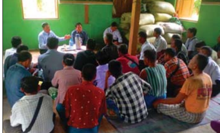
အဆိုပါ ကိုးအိမ်တန်းကျေးရွာ အုပ်စုတွင် သမဝါယမအသင်းသား ပိုင် လယ်မြေဧက ၂၅၂၆ ဧကရှိပြီး Gw-111 အောင်နိုင်တိုး၊ ဆင်းသု၊ အထွက်တိုးစပါးများနှင့် ပေါဆန်း ကြီးအုပ်စုစပါးများ စိုက်ပျိုးကြ ကြောင်း သိရသည်။