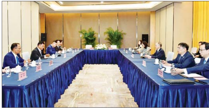
နိုင်ငံခြားလုပ်ငန်းရှင်များနှင့် စီးပွားရေးအသင်းအဖွဲ့များမှ ကိုယ်စားလှယ်များ တက်ရောက်ကြပြီး မြို့ပြများအကြောင်း မိတ်ဆက်ပြသကာ ချံချင့်မြို့၏ နိုင်ငံတကာချစ်ကြည်ရေးမြို့တော်များ၏ ပူးပေါင်းဆောင်ရွက်မှုဆိုင်ရာ အောင်မြင်မှုများကို ခင်းကျင်းပြသသည်။ မေ ၂၀ ရက် မွန်းလွဲပိုင်းတွင် ချံချင့်မြို့နယ်အစိုးရ နိုင်ငံခြားရေးဌာနတွင် ကျင်းပသည့် နိုင်ငံ