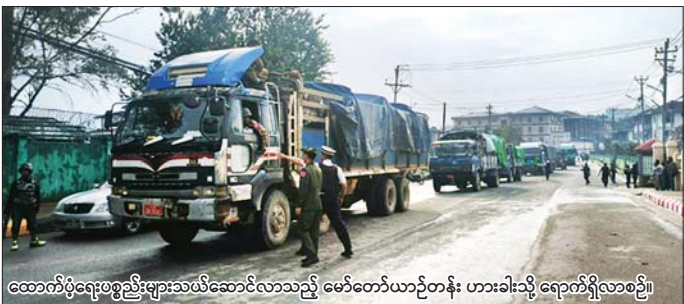
ထောက်ပံ့ရေးပစ္စည်းများသယ်ဆောင်လာသည့် မော်တော်ယာဉ်တန်း ဟားခါးသို့ ရောက်ရှိလာစဉ်။

နေပြည်တော် မေ ၂၀ တပ်မတော်အနေဖြင့် ပြည်သူလူထု အေးချမ်းစွာနေထိုင်နိုင်ရေးအတွက် အကြမ်းဖက်သောင်းကျန်းမှုများ ယာယီစိုးမိုးပြီး အကြမ်းဖက်လုပ်ရပ်များ လုပ်ဆောင်လျက်ရှိသည့်ဒေသများ၌ အကြမ်းဖက် ချေမှုန်းရေးစစ်ဆင်ရေး (Counter-Terrorism Operation) များကို ပြည်သူလူထု၏ ပူးပေါင်းပါဝင်မှုဖြင့် ဆောင်ရွက်၍ မြို့ရွာများအား အဆင့်ဆင့် ပြန်လည်သိမ်းပိုက်ပြီး အရေးပါသည့် ဆက်သွယ်ရေးလမ်းကြောင်းများအား ပြန်လည်ဖွင့်လှစ်ပေးခြင်း၊ အကြမ်းဖက်သောင်းကျန်းမှုကြောင့် ယာယီနေရပ်စွန့်ခွာခဲ့ရသည့် ဒေသခံပြည်သူများအနေဖြင့် ၎င်းတို့၏ နေရပ်သို့ ပြန်လည်ဝင်ရောက် နေထိုင်နိုင်ရေး၊ အစိုးရအုပ်ချုပ်မှုယန္တရားများ ပြန်လည်လုပ်ပတ်ကာ ဒေသခံပြည်သူလူထု၏ လူမှု၊ စီးပွားဘဝများ ဖွံ့ဖြိုးတိုးတက်အောင် ပြန်လည်ဖော်ဆောင်ပေးနိုင်ရေးစားသောက်