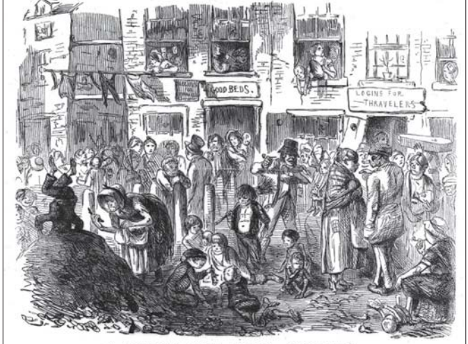
A COURT FOR KING CHOLERA.

ဤကာလတွင် မြန်မာ့စစ်ပယ်အဖွဲ့များ၏ တာဝန်သည် အခွန်ကောက်ရုံမျှသာ မဟုတ်တော့ဘဲ ပြည်သူ့ဝန်ဆောင်မှုပေးသည့်အထိ ကျယ်ပြန့်လာပါသည်။ မြို့ပြကျန်းမာရေးမြန်ဆန်စေရန် ရှိန်ထုထပ်သောလမ်းများကို ကျောက်ခင်းလမ်း၊ ကတ္တရာလမ်းများအဖြစ် ပြောင်းလဲခဲ့ပါသည်။ လမ်းမီးတိုင်များ ထွန်းညှိခြင်းဖြင့် လုံခြုံရေးနှင့် ညဘက်သွားလာမှု အဆင်ပြေစေရန် ဓာတ်ငွေ့မီးတိုင်များကို စာမူကန်နာ သ ဘုရိ