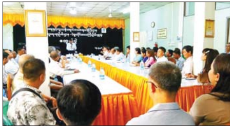
ရောင်းချပေးရန် ရှင်းလင်းဆွေးနွေးခဲ့ကြောင်း သိရသည်။ ခရိုင် (ပြန်/ဆက်)

ပဲခူး မေ ၂၁ ပဲခူးတိုင်းဒေသကြီးအတွင်း စားအုန်းဆီများ သတ်မှတ်ရည်ညွှန်းဈေးဖြင့် ရောင်းချနိုင်ရေးရှင်းလင်းဆွေးနွေးပွဲကို ယမန်နေ့က ပဲခူးတိုင်းဒေသကြီး စားသုံးဆီအဖွဲ့ဝင်များနှင့် ပူးတွဲအဖွဲ့ဝင်များ တွဲဖက်၍ ပဲခူးတိုင်းဒေသကြီး စားအုန်းဆီဖြန့်ဖြူးခြင်း လုပ်ငန်းကြီးကြပ်ရေးအဖွဲ့ဥက္ကဋ္ဌ တိုင်းဒေသကြီး စီမံကိန်း၊ စီးပွားရေးနှင့် ဘဏ္ဍာရေးဝန်ကြီး ဦးဇော်ဝင်းက စားသုံးဆီ တင်သွင်းသည့်လုပ်ငန်းကြီးကြပ်ရေးကော်မတီ၏ လမ်းညွှန်ချက်များအတိုင်း သတ်မှတ်ရည်ညွှန်းဈေးဖြင့် ရောင်းချနိုင်ရေး ရှင်းလင်းပြောကြားခဲ့ပြီး ပဲခူးတိုင်းဒေသကြီး စားအုန်းဆီဖြန့်ဖြူးခြင်း လုပ်ငန်းကြီးကြပ်ရေးအဖွဲ့ အတွင်းရေးမှူး စားသုံးဆီအဖွဲ့ဝင်များနှင့် တိုင်းဒေသကြီးဦးစီးမှူးက မှန်(၆)မှန်ဖြင့် ပြည်သူများထံသို့ ဖြန့်ဖြူး