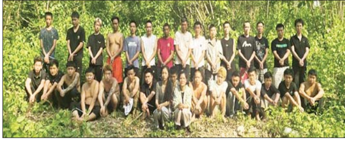
မိုင်းခတ်မြို့နယ်အတွင်း အွန်လိုင်းလိမ်လည်လောင်းကစားမှု ကျူးလွန်ခဲ့သည့် တရားမဝင် တရုတ်နိုင်ငံသား အမျိုးသား ၃၀၊ အမျိုးသမီး တစ်ဦးနှင့် မြန်မာနိုင်ငံသား အမျိုးသမီးတစ်ဦးအား တွေ့ရစဉ်။

သဖြင့် စုစုပေါင်းအမျိုးသား ၅၉ ဦး၊ အမျိုးသမီး ၂၆ ဦး၊ Star Link တစ်လုံး၊ ဖုန်းမျိုးစုံ ၂၆ လုံးတို့ကို ထပ်မံဖမ်းဆီးရမိခဲ့သည်။ အဆိုပါ အွန်လိုင်းလိမ်လည် လောင်းကစားမှုများ လုပ်ကိုင် လျက်ရှိသည့် ဖမ်းဆီးရမိသူများ အား လိုအပ်သည့် စစ်ဆေးမှုများ ဆောင်ရွက်ပြီးစီးပါက တည်ဆဲ ဥပဒေများနှင့်အညီ ထိရောက် ပြင်းထန်စွာ အရေးယူဆောင်ရွက် သွားမည်ဖြစ်ပြီး သိမ်းဆည်းရမိ သည့် လုပ်ငန်းသုံးပစ္စည်းများအား လုပ်ထုံး လုပ်နည်းများနှင့်အညီ ဆက်လက်ဆောင်ရွက်သွားမည် ဖြစ်ကြောင်း သိရှိရသည်။ နိုင်ငံတော်အနေဖြင့် အွန် လိုင်းလိမ်လည် လောင်းကစားမှု ကျူးလွန်ခြင်းများ ပပျောက်စေ ရေးနှင့် မြန်မာနိုင်ငံအတွင်း အခြေချလုပ်ကိုင်နိုင်မှု မရှိစေရေး အတွက် အိမ်နီးချင်းနိုင်ငံများ၊ ဒေသတွင်းနိုင်ငံများ၊ နိုင်ငံတကာ အဖွဲ့အစည်းများနှင့် ပူးပေါင်း၍ အွန်လိုင်းလိမ်လည်လောင်းကစား မှုတိုက်ဖျက်ရေးလုပ်ငန်းစဉ်များ ကို တက်ကြွစွာ ဆက်လက် ဆောင်ရွက်လျက် ရှိကြောင်း သတင်းရရှိသည်။