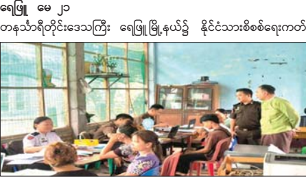
ရေဖြူ မေ ၂၀ တနင်္သာရီတိုင်းဒေသကြီး ရေဖြူမြို့နယ်၌ နိုင်ငံသားစိစစ်ရေးကတ်များနှင့် UID ကတ်များကို လူဝင်မှုကြီးကြပ်ရေးနှင့် ပြည်သူ့အင်အား ဝန်ကြီးဌာန မြို့နယ်ဦးစီးမှူးရုံး၌ မေ ၁၉ ရက် နံနက်ပိုင်းက ဆောင်ရွက်ပေးရာ အသက် ၁၀ နှစ် နှင့်အထက် နိုင်ငံသားစိစစ်ရေးကတ် အသစ် ပြုလုပ်ပေးခြင်း၊ အသက် ၁၈ နှစ်ပြည့်ပြီးသူများနှင့် ဟောင်းနွမ်းပျက်စီးခြင်းများကို အသစ်လဲလှယ်ပြုလုပ်ပေးခြင်း၊ ဇီဝဆိုင်ရာ အချက်အလက် ကောက်ယူခြင်း လုပ်ငန်းများဆောင်ရွက်ပေးရာ ကျေးရွာနေပြည်သူ ၁၅၉ ဦးအား မြို့နယ်စိစစ်ခန့်ခွဲရေးနှင့် အုပ်ချုပ်ရေးကော်မတီဥက္ကဋ္ဌ ဦးဇင်လင်းနိုင်နှင့် တာဝန် ရှိသူများက ပေးအပ်ခဲ့ကြောင်း သိရသည်။