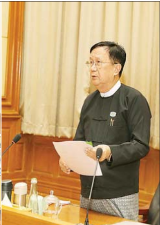
လွှတ်တော်အစည်းအဝေးများကျင်းပရေး ဗဟိုကော်မတီနာယက၊ ပြည်ထောင်စုလွှတ်တော်နာယက ဦးအောင်လင်းခွေး တတိယအကြိမ် ပြည်ထောင်စုအဆင့် လွှတ်တော်များ၏ ဒုတိယပုံမှန်အစည်းအဝေးများ အောင်မြင်စွာကျင်းပနိုင်ရေး လွှတ်တော်အစည်းအဝေးများကျင်းပရေး ဗဟိုကော်မတီနှင့် လုပ်ငန်းကော်မတီများ လုပ်ငန်းညှိနှိုင်းအစည်းအဝေး (၁/၂၀၂၆) တွင် အမှာစကားပြောကြားစဉ်။