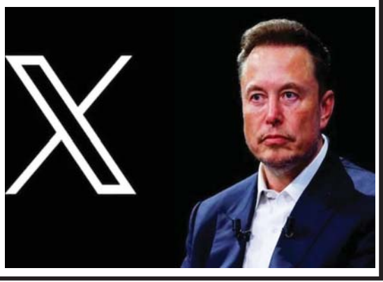
အင်န်အိတ်ချ်ကော

နည်းပညာ ကုမ္ပဏီကြီးများ အတွက် တာဝန်ခံမှုရှိစေရန် အဓိပ္ပာယ်ရှိ သည့် ပွင့်လင်းမြင်သာမှုသည် အရေးကြီး သည့်ဟု သြစတြေးလျနိုင်ငံ၏ အီလက် ထရောနစ် လုံခြုံရေးကော်မရှင်နာ ဂျူလီ အင်မန်းဂရန့်က ပြောသည်။ သြစတြေးလျနိုင်ငံသည် ပြီးခဲ့သည့် နှစ် နှောင်းပိုင်းမှစတင်ကာ အသက် ၁၆ နှစ်အောက် ကလေးငယ်များကို လူမှု ကွန်ရက်မီဒီယာအသုံးပြုခြင်း ပိတ်ပင် သည့် ပထမဆုံးနိုင်ငံ ဖြစ်လာခဲ့ သည်။