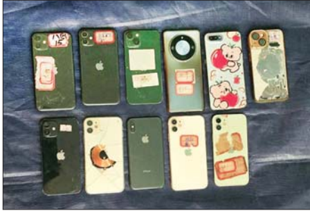
ဖမ်းဆီးရမိသော ဖုန်း ၁၁ လုံးအား တွေ့ရစဉ်။

စာမျက်နှာ ၁၂/၂ ခရီးသွားမော်တော်ယာဉ်များနှင့် ကုန်စည် သယ်ယူပို့ဆောင်ရေး မော်တော်ယာဉ်များ ပုံမှန်အတိုင်း သွားလာလျက်ရှိကြောင်း သိရ သည်။ နိုင်ငံတော်အစိုးရ အနေဖြင့် တိုင်းပြည်ဖွံ့ဖြိုးတိုးတက်ရေးနှင့် ပြည်သူ့လူထု၏ ပညာရည်မြှင့်မား ရေးများကိုအစဉ်တစိုက်ဖော်ဆောင် ပေးလျက်ရှိပြီး တပ်မတော်အနေ