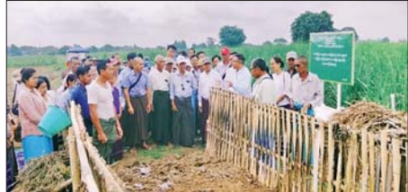
တိမ်အသင့်အတင့် ဖြစ်ထွန်းနေ သတင်းစဉ်

နေပြည်တော် မေ ၂၁ ကြိတ်တောင်သူများ ဓာတ်မြေဩဇာသုံးစွဲမှု လျှော့ချ၍ သဘာဝ မြေဩဇာနှင့် စနစ်တကျတွဲဖက်အသုံးပြုခြင်းဆိုင်ရာ တောင်သူ နည်းပညာပေးကွင်းသရုပ်ပြပွဲတွင် ယနေ့နံနက်ပိုင်းက ကြံ့သီးနံ့သုတေ သနနှင့် နည်းပညာဖွံ့ဖြိုးရေးခြံ(ပုဏ်းမနား)၌ ကျင်းပသည်။ နည်းပညာပေးကွင်းသရုပ်ပြပွဲတွင် တာဝန်ရှိသူများက ဓာတ်မြေ ဩဇာများကို အလွန်အကျွံသုံးစွဲခြင်းဖြင့် မြေဆီလွှာ၏ ရုပ်/ဓာတ်ဂုဏ် သတ္တိများ လျော့နည်းလာခြင်း၊ ကုန်ကျစရိတ်များခြင်း၊ ပတ်ဝန်းကျင် ထိခိုက်ညစ်ညမ်းမှုများ ရှိခြင်းတို့ကြောင့် ဓာတ်မြေဩဇာသုံးစွဲမှုကို လျှော့ချပြီး သဘာဝမြေဩဇာများပြုလုပ်ကာ စနစ်တကျတွဲဖက်အသုံးပြု ခြင်းဖြင့် ရရှိလာမည့်အကျိုးကျေးဇူးများ၊ သဘာဝမြေဩဇာနှင့် အနည်း လို အာဟာရဓာတ်များ၏ အရေးပါပုံတို့ကို ရှင်းလင်းပြောကြားကြပြီး ကြံ့ရွက်ခြောက်မြေဆွေးပုံပြုလုပ်နည်းကို လက်တွေ့ပြသကြရာ ကြံ့စိုက် တောင်သူများက စိတ်ပါဝင်စားစွာ လေ့လာခဲ့ကြကြောင်း သိရသည်။ သတင်းစဉ်