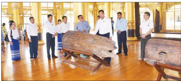
ကျေးကူးတံတားတည်ရှိခဲ့မှု သမိုင်းအထောက်အထား ကြောင်း သိရသည်။ များ ရှာဖွေလေ့လာဆောင်ရွက်ရန် မှာကြားခဲ့ သတင်းစဉ်

လက်ယာဝင်းဆောင်တွင် ပြသထားသော နန်းတော် ကျွန်းတိုင်များ၊ မုတ္တမစဉ်အိုးကြီးတို့ကို ကြည့်ရှု စစ်ဆေးသည်။ ယင်းနောက် ဟံသာဝတီမြို့ဟောင်း အရှေ့ဘက် မြို့ရိုး အင်းဝတံခါးမြို့ရိုးနှင့် ကျေးကြားနေရာများ တွင် ပြည်သူများ အနားယူအပန်းဖြေနိုင်ရန်နှင့် ယဉ်ကျေးမှုအမွေအနှစ်များကို ပြည်သူများ တွေ့မြင် သိရှိပြီး ဂုဏ်ယူမြတ်နိုး တန်ဖိုးထားတတ်စေရန် ရှင်းလင်းချက်များ ရေးသားထားရန် ဆွေးနွေးပြီး ဖော်ထုတ်ထိန်းသိမ်းထားသောနေရာများကို ကြည့်ရှု စစ်ဆေးသည်။ ဆက်လက်၍ မြောက်ဘက်မြို့ရိုး တံခါးပေါက်(၅) ပေါက်အနက် မုတ္တမတံခါးကို ကြည့်ရှုစစ်ဆေးပြီး