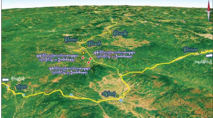
ရှမ်းပြည်နယ်(အရှေ့ပိုင်း) မိုင်းခတ်မြို့နယ် ဖားငင်ကျေးရွာအနီး၌ အွန်လိုင်းလိမ်လည်လောင်းကစားမှု ကျူးလွန်ခဲ့သူများနှင့် လုပ်ငန်းလုပ်ကိုင်ရာတွင် အသုံးပြုသည့်ဆက်စပ်ပစ္စည်းများ ဖမ်းဆီးရမိသည့် နေရာ များပြသ

အဖွဲ့များက နယ်မြေရှင်းလင်းရေး လုပ်ငန်းများ ဆောင်ရွက်ခဲ့ရာ ယနေ့နံနက် ၁၁ နာရီ ၁၅ မိနစ်ခန့် တွင် မိုင်းခတ်မြို့နယ် မိုင်းဟန် ကျေးရွာအုပ်စု ဖားငင်ကျေးရွာ၏ တောင်ဘက် မီတာ ၄၅၀၀ ခန့် အကွာတွင် အွန်လိုင်းလိမ်လည် လောင်းကစားမှု ကျူးလွန်သူ တရုတ်နိုင်ငံသား အမျိုးသား ၂၀ အား Star Link တစ်လုံး၊ ဖုန်းမျိုးစုံ ၁၅ လုံးနှင့်အတူ ဖမ်းဆီးရမိခဲ့ သည်။ ထို့ပြင် ၁၁ နာရီ မိနစ် ၅၀ ခန့် တွင် အဆိုပါကျေးရွာ၏ အရှေ့ တောင်ဘက် မီတာ ၅၀၀၀ ခန့် အကွာ၌ အွန်လိုင်းလိမ်လည် လောင်းကစားမှု ကျူးလွန်သူ မြန်မာနိုင်ငံသား အမျိုးသား ကိုးဦးနှင့် အမျိုးသမီး သုံးဦးတို့ကို