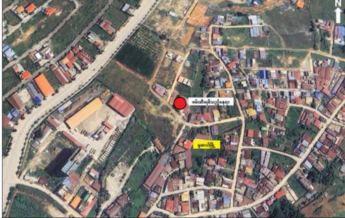
မူဆယ်မြို့အတွင်း အွန်လိုင်းလိမ်လည်လောင်းကစားမှု ကျူးလွန်ရာတွင် ပါဝင်ပတ်သက်သူ ၅၉ ဦးအား လုပ်ငန်းသုံးပစ္စည်းများနှင့်အတူ ဖမ်းဆီးရမိသည့် နေရာပြမြေပုံ။

နေပြည်တော် ဇွန် ၂၂ - မျိုးနွယ်အားလုံး၏ လူမှုဘဝများ ပေးလျက်ရှိသည့် အွန်လိုင်း နိုင်ငံတော်အစိုးရအနေဖြင့် အမျိုး ကို ထိခိုက်ပျက်စီးစေပြီး အများ လိမ်လည်မှုနှင့် အွန်လိုင်းလောင်း သားရေး တာဝန်တစ်ရပ်အဖြစ် ပြည်သူ့အကျိုးစီးပွားကို ထိခိုက် ကစားမှုတိုက်ဖျက်ရေး လုပ်ငန်းစဉ် ခံယူကာ ကမ္ဘာတစ်ဝန်းရှိ လူသား ပျက်စီးအောင် အလုံးစုံအန္တရာယ် စာမျက်နှာ ၁၅ ကော်လံ ၁ ❖