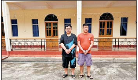
အွန်လိုင်းလိမ်လည်လောင်းကစားမှု ကျူးလွန်ရာတွင် ပါဝင်ပတ်သက်သည့် တရားမဝင် တရုတ်နိုင်ငံသားနှစ်ဦးနှင့် လုပ်ငန်းသုံးပစ္စည်းများအား တွေ့ရစဉ်။