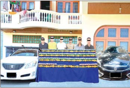
ဖြစ်မှုကျူးလွန်သူများအား သိမ်းဆည်းရမိသည့် မူးယစ်ဆေးဝါးများနှင့်အတူ တွေ့ရစဉ်။

ပစ္စည်းများကို ဖျက်ဆီးခဲ့ပါသည်။ ၂၀၂၅ ခုနှစ်အတွင်း နိုင်ငံတစ်ဝန်း မူးယစ်ဆေးဝါးနှင့် ဓာတ်ပစ္စည်း ဖမ်းဆီးရမိမှုများ ၂၀၂၅ ခုနှစ်အတွင်း နိုင်ငံတစ်ဝန်း၌ မူးယစ်ဆေးဝါးအမှုပေါင်း ၅၃၇၀ မှု တရားခံ ၇၉၂၂ ဦးတို့အား ငွေကျပ် ၁၇၆၁ ဒသမ ၃၂၄ ဘီလီယံတန်ဖိုးရှိ ဘီနမ် ၁ တန်ကျော်၊ ဘီနမ်ဖြူ ၂ ဒသမ ၁ တန်ကျော်၊ စိတ်ကြွေးသွပ်ဆေးပြား ၃၇၇ သန်းကျော်၊ အိုက်စီ (Ices) ၃၇ ဒသမ ၈ တန်ကျော်၊ ဘီနမ်စာမူနီ ၁ ဒသမ ၅ တန်ကျော်၊ Happy Water ၂၄၄ ကီလိုကျော်၊ ကက်တမင်း (Ketamine) ၁၅ တန်ကျော်အပါအဝင်