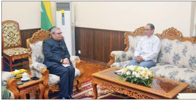
မြန်မာနှင့် ဘင်းမိစတက်အကြား ပူးပေါင်းဆောင်ရွက်မှု တိုးမြှင့်ရေးဆိုင်ရာ ကိစ္စရပ်များကို အမြင်ချင်းဖလှယ် ဆွေးနွေးကြသည်။ အတွင်းရေးမှူးချုပ်သည် ၂၀၂၄ ခုနှစ်၊ ဇူလိုင်လ