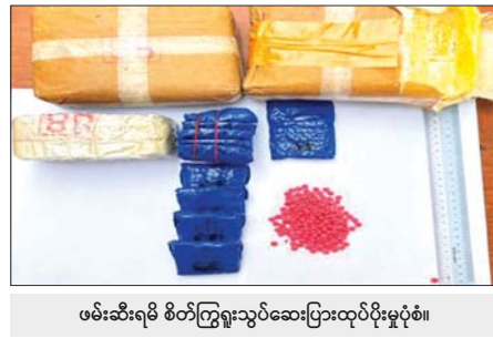
ဖမ်းဆီးရမိ စိတ်ကြွရွာသွပ်ဆေးပြားထုပ်ပိုးမှုပုံစံ။

ပရိကာဆာဓာတုပစ္စည်းများနှင့် စိန်ခေါ်မှု စိတ်ပြောင်းဆေးဝါးနှင့် မူးယစ်ဆေးဝါးထုတ်လုပ်ရာတွင် မရှိမဖြစ် လိုအပ်သည့် ပရိကာဆာဓာတုပစ္စည်းများ သယ်ဆောင်ရောင်းဝယ်မှု