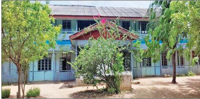
မကွေးတိုင်းဒေသကြီး ရေစကြိုမြို့နယ် ဖုလုံကျေးရွာရှိ အခြေခံပညာအထက်တန်းကျောင်း(ဖုလုံ)သို့ PDF အမည်ခံအကြမ်းဖက်သောင်းကျန်းသူများ Drop Bomb ချတိုက်ခိုက်ခဲ့၍ Drop Bomb ကျရောက်ပေါက်ကွဲခဲ့သည့် မှတ်တမ်းဓာတ်ပုံ။

PDF အမည်ခံအကြမ်းဖက်သမားများသည် ယခု ကဲ့သို့ စစ်ရေးနှင့်သက်ဆိုင်သော ပစ်မှတ်များမဟုတ်ဘဲ ကျောင်းသား ကျောင်းသူများ အေးချမ်းစွာပညာ သင်ကြားနေသည့် ပညာရေးဆိုင်ရာအဆောက်အအုံများကို ရည်ရွယ်ချက်ရှိရှိ တိုက်ခိုက်ခြင်းသည် ဂျီနီဗာ ကွန်ဗင်းရှင်းများနှင့် အပြည်ပြည်ဆိုင်ရာဥပဒေတို့အရ စစ်ရာဇဝတ်မှု ကျူးလွန်ခြင်းဖြစ်ပြီး အဆိုပါအကြမ်းဖက်လုပ်ရပ်အပေါ် ဒေသခံပြည်သူများက ပြင်းပြင်းထန်ထန် ကန့်ကွက်ရှုတ်ချလျက်ရှိကြောင်းနှင့် လုံခြုံရေးတပ်ဖွဲ့ဝင်များက လိုအပ်သည့် နယ်မြေလုံခြုံရေး လုပ်ငန်းများ တိုးမြှင့်ဆောင်ရွက်လျက်ရှိကြောင်း သတင်းရရှိသည်။