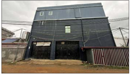
အွန်လိုင်းလိမ်လည်လောင်းကစားမှုကျူးလွန်ရာတွင် အသုံးပြုသည့် အဆောက်အအုံနှင့် လုပ်ငန်းလုပ်ကိုင်သည့်အခန်းအား တွေ့ရစဉ်။

ခဲ့သည်။ ထိုရောက်ပြင်းထန်စွာ အရေးယူဆောင်ရွက်သွားမည် အဆိုပါ အွန်လိုင်းလိမ်လည်လောင်းကစားမှုများ လုပ်ကိုင်လျက် ရှိသည့် ဖမ်းဆီးရမည့်သူများအား လိုအပ်သည့် စစ်ဆေးမှုများ ဆောင်ရွက်ပြီးစီးပါက တည်ဆဲဥပဒေများနှင့်အညီ ထိုရောက်ပြင်းထန်စွာ အရေးယူဆောင်ရွက်သွားမည်ဖြစ်ပြီး သိမ်းဆည်းရမည့် လုပ်ငန်းသုံးပစ္စည်းများကို လုပ်ထုံးလုပ်နည်းများနှင့်အညီ ဆက်လက်ဆောင်ရွက်သွားမည်ဖြစ်ကြောင်း သိရှိရသည်။ သတင်းစဉ်