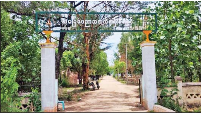
PDF အမည်ခံ အကြမ်းဖက်သောင်းကျန်းသူများ Drop Bomb ချ တိုက်ခိုက်ခဲ့သည့် မကွေးတိုင်းဒေသကြီး ရေစကြိုမြို့နယ် ဖူလုံကျေးရွာရှိ အခြေခံပညာအထက်တန်းကျောင်း(ဖူလုံ) ကို တွေ့ရစဉ်။

❖ နိုင်ငံတော်သာယာဖို သဘာဝပတ်ဝန်းကျင် ထိန်းကြစို့။