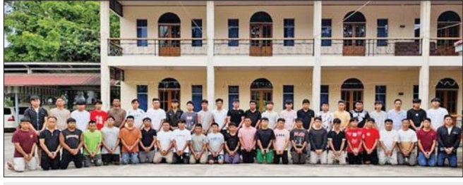
အွန်လိုင်းလိမ်လည်လောင်းကစားမှု ကျူးလွန်ရာတွင် ပါဝင်ပတ်သက်သည့် မြန်မာနိုင်ငံသား အမျိုးသား ၄၇ ဦးနှင့် အမျိုးသမီး ၁၀ ဦးတို့အား တွေ့ရစဉ်။