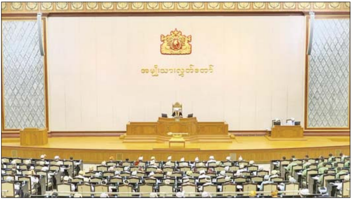
အခမား ပေးဆောင်နိုင်ရေးတို့ကို စီမံဆောင်ရွက် ထားရှိပြီးဖြစ်ပါကြောင်း။

အစည်းအဝေးတွင် အမျိုးသားလွှတ်တော်ဥက္ကဋ္ဌ ဦးအောင်လင်းဒွေးက တတိယအကြိမ် အမျိုးသား လွှတ်တော် ဒုတိယပုံမှန်အစည်းအဝေး နဝမနေ့သို့ တက်ရောက်ခွင့်ရှိသည့် အမျိုးသားလွှတ်တော် ကိုယ်စားလှယ်ဦးစီးချုပ် ဦးစိုးရီသည် အနက် ယနေ့အစည်းအဝေးသို့ ၂၀၆ ဦး တက်ရောက်သဖြင့် ထက်ဝက်ကျော်သည့်အတွက် အစည်းအဝေးအထ မြောက်ကြောင်းနှင့် စတင်ကျင်းပကြောင်း ကြေညာ ကာ အစည်းအဝေးတက်ရောက်မှုအခြေအနေကို လွှတ်တော်၏ အတည်ပြုချက်ရယူ၍ မှတ်တမ်းတင် သည်။