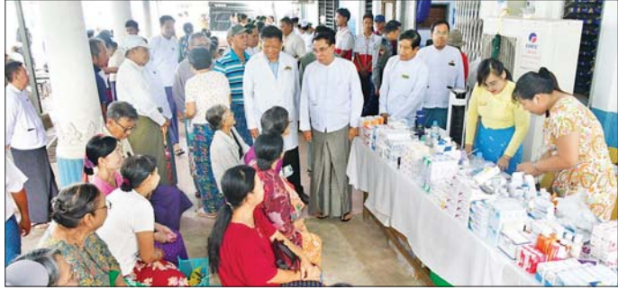
ပဲခူးမြို့၌ အငြိမ်းစားနိုင်ငံဝန်ထမ်းများ လစဉ်ကျန်းမာရေးစောင့်ရှောက်ပေးလျက်ရှိ

စစ်ဌာနချုပ်၌ ၂၂၉၇၉ ပင်၊ အရှေ့တောင်တိုင်းစစ်ဌာနချုပ်၌ ၁၄၅၈၃ ပင်၊ ကမ်းရိုးတန်းဒေသတိုင်းစစ်ဌာနချုပ်၌ ၁၄၅၈၃ ပင်၊ ရန်ကုန်တိုင်းစစ်ဌာနချုပ်၌ ၄၉၀၇၃ ပင်၊ အနောက်တောင်တိုင်းစစ်ဌာနချုပ်၌ ၉၁၃၃ ပင်၊ အနောက်ပိုင်းတိုင်းစစ်ဌာနချုပ်၌ အပင် ၁၁၃၀၊ အနောက်မြောက်တိုင်းစစ်ဌာနချုပ်၌ အပင် ၇၁၂၊ အလယ်ပိုင်းတိုင်းစစ်ဌာနချုပ်၌ ၄၇၉၈၇ ပင်နှင့် တောင်ပိုင်းတိုင်းစစ်ဌာနချုပ်၌ ၁၂၈၆၁ ပင်တို့ကို တိုင်းမှူးများနှင့် တာဝန်ရှိသူများ၊ အရာရှိ၊ စစ်သည် မိသားစုများက စုပေါင်းစိုက်ပျိုးခဲ့ကြပြီး တပ်မတော်တစ်ရပ်လုံးအနေဖြင့် ယနေ့တွင် စုစုပေါင်းသစ်ပင် ၂၃၅၆၇၄ ပင်ကို စိုက်ပျိုးခဲ့ကြောင်း သတင်းရရှိသည်။ သတင်းစဉ်