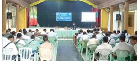
ရက် ၂၆ ရက်အထိ ငါးရက်ကြာ ဖွင့်လှစ်သွားမည်ဖြစ်ကြောင်း သိရသည်။

ဒိုက်ဦး ဇွန် ၂၂ ကျင်းပရာ မြို့နယ်စီမံခန့်ခွဲရေးနှင့် ပဲခူးတိုင်းဒေသကြီး ဒိုက်ဦး အုပ်ချုပ်ရေးကော်မတီ ခေတ္တမြို့နယ်တွင် ရပ်ကွက်/ကျေးရွာ အုပ်စုအုပ်ချုပ်ရေးမှူးများအတွက် ဥပဒေအသိပညာ ပြန့်ပွားရေး ဆရာဖြစ်သင်တန်းကို ယနေ့ ရက်နံပါတ်ဒုံးက မြို့နယ်အထွေထွေ အုပ်ချုပ်ရေးအစည်းအဝေးခန်းမ၌ ကျင်းပသင်တန်းကို ဇွန် ၂၂