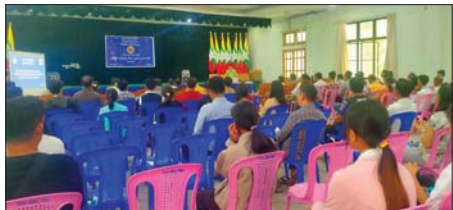
များကို ရှင်းလင်းဆွေးနွေးရာ ဆွေးနွေးပွဲသို့ ညွှန်ကြားရေးမှူးမှ တာဝန်ရှိသူများနှင့် အခွန်ထမ်းလုပ်ငန်းရှင် စုစုပေါင်း ၁၀၀ ခန့် တက်ရောက်ကြသည်။ တင်ဖူးခိုင်(ပြန်/ဆက်)

နေပြည်တော် ဇွန် ၂၃ နေပြည်တော် ဇမ္ဗူသီရိမြို့နယ် အထွေထွေအုပ်ချုပ်ရေးဦးစီးဌာန အစည်းအဝေးခန်းမ၌ ဇမ္ဗူသီရိမြို့နယ်အတွင်းရှိ လုပ်ငန်းရှင်များအား အခွန်ဆိုင်ရာ အသိပညာပေးရှင်းလင်းဆွေးနွေးပွဲကို ယမန်နေ့က ကျင်းပရာ မြို့နယ်စီမံခန့်ခွဲရေးနှင့် အုပ်ချုပ်ရေးကော်မတီဥက္ကဋ္ဌ ဦးဇေနော်ဝင်းက အမှာစကားပြောကြားသည်။ ထို့နောက် ပြည်ထောင်စုနယ်မြေ အခွန်ဦးစီးဌာနမှူးရုံးမှ ဒုတိယ ညွှန်ကြားရေးမှူးက အခွန်ဆိုင်ရာ အသိပညာတိုးတက်ရေး၊ အခွန် တာဝန်ခေးစားလိုက်နာမှု တိုးတက်ရေးနှင့် အခွန်ဆိုင်ရာ ပြဋ္ဌာန်းချက်