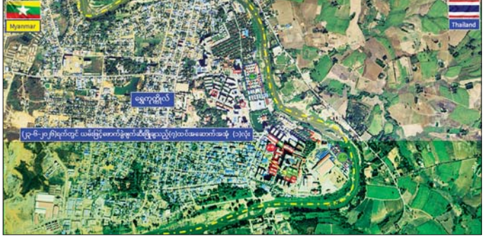
ကရင်ပြည်နယ် မြဝတီမြို့နယ် ရွှေကုက္ကိုလ်နယ်မြေရှိ အွန်လိုင်းလိမ်လည်လောင်းကစားမှုများလုပ်ကိုင်ခဲ့သည့် တရားမဝင်အဆောက်အအုံများအား ဖောက်ခွဲဖျက်ဆီးမှုပြု မြေပုံ။

* ကျောပိုးမှ ရွှေကုက္ကိုလ်နယ်မြေအတွင်း၌ အွန်လိုင်းလိမ်လည်လောင်းကစားလုပ်ငန်းများ ကျူးလွန်ရာတွင် အသုံးပြုခဲ့သည့် အဆောက်အအုံ ၂၀ အနက် ၇၇ လုံးအနက် ယာဉ်ယန္တရားများဖြင့် ဖြိုဖျက်ဆီးမည့် အဆောက်အအုံ ၅၇ လုံးနှင့် ဖောက်ခွဲ၍ ဖျက်ဆီးမည့် အဆောက်အအုံ အလုံး ၂၀ ဟူ၍ အဆောက်အအုံ အမျိုးအစားအလိုက် ခွဲခြားသတ်မှတ်ပြီး စနစ်တကျ ဖြိုဖျက်ဆီးလျက်ရှိရာ ယနေ့တွင် ဖောက်ခွဲ၍ ဖြိုဖျက်ဆီးရန် သတ်မှတ်ထားသည့် အဆောက်အအုံ အလုံး ၂၀ အနက် ခုနစ်ထပ် လူနေအဆောက်အအုံ တစ်လုံးကို စနစ်တကျ ထပ်မံဖောက်ခွဲဖျက်ဆီးခဲ့ကြောင်း သိရသည်။ ၆၃ လုံး ဖြိုဖျက်ဆီးပြီး ၄၁ နှစ်ဆိုင်ရာပူးပေါင်းအဖွဲ့များ အနေဖြင့် ယနေ့အထိ အွန်လိုင်း လိမ်လည်လောင်းကစားလုပ်ငန်းများ ကျူးလွန်ရာတွင် အသုံးပြုခဲ့သည့် တရားမဝင်အဆောက်အအုံ စုစုပေါင်း ၆၃ လုံးအား စနစ်တကျ ဖြိုဖျက်ဆီးပြီးဖြစ်ကြောင်းနှင့် ဖျက်ဆီးရန်ကျန်ရှိသည့် တရားမဝင်အဆောက်အအုံ ၁၄ လုံးကိုလည်း ဆက်လက်၍ စနစ်တကျ ဖျက်ဆီးသွားမည် ဖြစ်ကြောင်း သတင်းရရှိသည်။ သတင်းစဉ်