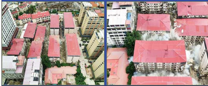
ကရင်ပြည်နယ်၊ မြဝတီခရိုင် ရွှေကုက္ကိုလ်နယ်မြေရှိ အွန်လိုင်းလိမ်လည်လောင်းကစားမှု လုပ်ကိုင်ခဲ့သည့် တရားမဝင် (၇)ထပ်လူနေအဆောက်အအုံအား ယမ်းဖြင့်ဖောက်ခွဲဖြိုချဖျက်ဆီးစဉ်