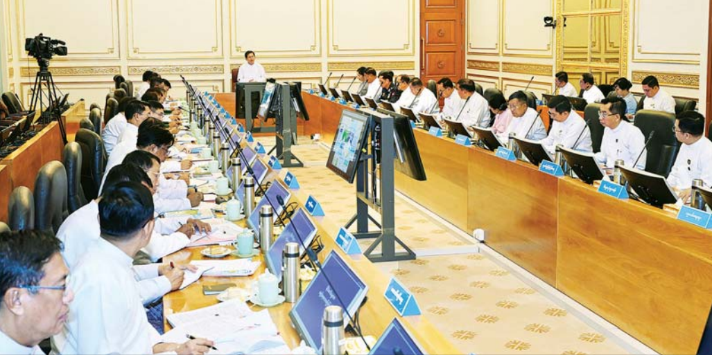
နိုင်ငံတော်သမ္မတ ဦးမင်းအောင်လှိုင် ပြည်ထောင်စုအစိုးရအဖွဲ့အစည်းအဝေးတွင် အမှာစကားပြောကြားစဉ်။

နေပြည်တော် ဇွန် ၂၃ ပြည်ထောင်စုသမ္မတ မြန်မာနိုင်ငံတော် ပြည်ထောင်စုအစိုးရအဖွဲ့အစည်းအဝေးကို ယနေ့ မွန်းလွဲပိုင်းတွင် နေပြည်တော်ရှိ နိုင်ငံတော်သမ္မတ ရုံးတော် ပြည်ထောင်စုအစိုးရအဖွဲ့ အစည်းအဝေး ခန်းမ၌ ကျင်းပပြုလုပ်ရာ နိုင်ငံတော်သမ္မတ ဦးမင်းအောင်လှိုင် တက်ရောက်အမှာစကား ပြောကြားသည်။ အစည်းအဝေးသို့ ဒုတိယသမ္မတများဖြစ်ကြသည့် ဦးညိုစောနှင့် ဒေါ်နန်းနီနီအေး၊ ပြည်ထောင်စုဝန်ကြီး များနှင့် နေပြည်တော်ကောင်စီဥက္ကဋ္ဌတို့ တက်ရောက် ကြပြီး တိုင်းဒေသကြီးနှင့် ပြည်နယ်ဝန်ကြီးချုပ်များက Video Conferencing ဖြင့် တက်ရောက်ကြသည်။ တိုင်းပြည်သာယာဝပြောရေးအတွက် အားလုံးပူးပေါင်းအကောင်အထည်ဖော် ဦးစွာနိုင်ငံတော်သမ္မတက အဖွင့်အမှာစကား ပြောကြားရာတွင် တိုင်းပြည်သာယာဝပြောရေး အတွက် နိုင်ငံတော်အစိုးရမှ တာဝန်ယူဆောင်ရွက် ရခြင်းဖြစ်ပြီး တိုင်းဒေသကြီးနှင့် ပြည်နယ်များ စာမျက်နှာ ၃ ကော်လံ ၁ ဇ