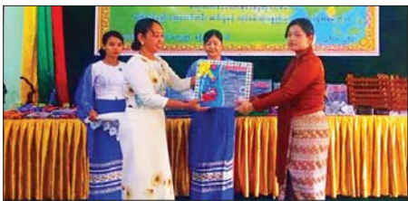
ဝန်ကြီး ဦးလှမျိုးက အမှာစကား အသေးစားစက်မှုလက်မှုလုပ်ငန်း ပြောကြားပြီး တိုင်းဒေသကြီး ဦးစီးဌာနမှ ညွှန်ကြားရေးမှူးက

စဉ့်ကိုင် ဇွန် ၂၃ မန္တလေးတိုင်းဒေသကြီး အသေးစား စက်မှုလက်မှုလုပ်ငန်းဦးစီးဌာနမှ အခြေခံနှင့် မွမ်းမံစက်ချုပ်နည်းပညာ သင်တန်းဆင်းပွဲနှင့် လုပ်ငန်းသုံးပစ္စည်းများ ပေးအပ်ပွဲကို ဇွန် ၂၀ ရက်က စဉ့်ကိုင်မြို့နယ် တောင်ဦးကျေးရွာရွာမှာ၌ ကျင်းပရာ တိုင်းဒေသကြီး စိုက်ပျိုးရေး၊ မွေးမြူရေးနှင့် ဆည်မြောင်း