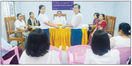
ယင်းနောက် စုဆောင်းငွေပေါ်အတိုးနှင့် အစုရှယ်ယာအမြတ်ငွေများကို အသင်းသားများအား ခွဲဝေပေးအပ်ခဲ့ကြောင်း သိရသည်။

ရန်ကုန် ဇွန် ၂၃ ရန်ကုန်တိုင်းဒေသကြီး ဗဟန်းမြို့နယ် မြန်မာ့အလင်းသတင်းစာတိုက် မြို့နယ်သမဝါယမဦးစီးအသင်းလိမ္မိတက်၏ ၂၀၂၅ -၂၀၂၆ ဘဏ္ဍာနှစ် နှစ်ပတ်လည်အရပ်ရပ်ဆိုင်ရာအစည်းအဝေးကို ယနေ့နံနက် ၉ နာရီတွင် တတိယအကြိမ် တနင်္သာရီတိုင်းဒေသကြီးလွှတ်တော် ဒုတိယဥက္ကဋ္ဌ မန်နေဂျာဦးစော်မင်းက အမှာစကားပြောကြားသည်။ ထို့နောက် ဒါရိုက်တာအဖွဲ့အစည်းဝင်များက တတိယအကြိမ် တနင်္သာရီတိုင်းဒေသကြီးလွှတ်တော် ဒုတိယဥက္ကဋ္ဌ မန်နေဂျာဦးစော်မင်းက အမှာစကားပြောကြားသည်။ ထို့နောက် ဒါရိုက်တာအဖွဲ့အစည်းဝင်များက တတိယအကြိမ် တနင်္သာရီတိုင်းဒေသကြီးလွှတ်တော် ဒုတိယဥက္ကဋ္ဌ မန်နေဂျာဦးစော်မင်းက အမှာစကားပြောကြားသည်။