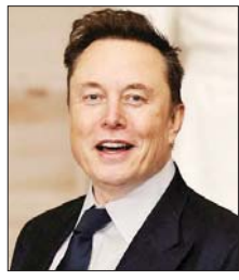
ပထမဆုံး ထရီလီယံနာ ဖြစ်လာခဲ့ သည့် အီလွန်မတ်စ်

များကို ထိန်းချုပ်ရန် စီစဉ်ထား သည့်ဆိုသော ဒုတိယသမ္မတ ဂျေဒီဗစ်၏ ပြောကြားချက် အပေါ် တုံ့ပြန်ပြောဆိုခြင်းဖြစ် သည်။