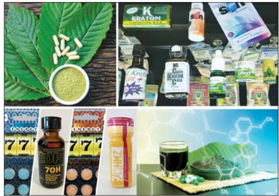
ဆေးခြောက်ဘလောက်တုံးနှင့် ဆေးခြောက်ထုတ်ကုန်ပစ္စည်းများ။