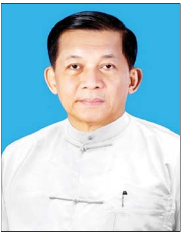
ပေါင်းစုံတွင် ပူးပေါင်းဆောင်ရွက်မှုဆိုင်ရာ ကိစ္စရပ်များကို ရင်းနှီးပွင့်လင်းစွာ အမြင်ချင်းဖလှယ် ဆွေးနွေး သွားမည်ဖြစ်သည်။

နေပြည်တော် ဇွန် ၃၀ ပြည်ထောင်စုသမ္မတမြန်မာနိုင်ငံတော် နိုင်ငံတော် သမ္မတ ဦးမင်းအောင်လှိုင်နှင့် ဇနီး ဒေါ်ကြူကြူလှ တို့သည် လာအိုပြည်သူ့ဒီမိုကရက်တစ်သမ္မတနိုင်ငံ သမ္မတ မစ္စတာ ထောင်လွန်း ဆီဆုလစ်၏ ဖိတ်ကြားချက်အရ လာအိုပြည်သူ့ဒီမိုကရက်တစ်သမ္မတနိုင်ငံသို့ နိုင်ငံတော်အဆင့် ချစ်ကြည်ရေးခရီးစဉ် (State Visit) သွားရောက်မည်ဖြစ်သည်။ ခရီးစဉ်အတွင်း နိုင်ငံတော်သမ္မတသည် လာအိုနိုင်ငံသမ္မတနှင့်တွေ့ဆုံ၍ နှစ်နိုင်ငံဆွေးနွေးပွဲ ကျင်းပ ပြုလုပ်ခြင်းနှင့် လာအိုနိုင်ငံဝန်ကြီးချုပ်၊ လာအိုနိုင်ငံ အမျိုးသားလွှတ်တော်ဥက္ကဋ္ဌတို့နှင့် တွေ့ဆုံခြင်းတို့အပြင် ပြည်နယ်အကြီးအကဲကိုလည်း လက်ခံတွေ့ဆုံ သွားမည်ဖြစ်သည်။ ထို့အပြင် လာအိုနိုင်ငံရှိ အထက်ကရနေရာများနှင့် ရှေးဟောင်းတရားများကို လေ့လာဖွဲ့စည်းသွားမည် ဖြစ်သည်။ ခရီးစဉ်အတွင်း မြန်မာ-လာအို နှစ်နိုင်ငံ အကြား ရှိရင်းစွဲချစ်ကြည်ရေးနှိုးဆော် ဆက်ဆံရေးကို ပိုမိုခိုင်မာလာစေရေး ကိစ္စရပ်များ၊ နှစ်နိုင်ငံအစိုးရနှင့် ပြည်သူများအကြား စီးပွားရေး၊ ယဉ်ကျေးမှုနှင့် ကဏ္ဍ