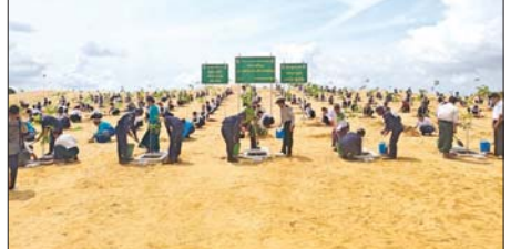
ဥပဒေပြုကြမ်းပြင် မိုးရာသီ သစ်ပင်စိုက်ပျိုးပွဲကို ဇွန် ၂၈ ရက်က မှော်ဘီကျေးရွာ မြစ်တရားကြီးပိုင်း အကျက်အမှတ် (၁၇၃) ၌ ကျင်းပရာ ဌာနဆိုင်ရာများနှင့် ဒေသခံပြည်သူများက ပျိုးပင် ၁၀၀၀ ကို စုပေါင်းစိုက်ပျိုးစဉ်။