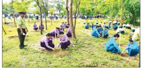
ဂန့်ဂေါမြို့ ကျောက်တိုက်ရပ်ကွက်ရှိ အခြေခံပညာ အထက်တန်းကျောင်း (ဂန့်ဂေါ)၌ မိုးရာသီသစ်ပင်စိုက်ပျိုးပွဲကို ဇွန် ၂၅ ရက်က ကျင်းပရာ ဆရာ ဆရာမများ၊ ကျောင်းသား ကျောင်းသူများက ပျိုးပင် ၁၇၅ ပင်ကို စုပေါင်းစိုက်ပျိုးစဉ်။ မောင်မျိုးမင်း(ပြန်/ဆက်)