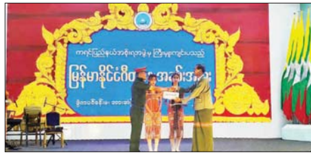
စတူဒီယိုပြိုင်ပွဲတွင် ဆုရရှိသူများကို ဆုများပေးအပ်ချီးမြှင့်ခဲ့ကြောင်း သိရသည်။