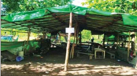
တပ်မတော်စစ်ကြောင်းများက ကျွန်းတောရေရှင်ကျေးရွာအနီးရှိ အကြမ်းဖက်သောင်းကျန်းသူများ၏ စခန်းအား သိမ်းပိုက်ရရှိခဲ့မှုကို တွေ့ရစဉ်။

များအတွင်းနှင့် လမ်းမများပေါ် တွင် မိုင်းများထောင်ထား၍ လည်းကောင်း၊ မြောင်းများအတွင်း ခံစစ်ကျင်းများ တူးဖော်၍ လည်း ကောင်း အခိုင်အမာခံစစ်ဆင်၍ စစ်စခန်းများအဖြစ် အသုံးချထား သည်ကို တွေ့ရှိရသည်။