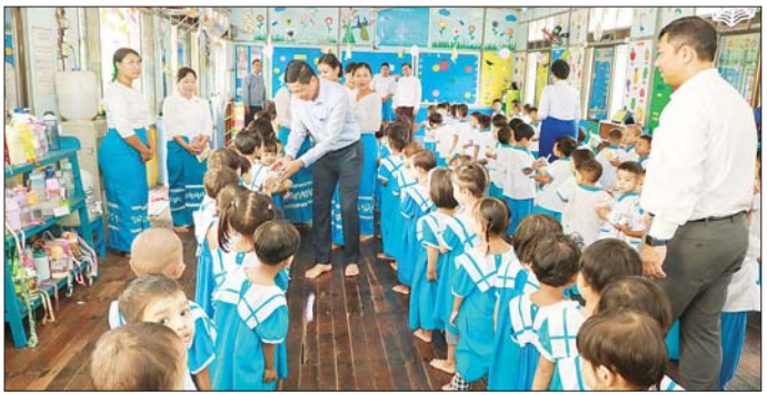
ထောက်ပံ့ပစ္စည်း သိုလှောင်ထားရှိမှုနှင့် ခေတ္တရာမြေ ပြီး လိုအပ်သည်များကို မှာကြားဖြည့်ဆည်းဆောင်ရွက်မသန်စွမ်းကလေးများ ပြုစုပေးဆောင်ရေးစင်တာ၌ ပေးခဲ့ကြောင်း သိရသည်။ ကလေးများအား ပြုစုလေ့ကျင့်ပေးနေမှုကို ကြည့်ရှု သတင်းစဉ်

ယင်းနောက် ဘေးအန္တရာယ်ဆိုင်ရာ စီမံခန့်ခွဲမှုဦးစီးဌာန ပြည်ခရိုင်ဦးစီးမှူးရုံးနှင့် သိုလှောင်ရုံ၌ ပြည်ခရိုင်အတွင်းရှိ လူမှုဝန်ထမ်းဦးစီးဌာနနှင့် ဘေးအန္တရာယ်ဆိုင်ရာ စီမံခန့်ခွဲမှုဦးစီးဌာနတို့မှ ဝန်ထမ်းများနှင့် တွေ့ဆုံအမှာစကားပြောကြားပြီး ကယ်ဆယ်