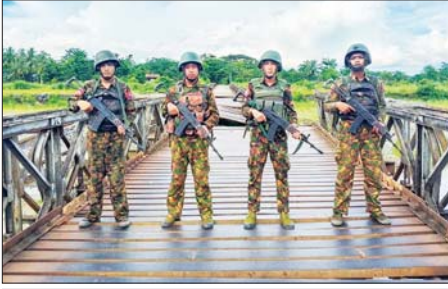
တပ်မတော်စစ်ကြောင်းများက အကြမ်းဖက်သမားများ ယာယီစိုးရိမ်ထားသည့် ကနန်ကျေးရွာအား ပြန်လည်သိမ်းပိုက်ရရှိခဲ့မှုကို တွေ့ရစဉ်။

အကြမ်းဖက်သောင်းကျန်းသူ များအနေဖြင့် ကနန်ကျေးရွာအား ယာယီစိုးရိမ်ထားစဉ် ဒေသခံပြည်သူ လူထု၏ ကိုယ်ကျိုးစီးပွားကို မငဲ့ကွက်ဘဲ ကျေးရွာရှိ ပြည်သူများ