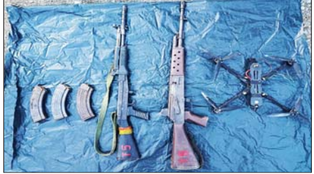
ကနန်ရွာ ရှင်းလင်းစဉ် အကြမ်းဖက်သမားများထံမှ သိမ်းဆည်းရရှိ သည့် လက်နက်/သမားများနှင့် ဆက်စပ်ပစ္စည်းများအား တွေ့ရစဉ်။