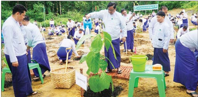
စက်မှုနှင့် အသေးစား၊ အငယ်စား၊ အလတ်စားနှင့် စီးပွားရေးလုပ်ငန်းများ ဖွံ့ဖြိုးတိုးတက်ရေး ဝန်ကြီးဌာန၏ ၂၀၂၆ ခုနှစ် မိုးရာသီ သစ်ပင်စိုက်ပျိုးပွဲကျင်းပ

နေပြည်တော် ဇွန် ၃၀ စက်မှုနှင့် အသေးစား၊ အငယ်စား၊ အလတ်စားနှင့် စီးပွားရေးလုပ်ငန်းများဖွံ့ဖြိုးတိုးတက်ရေး ဝန်ကြီးဌာန၏ ၂၀၂၆ ခုနှစ် မိုးရာသီ သစ်ပင်စိုက်ပျိုးပွဲကို ယနေ့နံနက် ၉ ဝာတွင် နေပြည်တော် ရုံးအမှတ် (၃) ရှိ လျှို့ဝှက်ဆည်အမှတ် (၉) ၌ ကျင်းပရာ စက်မှုနှင့် အသေးစား၊ အငယ်စား၊ အလတ်စားနှင့် စီးပွားရေးလုပ်ငန်းများ ဖွံ့ဖြိုးတိုးတက်ရေးဝန်ကြီးဌာန ပြည်ထောင်စု ဝန်ကြီး ဒေါက်တာချာလီသန်း၊ ဒုတိယဝန်ကြီး ဦးသွင်အောင်နှင့် ဒေါက်တာအောင်ဇေယျာ ညွှန်ကြားရေးမှူးချုပ်များ ဦးဆောင်ညွှန်ကြားရေးမှူးများနှင့် ဝန်ထမ်းများ တက်ရောက်သည်။ စုပေါင်းသစ်ပင်စိုက်ပျိုးဦးစွာ ပြည်ထောင်စုဝန်ကြီးက အမှာစကားပြောကြားပြီး ရတနာတန်းဝင် ကျွန်းပင်ကို ဦးဆောင်စိုက်ပျိုးပေးကာ တာဝန်ရှိသူများနှင့်အတူ ဦးစီးဌာန/စက်မှုလုပ်ငန်းများမှ အရာထမ်း၊ အမှုထမ်းများက သတ်မှတ်နေရာအသီးသီး၌ စုပေါင်း သစ်ပင်စိုက်ပျိုးနေမှုကို လိုက်လံကြည့်ရှုအားပေးသည်။ စက်မှုနှင့် အသေးစား၊ အငယ်စား၊ အလတ်စားနှင့် စီးပွားရေးလုပ်ငန်းများ ဖွံ့ဖြိုးတိုးတက်ရေး ဝန်ကြီးဌာနအနေဖြင့် ၂၀၂၆ ခုနှစ် မိုးရာသီ သစ်ပင်စိုက်ပျိုးပွဲတွင် ရတနာတန်းဝင် ကျွန်းပင်တောက်၊ ပျဉ်းကတီး၊ မဟော်ဂနီ၊ လူကလစ်၊ ပျဉ်းမ၊ မန်ဂျန်ရုံး၊ စိန်ပန်း၊ ခရေသပြေငှက်ကော်၊ သပြေဘွားပေါက်ပန်းဖြူ၊ ချယ်ရီပင် စသည့်အပင်မျိုးအစား ၃၅ မျိုးစုစုပေါင်း ၆၇၅၁ ပင်တို့ကို စိုက်ပျိုးခဲ့ကြောင်း သိရသည်။ သတင်းစဉ်