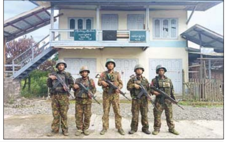
တပ်မတော်စစ်ကြောင်းများက အကြမ်းဖက်သမားများ ယာယီစိုးရိမ်ထားသည့် ကနန်ကျေးရွာအား ပြန်လည်သိမ်းပိုက်ရရှိခဲ့မှုကို တွေ့ရစဉ်။