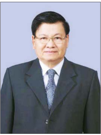
အဆိုပါခရီးစဉ်တွင် နိုင်ငံတော်သမ္မတနှင့် ဇနီးနှင့်အတူ ပြည်ထောင်စုဝန်ကြီးများ၊ တာဝန်ရှိပုဂ္ဂိုလ်များ လိုက်ပါသွားမည်ဖြစ်သည်။ သတင်းစဉ်