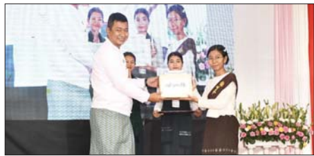
တောင်ငူမြို့ KMA ကေတုမတီဟိုတယ် တွင် နေထိုင်ခန်းမ၌ ရွှေဆံ တော် မရမ်းကျောင်းဆရာတော်ကြီးနှင့် သီတဂူကေတုမတီ ဗုဒ္ဓ တက္ကသိုလ် ကျောင်းအုပ်ဆရာတော် အရှင်တိက္ခာသာရာတို့ ဦးဆောင် ၍ ဆန္ဒမအကြိမ် ကေတုမတီပုဂံယုဉ်ပြိုင်ပွဲစေတီပွဲ(စင်တင်)ကို ဇွန် ၂၀ ရက်မှစတင်၍ ကျင်းပရာ ဇွန် ၂၁ ရက် ညနေပိုင်းတွင် ဆုရရှိသူများ အား ဆုများပေးအပ်ချီးမြှင့်စဉ်။ ဇော်ကို (တောင်ငူ)

ဖြင့်တင်ရေးရန်ပုံငွေ ကြီးကြပ်မှု ကော်မတီ အတွင်းရေးမှူးက စိုက်ပျိုးနည်းစနစ် မှန်ကန်ရေး၊ မျိုးကောင်းမျိုးသန့်များ စိုက်ပျိုး နိုင်ရေးနှင့် ဓာတ်မြေဩဇာ စနစ် တကျအသုံးပြုနိုင်ရေး အသိ ပညာပေး ရှင်းလင်းပြောကြား ပြီး တာဝန်ရှိသူများက မိုးစပါး စိုက် တောင်သူများထံ သွင်းအား စုများကို ပေးအပ်ခဲ့ကြောင်း သိရသည်။ မြို့နယ်(ပြန်/ဆက်)