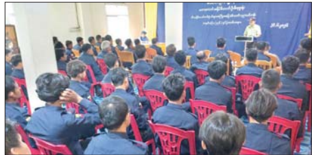
က သီးသန့်မီးသတ်တပ်ဖွဲ့ဝင်များအား အခြေခံမီးသတ်ပညာများ လေ့ကျင့်သင်ကြားပို့ချခဲ့ပြီး နှစ်ပတ်ကြာ ဖွင့်လှစ်သင်ကြားပေးမည်ဖြစ် ကြောင်း သိရသည်။ ခရိုင်(ပြန်/ဆက်)