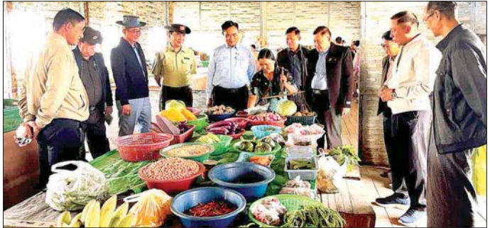
ကျေးရွာအတွင်း လှည့်လည်ကြည့်ရှုသည်။

စည်ပင်သာယာရေးတွင် ဆိုင်ခန်းများ ဖွင့်လှစ်ရောင်းချနေမှုတို့ကို သွားရောက်ကြည့်ရှု အားပေးသည်။ ထို့နောက် တီးတိန်မြို့နယ် ရောင်စောန်းစံပြကျေးရွာ အခြေခံပညာ မူလတန်းလွန်ကျောင်း၌ ကျောင်းအုပ်ကြီး၊ ဆရာ ဆရာမများနှင့်တွေ့ဆုံပြီး ကျောင်း၏ လိုအပ်ချက်များကို တာဝန်ရှိသူများနှင့် ပေါင်းစပ်ညှိနှိုင်း ဆောင်