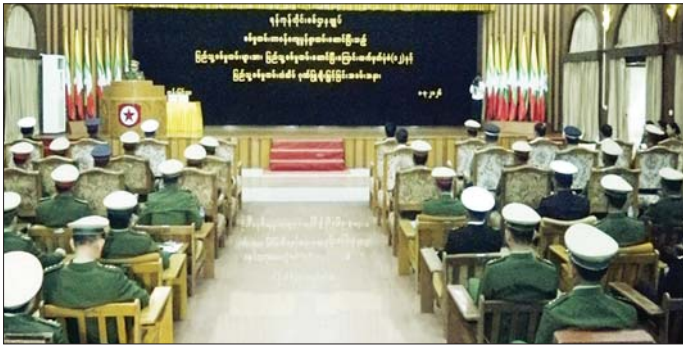
ရန်ကုန်တိုင်းစစ်ဌာနချုပ်ရှိ စစ်မှန်ထမ်းတာဝန်ကျေပွန်စွာ ထမ်းဆောင်ပြီးသည့် ပြည်သူ့စစ်မှန်ထမ်းများအား ပြည်သူ့စစ်မှန်ထမ်းဆောင်ပြီးမြောက်ကြောင်း လက်မှတ်ပုံစံ(၁)ရပ်နှင့် ပြည်သူ့စစ်မှန်ထမ်းတံဆိပ် ဂုဏ်ပြုချီးမြှင့်ခြင်းအခမ်းအနား ကျင်းပစဉ်။

များကို နိုင်ငံသားကောင်းများ ဝိသစ္စာ စွမ်းစွမ်းတစ် ထမ်းဆောင်ခဲ့ကြသော ပြည်သူ့စစ်မှန်ထမ်းများသည် ယခုအခါ သတ်မှတ်စစ်မှန်ထမ်းကာလ ပြည့်မြောက်ခဲ့ပြီ ဖြစ်သည်။ ထိုသို့ တာဝန်ကျေပွန်စွာ ထမ်းဆောင်ခဲ့ကြသည့် နိုင်ငံသားကောင်း ပြည်သူ့စစ်မှန်ထမ်းများအား ပြည်သူ့စစ်မှန်ထမ်းဆောင်ပြီးကြောင်းလက်မှတ် ချီးမြှင့်ပေးအပ်ခြင်းနှင့် ပြည်သူ့စစ်မှန်ထမ်းတံဆိပ်ဂုဏ်ပြုချီးမြှင့်ခြင်း အခမ်းအနားများကို ယနေ့တွင် တိုင်းစစ်ဌာနချုပ်အသီးသီး၌ ကျင်းပပြုလုပ်ရာ နေပြည်တော်ကောင်စီဥက္ကဋ္ဌ တိုင်းဒေသကြီးနှင့်ပြည်နယ်များမှ ဝန်ကြီးချုပ်များ၊ ကာကွယ်ရေး ဦးစီးချုပ်(ကြည်း) မှ တပ်မတော် အရာရှိကြီးများ၊ သက်ဆိုင်ရာ တိုင်းစစ်ဌာနချုပ် အသီးသီးမှ တိုင်းစစ်ဌာနချုပ်ဝန်ကြီးများနှင့် တာဝန်ရှိသူများ၊ ဌာနဆိုင်ရာတာဝန်ရှိသူများနှင့် သတ်မှတ်စစ်မှန်ထမ်းကာလကို တာဝန်ကျေပွန်စွာ