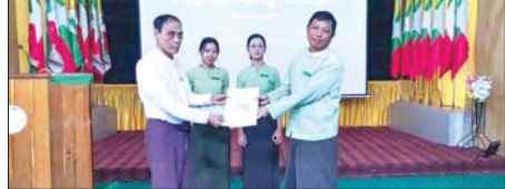
ပခုက္ကူမြို့နယ်၌ ကျေးရွာမြေငှားဂရုစာချုပ်ပေးအပ်ပွဲကို ဇွန် ၃၀ ရက် က မြို့နယ်အထွေထွေအုပ်ချုပ်ရေးဦးစီးဌာန မြေဧရာ(၁)ခန်းမ၌ ကျင်းပ ရာ ခရိုင်၊ မြို့နယ်စီမံခန့်ခွဲရေးနှင့် အုပ်ချုပ်ရေးကော်မတီဥက္ကဋ္ဌများ တိုင်းဒေသကြီးလွှတ်တော်ကိုယ်စားလှယ်တို့က ဆင်ဖြူကျွန်းကျေးရွာ ရှိ အိမ်ခြေ ၅၁ အိမ်ကို ကျေးရွာမြေငှားဂရုစာချုပ်များ ပေးအပ်ခဲ့။ တာမိသာ(ပခုက္ကူ)