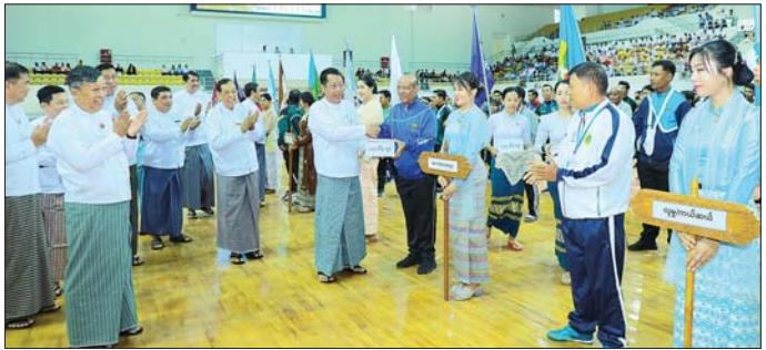
ပြိုင်ပွဲဝင် အမျိုးသားအသင်း ၁၄ သင်း၊ အမျိုးသမီး ဝါသနာရှင် မိဘပြည်သူများအနေဖြင့် မည်သူမဆို အသင်း ၆ သင်း စုစုပေါင်း ပြိုင်ပွဲဝင်အင်အား ၂၅၃ “အခမဲ့” လာရောက်ကြည့်ရှုအားပေးနိုင်ကြောင်း ဦးဝင်ရောက်ယှဉ်ပြိုင်ပွဲသွားမည်ဖြစ်ကာ အားကစား သိရသည်။ သတင်းစဉ်

တွင် ပါဝင်ကူညီအားဖြည့်ပေးခဲ့သည့် ဘင်ခရာအဖွဲ့နှင့် ဒိုင်လူကြီးများအတွက် ဂုဏ်ပြုချီးမြှင့်ငွေများ ပေးအပ်သည်။ (ယာပုံ) ကြည့်ရှုအားပေး ယင်းနောက် ၆ ပေါက်တန်း (အမျိုးသား) ပြိုင်ပွဲစွဲစစ်များအဖြစ် လျှပ်စစ်နှင့်စွမ်းအင်ဝန်ကြီးဌာန အသင်းနှင့် သိပ္ပံနှင့်နည်းပညာဝန်ကြီးဌာနအသင်း၊ အလုပ်သမားဝန်ကြီးဌာနအသင်းနှင့် သာသနာရေးဝန်ကြီးဌာနအသင်းတို့ ယှဉ်ပြိုင်ကစားမှုများကို ကြည့်ရှုအားပေးကြသည်။ ၂၀၂၆ ခုနှစ် ဝန်ကြီးဌာနပေါင်းစုံ ရိုးရာခြင်းလုံး (အမျိုးသား/ အမျိုးသမီး) ပြိုင်ပွဲကို နေပြည်တော် ဝဏ္ဏသိဒ္ဓိအားကစားရုံ(A)၌ ဇူလိုင် ၁ ရက်မှ ၆ ရက်အထိ ကျင်းပသွားမည်ဖြစ်ပြီး ဝန်ကြီးဌာနများမှ