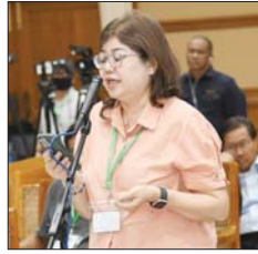
NHK သတင်းဌာနမှ ဒေါ်ခင်မိုးမြင့်