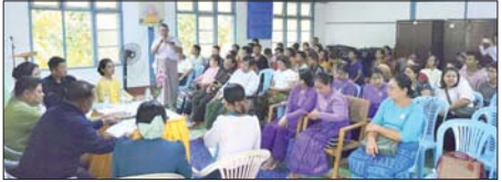
ရည်ရွယ်ချက်များကို ပြောကြား သည်။ ထို့နောက် တာဝန်ရှိသူများက အမှိုက်အမျိုးအစားများ၊ အိမ်နှင့်

ရည်ရွယ်ချက်များကို ပြောကြား သည်။ ထို့နောက် တာဝန်ရှိသူများက အမှိုက်အမျိုးအစားများ၊ အိမ်နှင့် ရွှေလှသား(ပြန်/ဆက်)