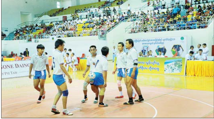
ဝန်ကြီးဌာနပေါင်းစုံ ရိုးရာခြင်းလုံးပြိုင်ပွဲတွင် ပါဝင်ယှဉ်ပြိုင်နေသည့် အသင်းတစ်သင်းအား တွေ့ရစဉ်။

နေပြည်တော် ဇူလိုင် ၁ အားကစားရေးရာဝန်ကြီးဌာန၊ အားကစားနှင့် ကာယပညာဦးစီးဌာနနှင့် မြန်မာနိုင်ငံ ရိုးရာခြင်းလုံးအဖွဲ့ချုပ် တို့ပူးပေါင်းကျင်းပသည့် “၂၀၂၆ ခုနှစ် ဝန်ကြီးဌာနပေါင်းစုံ ရိုးရာခြင်းလုံးပြိုင်ပွဲ” ဖွင့်ပွဲကို ယနေ့နံနက်ပိုင်းက နေပြည်တော် ဝဏ္ဏသိဒ္ဓိအားကစားရုံ(A)၌ ကျင်းပသည်။ စာမျက်နှာ ၁၇ ကော်လံ ၁ ❖