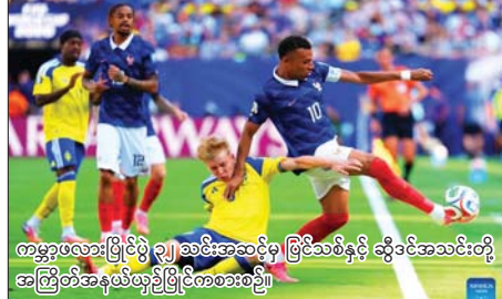
ကမ္ဘာ့ဖလားပြိုင်ပွဲ ၃၂ သင်းအဆင့်မှ ဖြိုင်သစ်နှင့် ဆွီဒင်အသင်းတို့ အကြိတ်အနုန်းယှဉ်ပြိုင်ကစားစဉ်။

ကမ္ဘာ့ဖလားပြိုင်ပွဲ ၃၂ သင်းအဆင့် မှ ဇူလိုင် ၁ ရက် နံနက် ၃ နာရီခွဲက ယှဉ်ပြိုင်ကစားခဲ့သည့် ပြင်သစ်နှင့် ဆွီဒင်အသင်းပွဲစဉ်တွင် ပြင်သစ် အသင်းက တိုက်စစ်ကစားသမား အစ်ဘာပေ၏ သွင်းဂိုးများနှင့် အတူ သုံးဂိုးပြတ် နိုင်ပွဲရရှိကာ ၁၆ သင်းအဆင့် တက်လှမ်းနိုင်ခဲ့ သည်။ စာမျက်နှာ ၁၁ ကော်လံ ၁ ❖