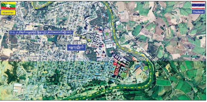
ကရင်ပြည်နယ် မြဝတီမြို့နယ် ရွှေကုက္ကိုလ်နယ်မြေရှိ အွန်လိုင်းလိမ်လည်လောင်းကစားမှုများ လုပ်ကိုင်ခဲ့ သည့် တရားမဝင် အဆောက်အအုံများအား ယာဉ်ယန္တရားဖြင့် ဖြိုချဖျက်ဆီးမှုနေရာပြမြေပုံ။