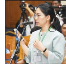
Nikkei Shimbun သတင်းဌာနမှ ဒေါ်နန်းပြည့်