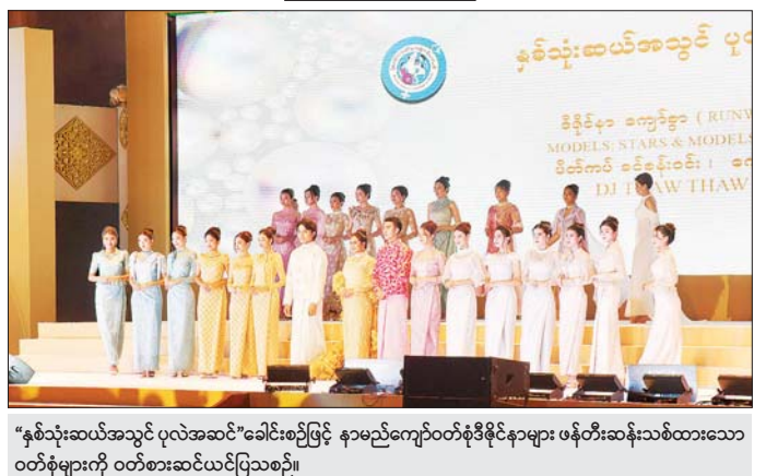
“နှစ်သုံးဆယ်အသွင် ပုလဲအဆင်”ခေါင်းစဉ်ဖြင့် နာမည်ကျော်ဝတ်စုံဒီဇိုင်းနာများ ဖန်တီးဆန်းသစ်ထားသော ဝတ်စုံများကို ဝတ်စားဆင်ယင်ပြသစဉ်။