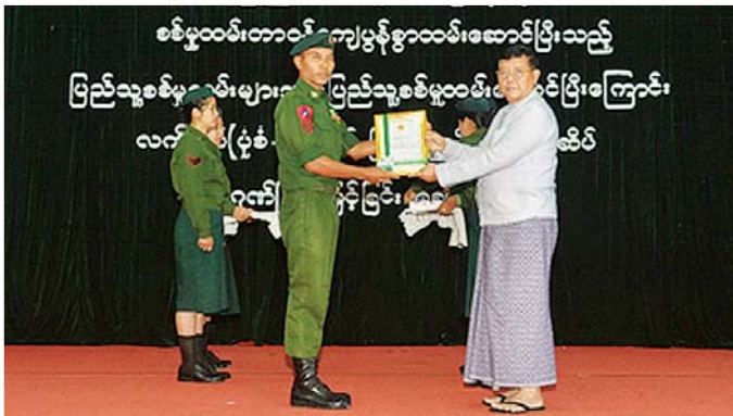
နေပြည်တော်ကောင်စီနယ်မြေအတွင်းရှိ စစ်မှုထမ်းတာဝန်ကျေနွှာထမ်းဆောင်ပြီးသည့် ပြည်သူ့စစ်မှု ထမ်းစစ်သည်များအား နေပြည်တော်ကောင်စီဥက္ကဋ္ဌ ဦးကျော်သန်းက ပြည်သူ့စစ်မှုထမ်းဆောင်ပြီး ကြောင်း လက်မှတ်နှင့် ပြည်သူ့စစ်မှုထမ်းတံဆိပ် ချီးမြှင့်ပေးအပ်စဉ်။

နေပြည်တော် ဇူလိုင် ၁ ပြည်ထောင်စုသမ္မတမြန်မာနိုင်ငံ တော် ဖွဲ့စည်းပုံအခြေခံဥပဒေ (၂၀၀၈ ခုနှစ်) ပါ ပြဋ္ဌာန်းချက်တွင် ပါဝင်သည့် “နိုင်ငံသားတိုင်းသည် ဥပဒေပြဋ္ဌာန်းချက်များနှင့်အညီ စစ်ပညာသင်ကြားရန်နှင့် နိုင်ငံ တော်ကာကွယ်ရေးအတွက် စစ်မှု ထမ်းရန် တာဝန်ရှိသည်” ဟူသည့် အချက်အား လက်တွေ့အကောင် အထည်ဖော်ခဲ့ပြီး ပြည်သူ့စစ်မှု ထမ်းဥပဒေအရ ပြည်သူ့စစ်မှုထမ်း အမှတ်စဉ် (၃/၂၀၂၄) တွင် မိမိဆန္ဒ အလျောက် စိတ်အားထက်သန်စွာ ပါဝင်စာရင်းပေးသွင်းကာ နိုင်ငံ တော်ကာကွယ်ရေးနှင့် နယ်မြေ တည်ငြိမ်အေးချမ်းရေး တာဝန် စာမျက်နှာ ၁၇ ကော်လံ ၁ ❖