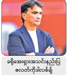
ခရိုအေးရှားအသင်းနည်းပြ ဇေလတ်ကိုဒါလစ်ချ်

ခရိုအေးရှားအသင်းကို ကမ္ဘာ့ဖလားပြိုင်ပွဲ ဆုတံဆိပ် နှစ်ကြိမ် ဆုတံဆိပ်ပေးနိုင်ခဲ့ပြီး နိုင်ငံသမိုင်းတစ်လျှောက် အဆောင်မြင်ဆုံး နည်းပြအဖြစ် မှတ်တမ်းဝင်ခဲ့သည့် ဇေလတ်ကိုဒါလစ်ချ်သည် ကိုးနှစ်နီးပါးတာဝန်ထမ်းဆောင်ပြီးနောက် ဇူလိုင် ၈ ရက်တွင် နည်းပြအဖြစ်မှ စာမျက်နှာ ၉ ကော်လံ ၅ ▼