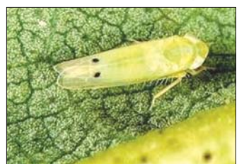
ဖြတ်စိမ်းပိုးအရွယ်ရောက်ကောင်

အဆင့် (၁) ဝါရွက်များ ထိခိုက်ပျက်စီးခြင်း၊ တွန့်လိမ်ခြင်း၊ ကျပ်ခြင်းမရှိဘဲ အကောင်းပကတိပုံစံရှိနေခြင်း၊ အဆင့် (၂) အပင်အောက်ပိုင်းရှိ အရွက်များဝါပြီး အနားများတွန့်လိမ်၍ ကျပ်နေခြင်း၊ အဆင့် (၃) အပင်အောက်ပိုင်းနှင့် အလယ်ပိုင်းရှိ ဝါရွက်များခြောက်သွေ့တွန့်လိမ်၍ ကျပ်နေခြင်း၊ အဆင့် (၄) တစ်ပင်လုံးရှိ အရွက်များ ဝါခြောက်ပြီး နီညိုရောင်သံကြေးရောင်သို့ ပြောင်းပြီး တွန့်လိမ်၍ကျပ်ခြင်း၊ အပင်ကြီးထွားမှုရပ်တန့်ခြင်းတို့ဖြစ်သည်။