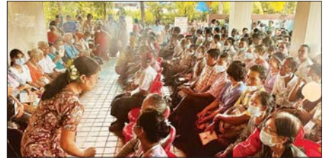
သီတဂူစတူဒီယိုဆေးရုံ (ရန်ကုန်) ၌ (၁၈) ကြိမ်မြောက်မျက်စိအလှူအတွက် လာရောက်ကုသသည့် မျက်စိဝေဒနာရှင်များအား တွေ့ရစဉ်။

သီတဂူစတူဒီယိုဆေးရုံ (ရန်ကုန်) ၏ ပထမအကြိမ်မှ (၁၈) ကြိမ်မြောက် မျက်စိအလင်းအလှူအထိ မျက်စိဝေဒနာရှင်စစ်ဆေးသင်လူနာ ၂၂၆၇၂ ဦး၊ ခွဲကုသမှု ၇၀၄၅ ဦးနှင့်လေဆာပစ်ကု ၄၄၉ ဦးကို စစ်ဆေးကုသပေးနိုင်ခဲ့ကြောင်း သိရသည်။ MT