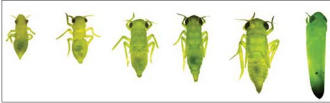
ပ-အဆင့် ၃-အဆင့် တ-အဆင့် စ-အဆင့် ပဉ္စမ-အဆင့် အကောင်ကြီး ဖြတ်စိမ်းပိုးအရွယ်ရောက်ကောင် ဖြစ်လာပုံအဆင့်ဆင့်။

ဝါပင်သည် စတင်စိုက်ပျိုးချိန်မှ ကောက်သိမ်းချိန်အထိ အင်းဆက်ပိုးမျိုးစိတ်ပေါင်း ၁၃၀၀ ကျော်ခန့်က ဖျက်ဆီးနိုင်သည်ဟု မှတ်တမ်းများအရ သိရှိရသည်။ ဝါပင်၏ ပြင်ပပုံသဏ္ဍာန်နှင့် အပင်စီမံဆိုင်ရာ တည်ဆောက်ထားမှုပုံသဏ္ဍာန် ထူးခြားချက်များက အခြားသီးနှံများထက် ပိုးကျရောက်ဖျက်ဆီးမှုပိုမိုများပြားစေရန် ဖန်တီးထားသကဲ့သို့ ဝါပင်ပေါ်ရှိ သီးပွင့်အင်္ဂါများသည် တစ်ချိန်တည်း တစ်ပြိုင်တည်းဖြစ်ပေါ်လာခြင်းမဟုတ်ဘဲ ဆင့်ကဲဆင့်ကဲ ဖြစ်ပေါ်လာသဖြင့် ပိုးမွှားများအတွက် အစာအာဟာရများကို မပြတ်ထောက်ပံ့ပေးသကဲ့သို့ ဖြစ်နေသည်။