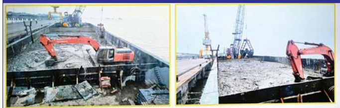
ကျားပစ်သောင်တူးရေယာဉ် M.V.Mercury Force ဖြင့် သောင်တူးဖော်ခြင်း