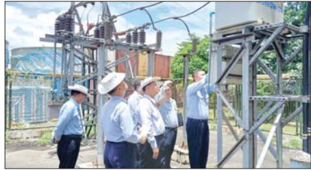
ရန်ကုန်လျှပ်စစ်ဓာတ်အားပေးရေးကော်ပိုရေးရှင်းဥက္ကဋ္ဌ၊ ရုံးချုပ် နှင့် ခရိုင်တို့မှ တာဝန်ရှိသူများက ဇူလိုင် ၄ ရက်တွင် မှော်ဘီမြို့နယ် ၌ ဇွန်လအတွက် စတုတ္ထနေ့အဖြစ် မိဘဖတ်ရွတ်ထားမှု၊ လျှပ်စစ် ဓာတ်အားဖြန့်ဖြူးထားမှုနှင့် လျှပ်စစ်ဓာတ်အားလေလွင့်ပျောက်ဆုံး မှုလျှော့ချရေး ဆောင်ရွက်မှုများကို ကြည့်ရှုစစ်ဆေးစဉ်။ (YESC)

ပြန့်ပွားရေး ဆရာဖြစ်သင်တန်း ဖွင့်လှစ်ခြင်း၏ ရည်ရွယ်ချက် များနှင့်စပ်လျဉ်း၍ ရှင်းလင်း ပြောကြားခဲ့သည်။ အဆိုပါသင်တန်းသို့ ရပ်ကွက် နှင့် ကျေးရွာအုပ်စု အုပ်ချုပ်ရေး မှူး စုစုပေါင်း ၉၀ တက်ရောက် ကြပြီး နှစ်ရက်ကြာ သင်ကြား ပို့ချသွားမည်ဖြစ်ကြောင်း သိရ သည်။