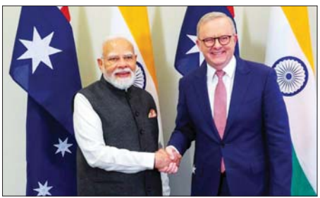
ရည်ရွယ်ချက်များအတွက် အသုံးပြုရန် အိန္ဒိယသို့ ယူရေနီယံတင်ပို့မည့် သဘောတူညီချက်ကို လက်မှတ်ရေးထိုးခဲ့ကြောင်း အယ်လ်ဘားနီးစီက ဇူလိုင် ၉ ရက်က မဲလ်ဘုန်းမြို့၌ ကျင်းပသည့် တတိယအကြိမ်မြောက် ဩစတြေးလျ-အိန္ဒိယ ထိပ်သီး အစည်းအဝေးတွင် ဆင်ယူာ

မဲလ်ဘုန်း ဇူလိုင် ၉ ဩစတြေးလျဝန်ကြီးချုပ် အန်တိုနီ အယ်လ်ဘားနီးစီနှင့် အိန္ဒိယဝန်ကြီး ချုပ် နာရန်ရာမိုဒီတို့သည် ဇူလိုင် ၉ ရက်က သဘောတူညီချက် တစ်ရပ်တွင် လက်မှတ်ရေးထိုးခဲ့ပြီး သဘောတူညီချက်အရ ဩစတြေးလျနိုင်ငံက နျူကလီးယားစွမ်းအင်အတွက် အသုံးပြုမည့် ယူရေနီယံကို အိန္ဒိယနိုင်ငံသို့ တင်ပို့မည်ဖြစ်ကြောင်း သိရသည်။ လက်ရှိ နျူကလီးယားပေါင်းဆောင်ရွက်မှု သဘောတူညီချက်အောက်တွင် ငြိမ်းချမ်းသော