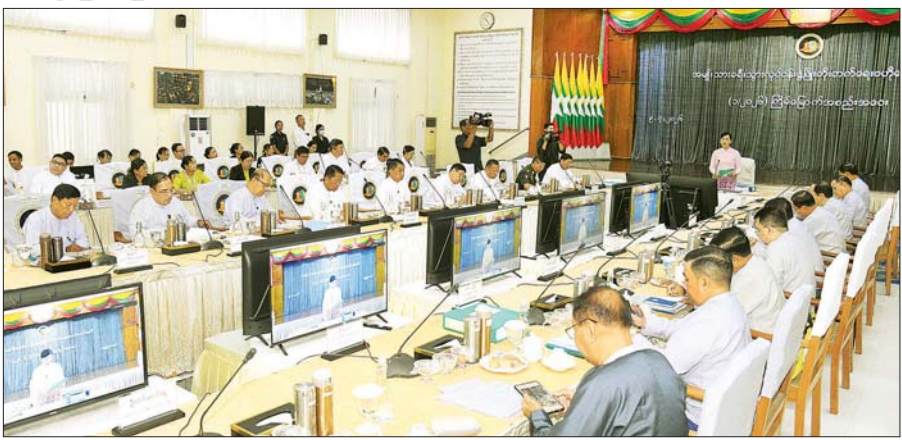
ဒုတိယသမ္မတ ဒေါ်နန်းနီနီအေး အမျိုးသားခရီးသွားလုပ်ငန်းဖွံ့ဖြိုးတိုးတက်ရေးဗဟိုကော်မတီ (၁/၂၀၂၆) ကြိမ်မြောက် အစည်းအဝေးတွင် အမှာစကားပြောကြားစဉ်။

အစည်းအဝေးသို့ ဗဟိုကော်မတီဝင် ပြည်ထောင်စုဝန်ကြီးများ၊ ဒုတိယဝန်ကြီးများ၊ နေပြည်တော် ကောင်စီဥက္ကဋ္ဌ၊ ဌာနဆိုင်ရာအကြီးအကဲများ၊ ခရီးသွားလုပ်ငန်းဆိုင်ရာ တတ်သိပညာရှင်များ၊ ပုဂ္ဂလိက ခရီးသွားလုပ်ငန်းအဖွဲ့အစည်းများမှ ကိုယ်စားလှယ်များနှင့် တာဝန်ရှိသူများ တက်ရောက်ကြပြီး တိုင်းဒေသကြီးနှင့် ပြည်နယ်များမှ ဝန်ကြီးချုပ်များနှင့် တာဝန်ရှိသူများက ဗီဒီယိုကွန်ဖရင့်စနစ်ဖြင့် တက်ရောက်ကြသည်။