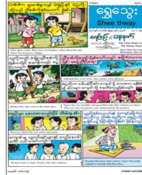
ကဏ္ဍကဏ္ဍအပါအဝင် အင်္ဂလိပ်စာကဏ္ဍ စုံလင်စွာဖြင့် ထွက်ရှိပြန်ပါသည်။ တစ်စောင်လျှင် ငွေကျပ် ၄၀၀ ဖြင့် စာပေဗိမာန်စာအုပ်အရောင်းဆိုင်များတွင် ဝယ်ယူရရှိနိုင်ပါသည်။ သတင်းစဉ်