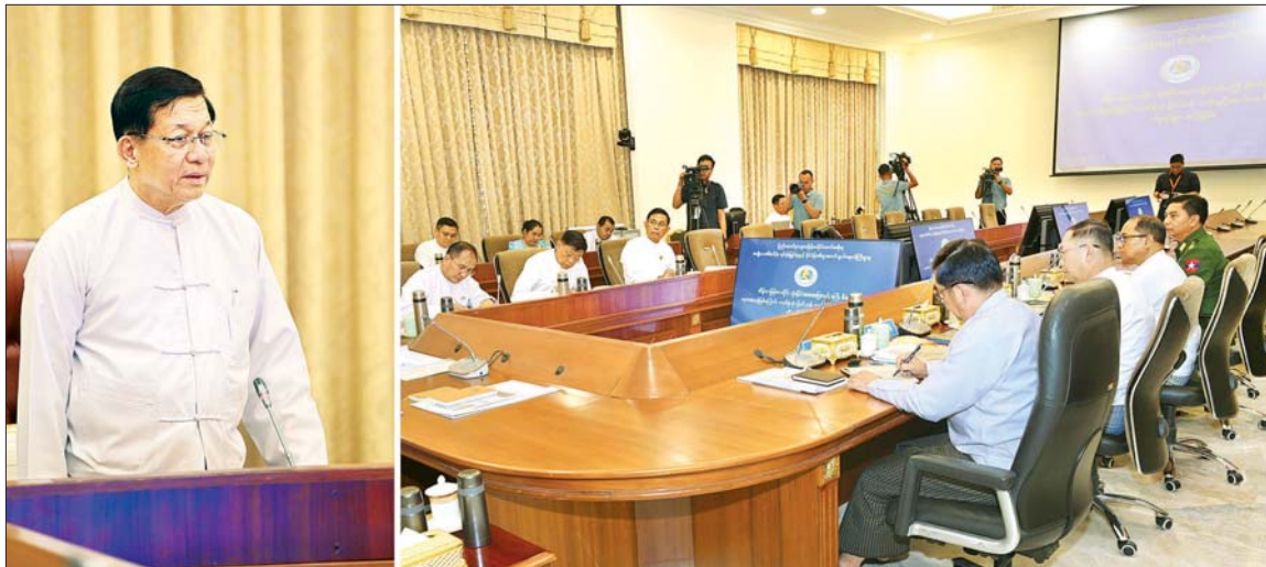
နိုင်ငံတော်သမ္မတ ဦးမင်းအောင်လှိုင် အိန္ဒိယ-မြန်မာ-ထိုင်း သုံးနိုင်ငံအဝေးပြေးလမ်းမကြီး စီမံကိန်းနှင့် ကုလားတန်မြစ်ကြောင်း ဘက်စုံသုံး ဖြတ်သန်းသယ်ယူပို့ဆောင်ရေး စီမံကိန်းဆိုင်ရာညှိနှိုင်းအစည်းအဝေးတွင် အမှာစကား ပြောကြားစဉ်။