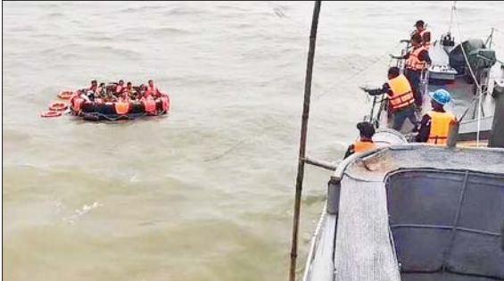
တပ်မတော်(ရေ)မှ တပ်ဖွဲ့ဝင်များက ကူညီကယ်ဆယ်ရေးလုပ်ငန်းများ ဆောင်ရွက်ပေးစဉ်။

နေပြည်တော် ဇူလိုင် ၉ တနင်္သာရီတိုင်းဒေသကြီး ဟိန်းခဲတုတ်ကျွန်းအနီး မြန်မာ့ပင်လယ်ပြင်အတွင်း လုံခြုံရေးဆောင်ရွက်နေသည့် တပ်မတော်(ရေ)မှ တပ်ဖွဲ့ဝင်များသည် ကုလားကုတ်ကျွန်း၏ အနောက်ဘက် ရေမိုင် ၂၇ ဒသမ ၅ မိုင်အကွာ၌ MV ATK Nyein အမည်ရှိ ကုန်တင်ရေယာဉ်တစ်စင်း ရေဝင်နစ်မြုပ်နေကြောင်း MV Oceanstar ကုန်တင်ရေယာဉ်၏ သတင်းပေးပို့ချက်အရ သွားရောက်၍ ရှာဖွေကယ်ဆယ်ရေးလုပ်ငန်းများဆောင်ရွက်ရာ ဇူလိုင် ၈ ရက် ည ၆ နာရီခွဲတွင် ရေဝင်နစ်မြုပ်နေသည့် ကုန်တင်ရေယာဉ်အား တွေ့ရှိခဲ့ပြီး ကုန်တင်ရေယာဉ်ပေါ်တွင် လိုက်ပါလာသော အမှုထမ်း ၁၂ဦးအား စစ်ရေယာဉ်ပေါ်သို့တင်ဆောင်ကာ စာမျက်နှာ ၉ ကော်လံ ၁ ဝ